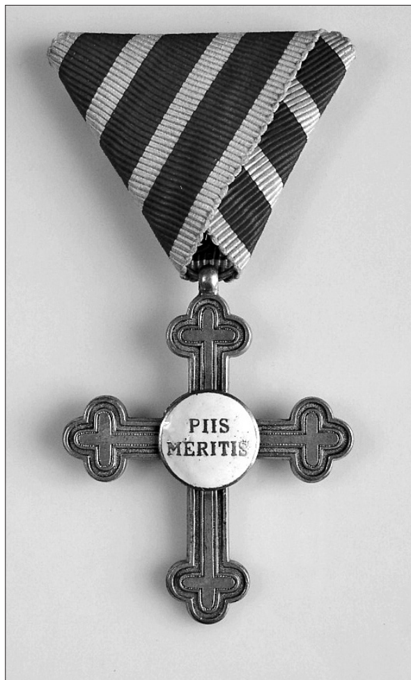
Zlati zaslužni dubovniški križec piis meritis 1. stopnje. 69

O omenjenem prejtem odlikovanju je Čarman v posebnem pismu z nemalo ponosa obvestil lavantinskega škofa in ga prosil, naj v naslednjem šematizmu ustrezno navedejo njegovo odlikovanje. 70