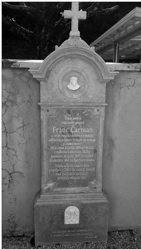
Čarmanov nagrobnik na tržiškem pokopališču pred obnovo in tik pred njenim zaključkom (foto: Miha Šimac, 2020).

zagrozili, da bodo zavzeli še strožje stališče, češ da bi lahko kot predmet ustanove priznali šele dan, ko sta deželna vlada in knezoškofijski ordinariat izjavila, da ni upanja za ustanovitve samostojne župnije. 176