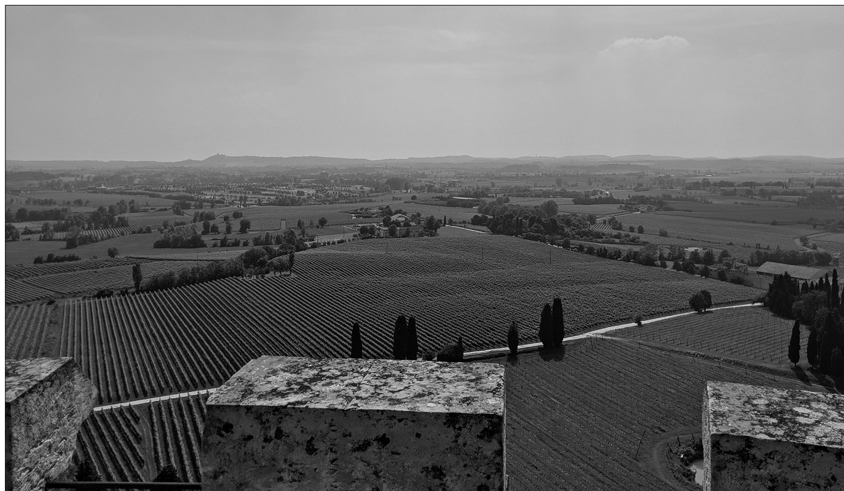
Pogled s stolpa sv. Martina (takratnih avstrijskih položajev) proti Solferinu.

Sardincem. Salzburški polk Rainerjev je svojo požrtvovalnost plačal z 72 mrtvimi, 324 ranjenimi in 105 pogrešanimi, med katerimi so bili večinoma ranjenci, ki so padli v piemontsko vojno ujetništvo. Smrt je med njimi tudi v prihodnjih dneh precej kosila, saj so zaradi neustrezne zdravstvene oskrbe življenja izgubili številni ranjeni častniki in vojaki. 59 Trpljenju pod žgočim soncem zapuščenih ranjencev na bojnih poljanah je bil priča mladi švicarski poslovnež Jean-Henri Dunant (1828–1910); kalvarija teh nesrečnežev ga je tako globoko pretresla, da je skupaj z nekaterimi somišljeniki že februarja 1863 v Ženevi ustanovil Mednarodni Rdeči križ. 60