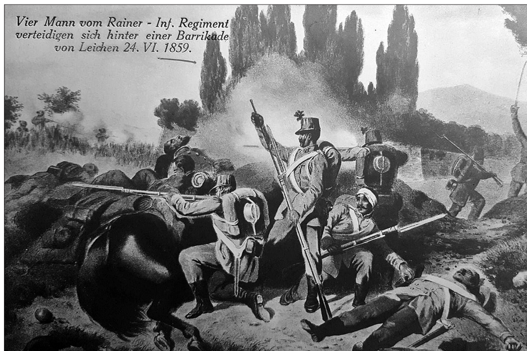
Vier Mann vom Rainer - Inf. Regiment verteidigen sich hinter einer Barrikade von Leichen 24. VI. 1859.

Vojaki polka Rainer v bitki leta 1859 – spominska razglednica ( http://www.rainerregiment.at/joomla/images/geschichte/patriotischetexte/1859.jpg (2. 8. 2020)).