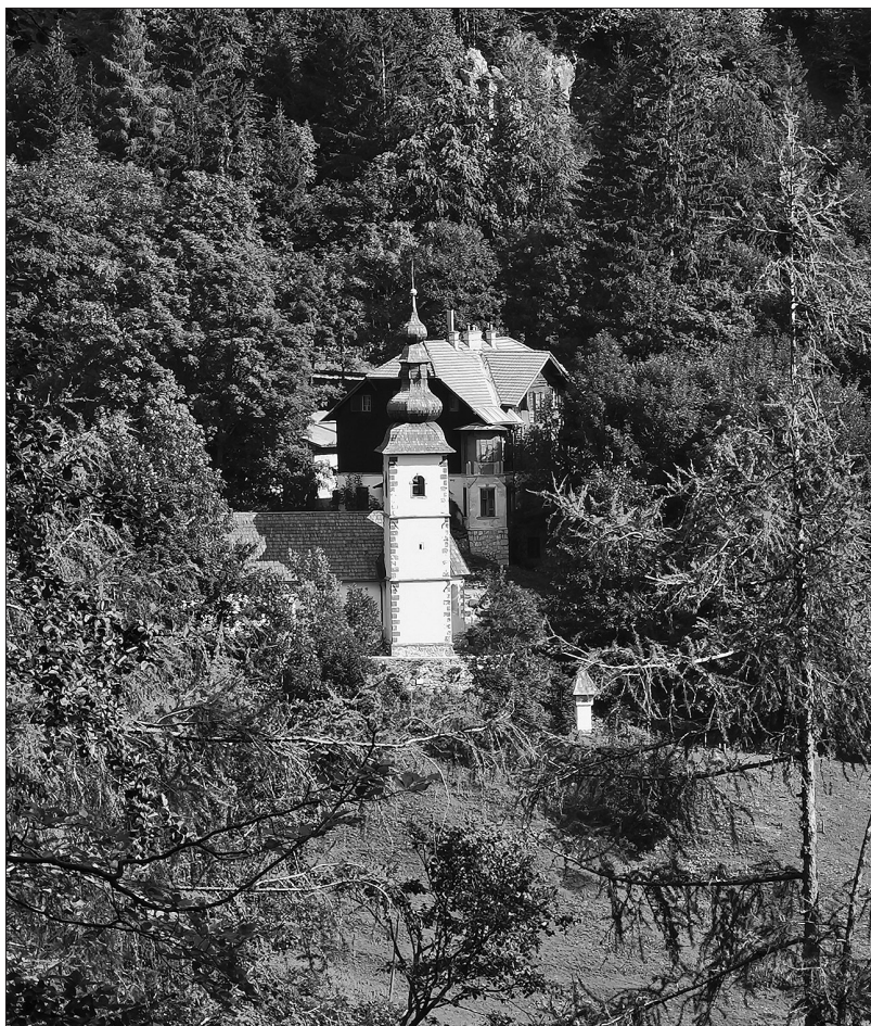
Pogled na cerkev sv. Ane in nekdanje Bornovo letovišče leta 2020.