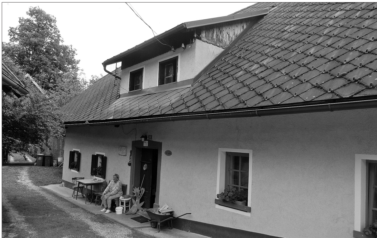
Ukanova domačija (Sv. Ana št. 18), hiša prve šentanske šole (foto: Urša Frelih Meglič, 2020).

1883 sprva volil za šolo, že 27. januarja 1885 prodal in si v njej pridržal »pravico dosmrtnega užitka severne hišne polovice«. To je povzročilo nemalo težav ter več obravnav šolskih oblasti in okrajnih šolskih svetov. Špendal je posebej izpostavil šolsko obravnavo, ki je »na licu mesta« potekala 28. julija 1887. Takrat je tudi sam podal stališče o šoli, kar je bilo zabeleženo v zapisniku, ki ga je ob tej priložnosti povzemal: »Moje stališče je bilo jasno: zoper šolo v šentanski dolini sploh nisem, sem pa zoper šolo v hiši št. 18. Navedel sem bil zoper šolo v hiši št. 18 sedem vzrokov, katere sem vse podpiral s postavnimi šolskimi določili. C. kr. okr. š. svet je v razglasu dne 13. avg. 1888, št. 548 uvaževal moj govor, ker se v razglasu bere: 'Krajnega sveta načelnik gospod farni oskrbnik pa ni sploh zoper šolo in priznava potrebo šole za šentansko občino glede števila otrok itd. – ali on je zoper šolo v hiši št. 18. itd.' – Odlök se glasi, da zadostujejo prostori šoli za silo, šola se ima v hiši št. 18 pričeti za čas, dokler si ne napravi občina šentanska svoje v vseh obzirih postavno dodelane lastne šole.« 134