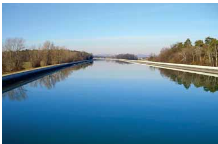
Dravski kanal.