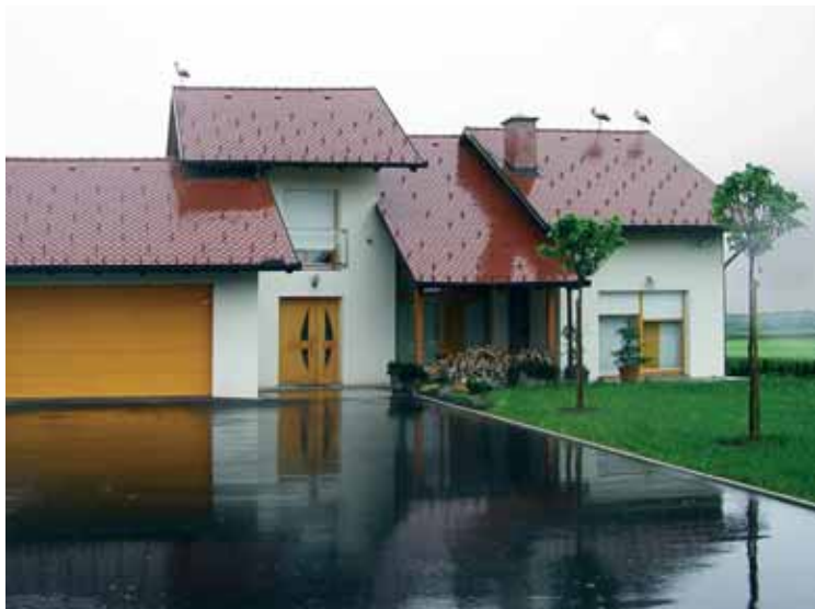
Štorklje na strehi.