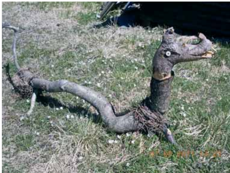
Zmaj na Kopah.