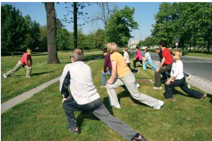
Ogrevanje pred pohodom