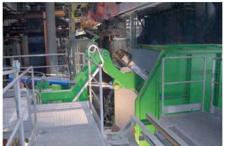
Pogled na zgornji del nagibne naprave in servisni podest