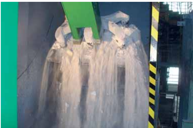
Nagibna naprava, vpenjanje anodnega ostanka s kriolitom