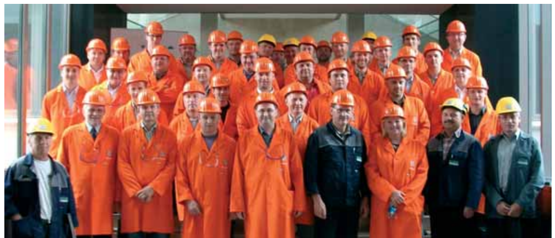
Udeleženci srečanja predstavnikov pogodbenih partnerjev Društva vzdrževalcev Slovenije

Ob tej priložnosti bi se vsem sodelujočim pri organizaciji srečanja želel tudi osebno zahvaliti. □