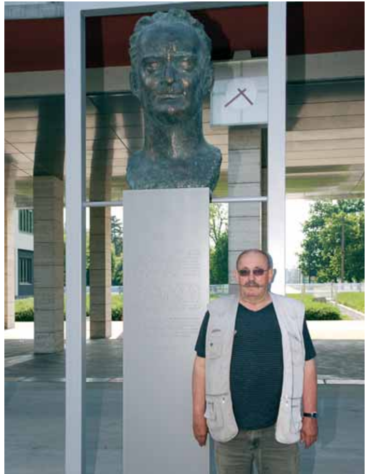
Avtor kipa akademski kipar Viktor Gojkovič