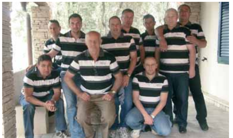
Anodarji pred Talumovo počitniško hišo