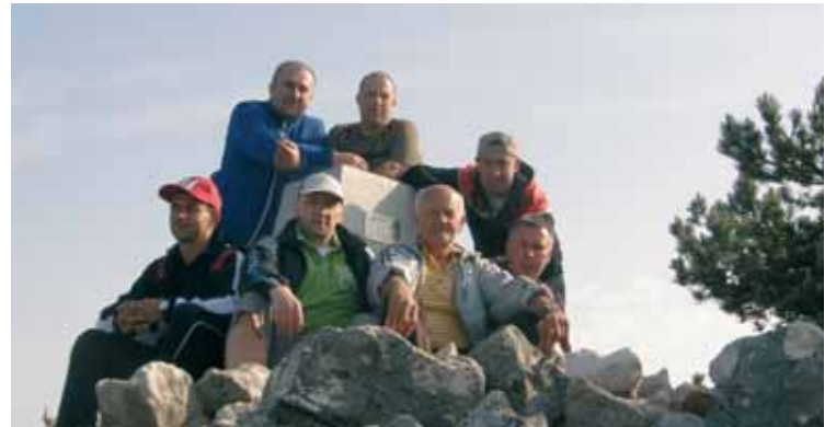
Anodarji na Televrinu

Življenje je tisto, kar se zgodi, medtem ko delaš načrte. p