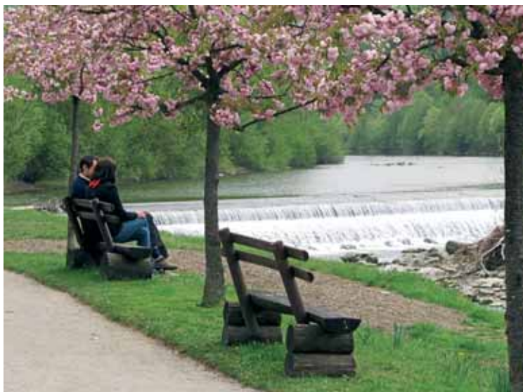
Ljubezen v maju.