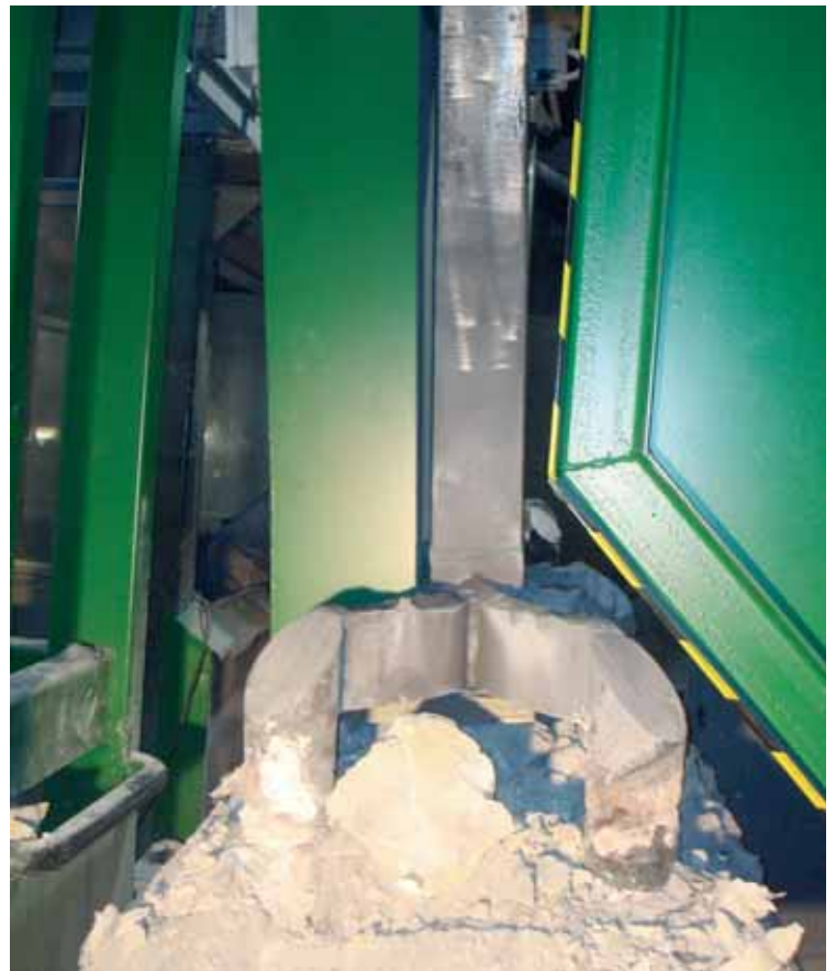
Nagibna naprava pri stresanju kriolita

Po končanem preizkusu in v fazi preizkusnega delovanja je bilo treba urediti še manjše pomanjkljivosti, izvesti odpraševanje, dokončati servisni podest in pripraviti vse potrebno za pregled naprave za izdajo obratovnega dovoljenja; pregled so opravili naši varnostni inženirji in predstavnik IVD Maribor. Naprava je od 30. marca 2011 redno vključena v proizvodni proces. □