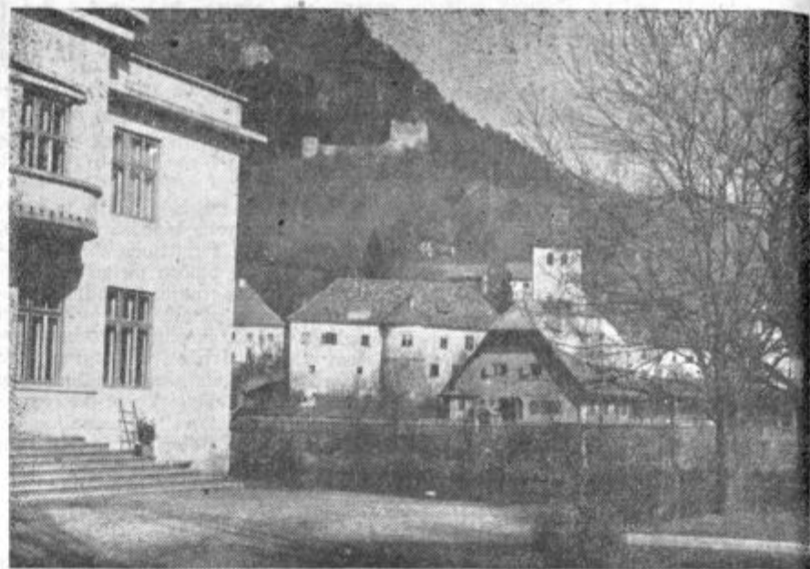
Laško — pogled izpred doma »Partizana« na del mesta s starim župniščem in starim gradom na strmem pobočju Huma