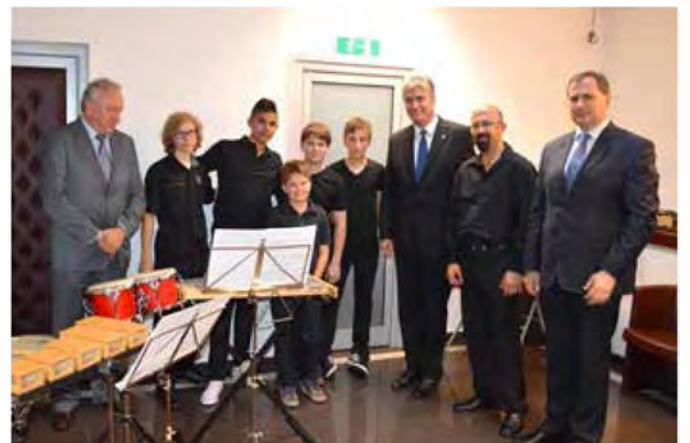
Tolkalisti GŠ Beltinci zaigrali na slovensko - makedonskem kulturnem večeru v Bruslju