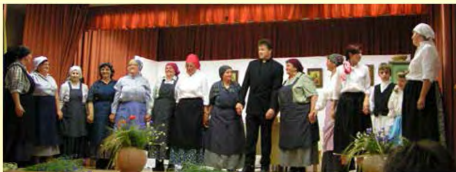
Nastopajoči na svečani slovesnosti ob zaključku Jeričevih dnevo