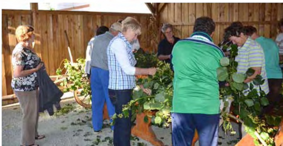
Za zdravilen in okusen lipov čaj se bo potrebno odpraviti v cimprano ižo pod Lipo