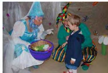
Otroci so s pomočjo vil in škratov odškrnili vrata v hišo pravljíc