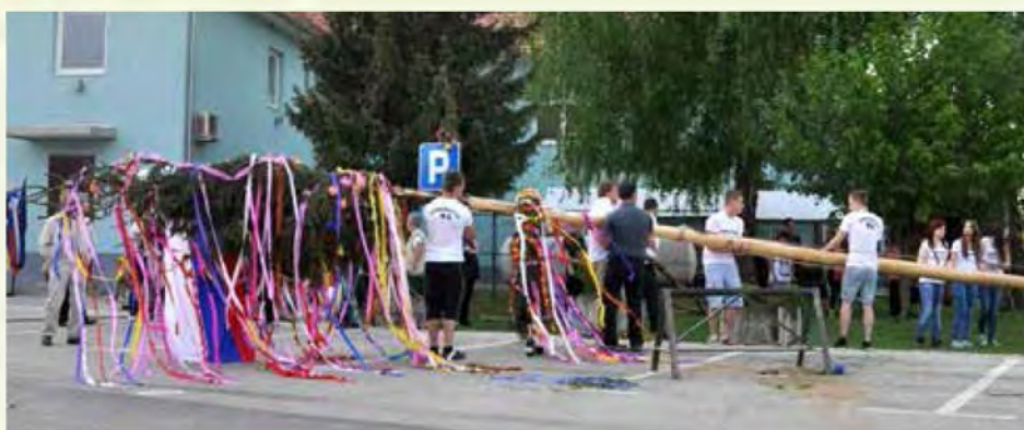
Prvič so mlaj postavili rekruti v sodelovanju s KTD Dikležovje