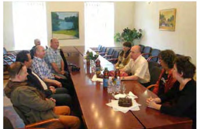
Galeristi in umetniki iz poljskega Olkusza na sprejemu pri županu

Občino Beltinci je množici obiskovalcev predstavil tudi Zavod za turizem in kulturo Beltinci