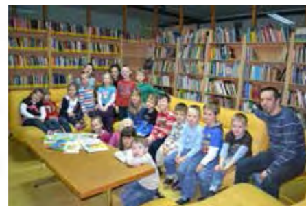
Prvošolci so spoznali, kaj pomeni požirati knjige