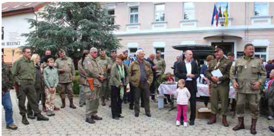
Vojaške starodobnike je v Prekmurje povabilo društvo Jeep klub - Veteran iz Murske Sobote

Člani kluba so svojo pot nadaljevali proti Odrancem, Črenšovcem, Strehovcem in preko Dobrovnika ter Kobil-