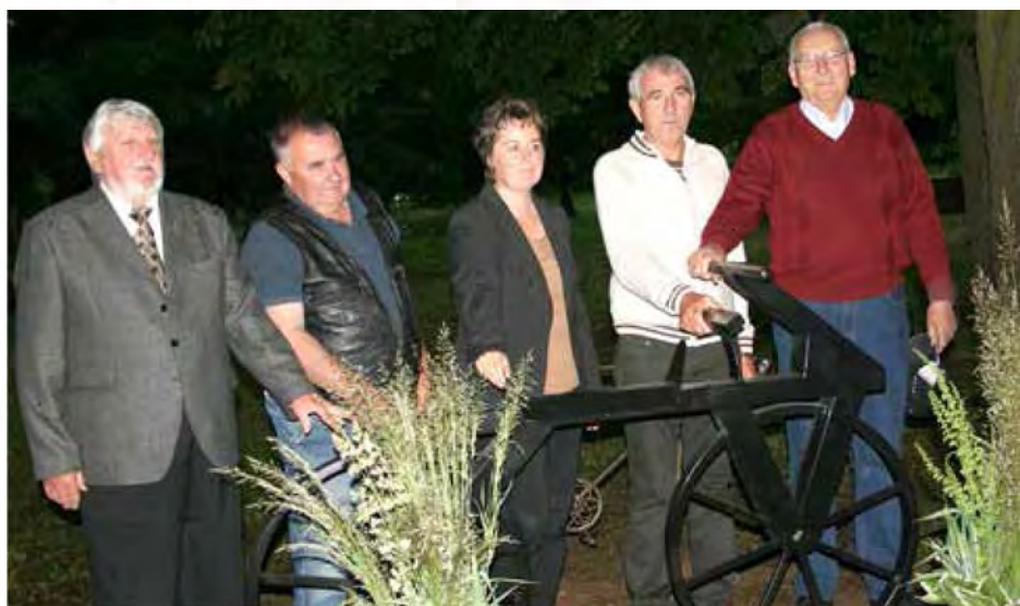
Slavnostno odkritje tretje replike starega kolesa v beltinskem parku

Naš izdelek, ki je tretji, bi ga imenoval bajpas , da bo nekaj v tem parku ostalo. Naša volja je trdna, zato je tu tretja maketa, ki bo dala malo življenja, omogočila obiskovalcem, krajanom in občanom, da vidijo tudi ta del etno-kul-