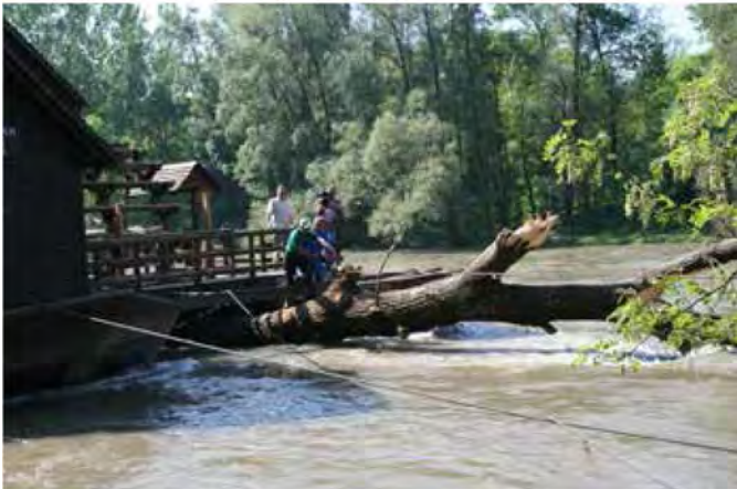
Ižakovčarji uspešno rešili mlin na Muri v petek, 10. maja 2013

Drevo - topol v dolžini dobrih 20 metrov, s premerom 1 meter in pol - je reka prinesla pod mlin med oba kumpa in vodno kolo v torek, 07.05.2013