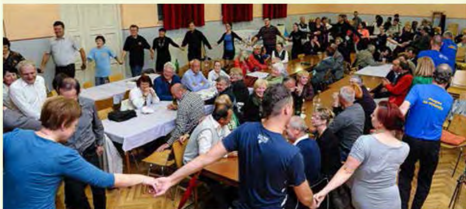
Savinjčani in Prekmurci smo skupaj zaplesali tudi Marko skače

Folklorna skupina Kulturnega društva Petrovče je v goste na letni koncert z naslovom Prekmurski večer povabila folklorne Kulturnega društva »Marko« Beltinci .