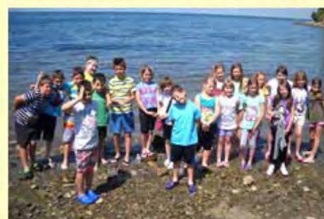
Tretješolci OŠ Beltinci so tudi letos šolo v naravi na Debelem rtiču preživeli zabavno in poučno