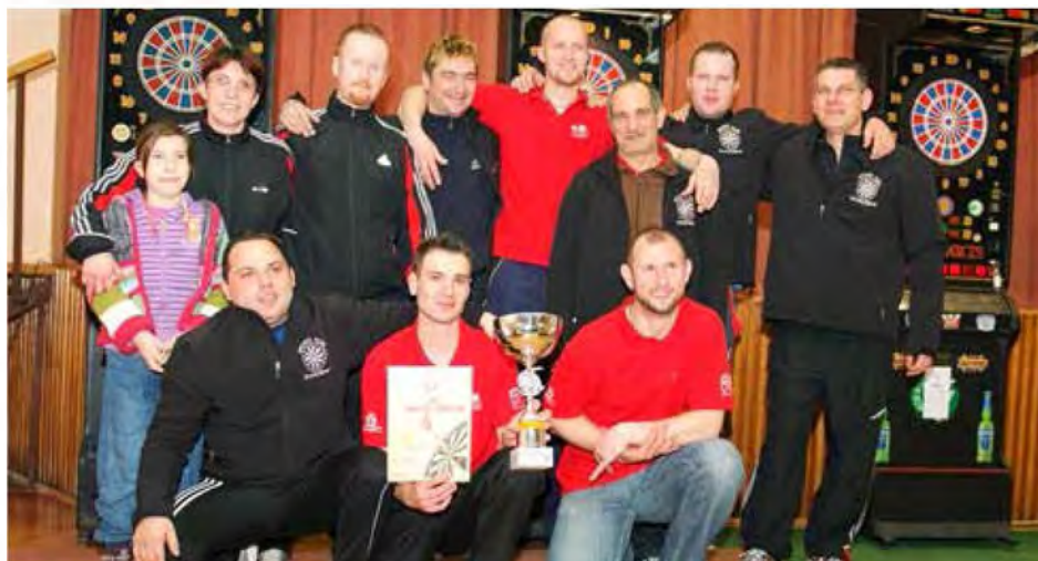
Najboljši pikadisti in pikadistke v pomurski ligaški sezoni 2012/2013

Zmagovalec lige, ekipa ŠD Dokležovje, je organiziral tudi zaključni turnir za igralce, ki so sodelovali v ligi. Udeležilo se ga je 54 igralcev in igralcev. Pomerili so se v moški in ženski kategoriji ter v dvojicah.