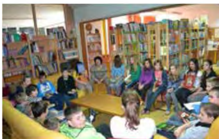
Knjiga mojega otroštva