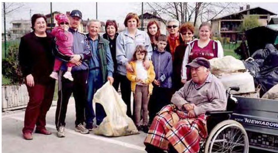
Del skupine "čistilcev" v akciji Očistimo Dokležovje

Med čistilno akcijo so nam nekateri, ki so se peljali mimo nas, samo posmehljivo pomahali v pozdrav, kar lahko razumemo kot: »Vi kar čistite, mi pa bomo spet smetili.« Je že tako, da se akcije udeležujejo vedno tisti, ki so najbolj osveščeni in ki postavljajo