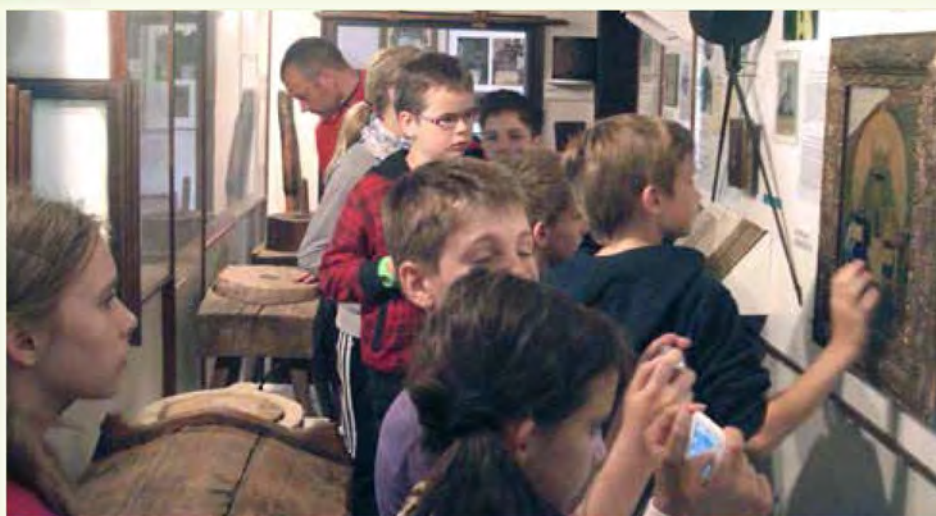
Na taboru so se nadarjeni učenci naučili veliko novega in spoznavali svet vzhodnega Goričkega