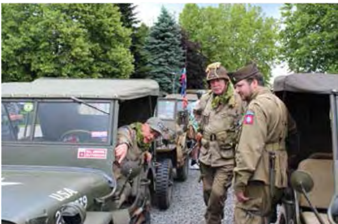
Lastniki vojaških starodobnikov v sproščenem klepetu pred občinsko stavbo