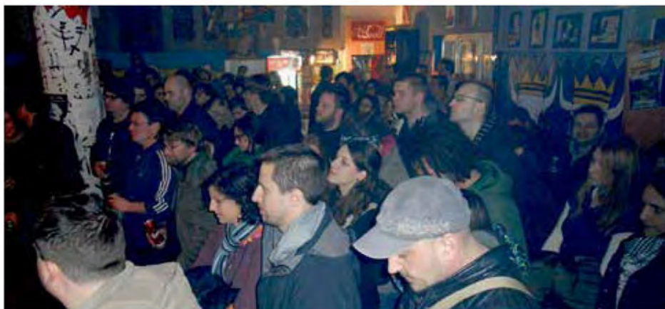
V pričakovanju »Demolition Group«

Že dan zatem, 29.marca , so nas obiskali Američani »My Education«, ki po mnenju poznavalcev sodijo v drugo ligo svetovnega post-rocka, prihajajo pa iz tekasaškega mesta Austin, ki zavzema izjemno visoko pozicijo v zgodovini