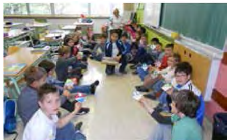
Knjižne oznake so dobile svoje lastnike