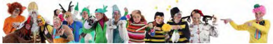
Gledališče je najlepša pot do otrok

Blagoslovljena sem z možnostjo, da z ekipo čudovitih ljudi in talentiranih umetnikov ustvarjam najlepše predstave za otroke. Takšne, ki vzgajajo, se jih dotaknejo, ki vzbujajo radovednost, ki učijo, nasmejejo in ostanejo za vedno. Takšne, ki nagovarjajo in bogatijo tudi učitelje, vzgojitelje in starše. Takšne, ki marsikaj pokažejo, sporočijo, povejo in pomagajo razumeti. Takšne, ki jih otroci razumejo. Takšne, ki ustvarjajo svet, v katerem je lepše odraščati in v kater-