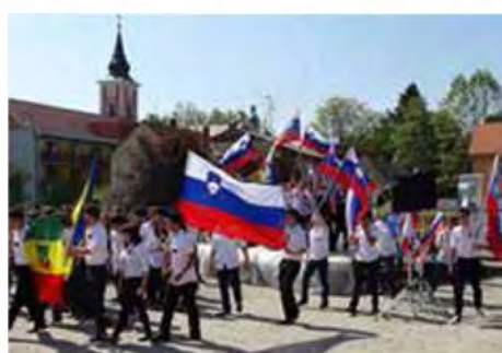
Slovenska zastava ponosno vihra v rokah letošnjih rekrutov

Petek, 10. maja 2013, je bil za rekrute in rekrutke, rojene leta 1995, iz petih prekmurskih občin poseben in nepozaben dan. Po naporni četrtekovi noči, ki je sledila okrašanju prikolic in pripravam na petkov praznik, je bilo zgodnje jutranje prebujanje precej naporeno opravilo. Toda časa ni bilo veliko. Treba se je bilo urediti in obleči za prav posebno priložnost. Bela srajca,