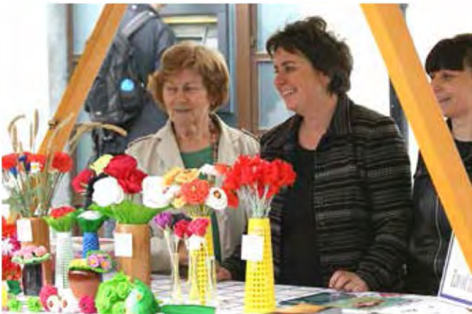
DIŠI PO PREKMURJU, Ljubljana, 1. junij 2013

Občino Beltinci je množici obiskovalcev predstavil tudi Zavod za turizem in kulturo Beltinci