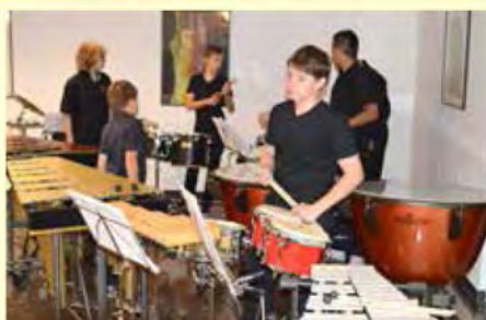
Tolkalisti GŠ Beltinci med nastopom v Bruslju