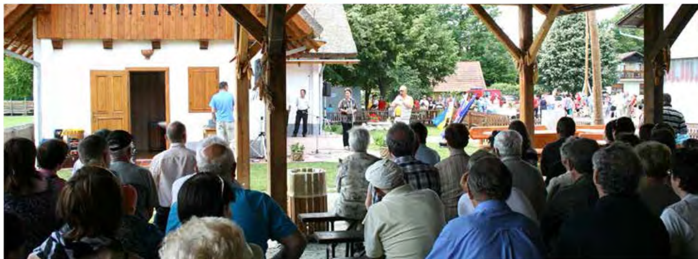
Predstavitve zbornika Skrivnostni večeri pod gümlo

Zavod za turizem in kulturo Beltinci, Turistično društvo Lipa in KS Lipa smo 09.06.2013 pripravili dogodek v okviru 6. Langašijade v Lipi, na katerem smo javno predstavili zbornik »Skrivnostni večeri pod gümlo«. Zbornik, ki spada med aktivnosti projekta »Gümlo«, smo izdali v nakladi 500 izvodov, dobiti pa ga je možno v pisarni Zavoda za turizem in kulturo Beltinci v beltinskem gradu.