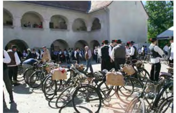
Enajsti rally s starodobnimi kolesi je potekal v lepem sončnem vremenu

Drevo - topol v dolžini dobrih 20 metrov, s premerom 1 meter in pol - je reka prinesla pod mlin med oba kumpa in vodno kolo v torek, 07.05.2013