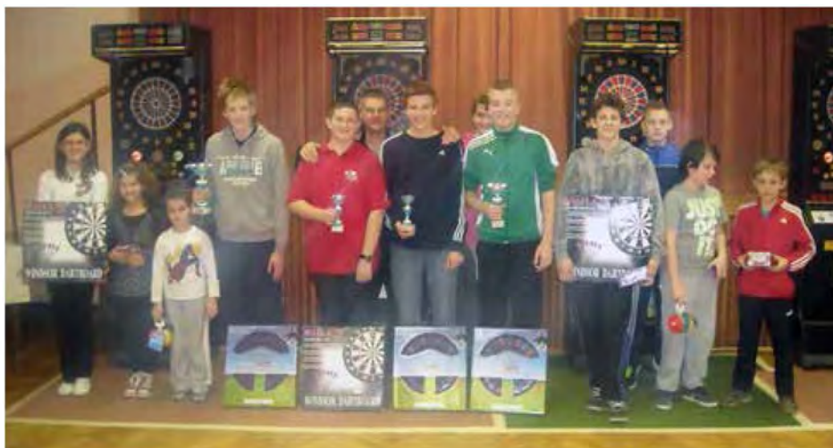
Prejemniki pokalov in praktičnih nagrad so se ponosno nastavili objektivu

Turnir se je začel s tekmovanjem naših najmlajših, ki so se pomerili v igri Highscore, nadaljevali smo s turnirjem v izžrebanih dvojicah, končali pa z moško in žensko konkurenco.