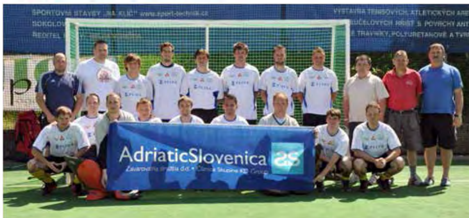
Ekipa HK Lipovci na stadionu v Pragi

Na drugi tekmi so igralci HK Lipovci doživeli visok poraz proti HC Minsk z rezultatom 0:7, kar ob poznavanju razmer sploh ni bilo presenetljivo. Igralci te ekipe so izključno profesionalci, trenirajo dvakrat na dan, pripeljali so se s svojim avtobusom v klubskih barvah,