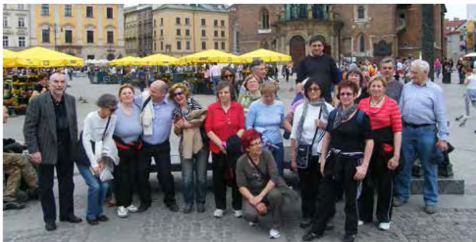
Lipovska skupina na glavnem trgu v Krakowu