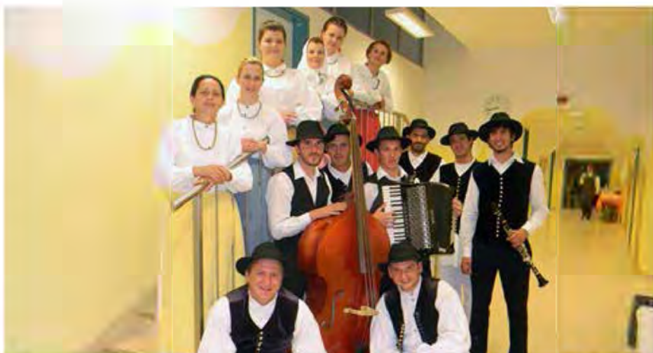
Z veseljem smo se odzvali tudi povabilu na Mednarodni folklorni festival v Rakeku

Članska folklorna skupina je sodelovala na Mednarodnem folklornem festivalu na Rakeku, bili so tudi gostje na Hrvaškem ob festivalu v Prelogu, o