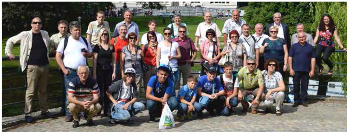
OO SDS v Bruslju pred Evropskim parlamentom

Občinski odbor Slovenske demokratske stranke se je z velikim veseljem odzval povabilu evropskega poslanca dr. Milana Zvera in 17. in 18. junija obiskal Bruselj ter si ogledal eno najpomembnejših političnih institucij v Evropi. Po štirinajstih urah nočne vožnje smo si najprej ogledali strogi center Bruslja, ob 18.00 uri pa smo se udeležili Slovensko – makedonskega kulturnega večera. Kulturni program je izvedla Tol-