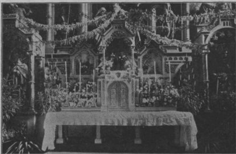
Veliki oltar v Čresovskoj cerkvi ob priliki 25 letnice Marijínoga Lista, pri šterom se je slüžila pontifikalna sv. meša.