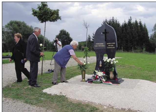
Spominski steber stogi v nauvom tali graubišča

za nji. Moram priznati, ka na začetki sem se nej strinjala z idejov, ka sem pravla, ka Boga gde koli leko zmolim za koga štjem, pa spomenike bi raj postavila tistim, šteri so doma ostali, pa tü trpali, dapa končno