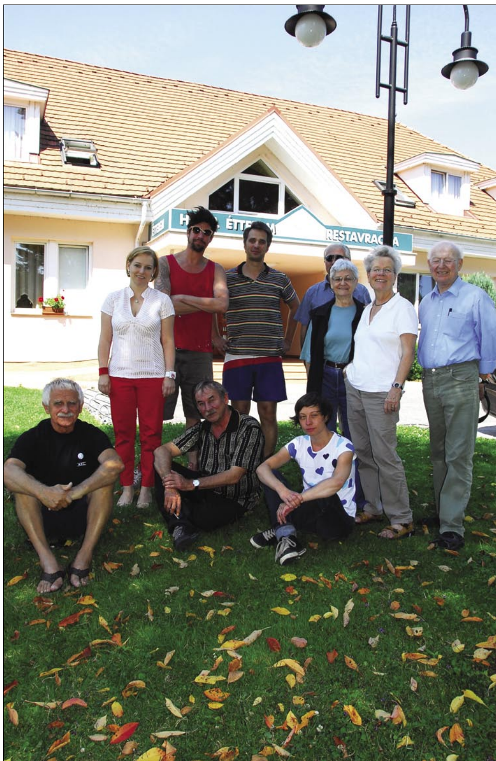
Umetniki in gostitelji na dvorišču Slovenskega doma v Monoštru

Glede zbirke bi bilo zelo dobro, če bi se kolonije udeleževali tudi predstavniki drugih umetniških panog, recimo kiparji, toda trajanje kolonije ne dopušča, da bi se v času kolonije rodile umetnine v teh panogah.