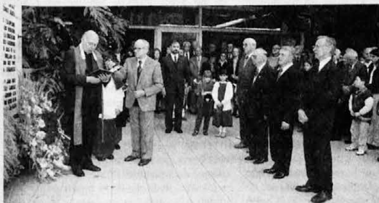
Ob položitvi venca in molitvah pred spomenikom naših padlih, 4. junija 2000

Kot svoj prvi javni nastop kot predse- dnik je dr. Bajuk govoril na proslavi v Rašici ob 450-letnici slovenske knjige, Trubarjevu mu Katekizmu in Abecedniku.