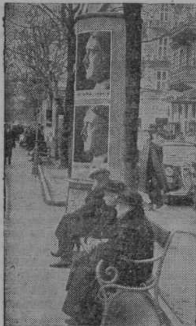
Dunaj se pripravlja na plebiscit 10. aprila. Na sliki vidimo Hitlerjeve lepake.

končno rekel, da so fantovski odseki samo vzgojna šola za politično JRZ. Njegov sopotnik pa mu je nato odgovoril, da ako on smatra, da so fantovski odseki šola za JRZ, so veliko bolj lažnacionalna društva šola za JNSarje. Odkod sta bila navedena mladeniča, se ni moglo ugotoviti, zdi se pa, da je bil dični mladenič z dvema znakoma iz nacionalnih Braslovč. Zopet je to nov dokaz nestrpnosti naših nasprotnikov.