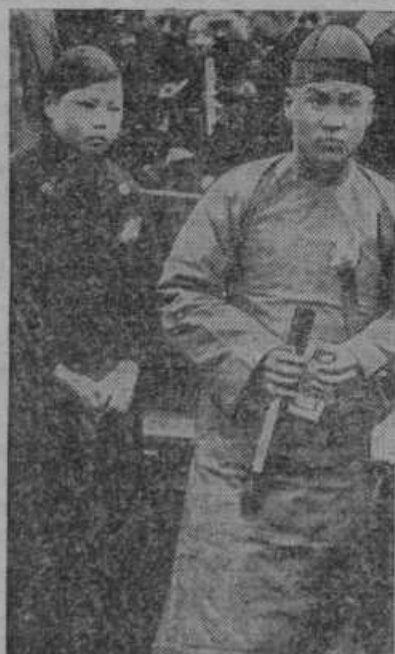
V kitajskem begunskem taborišču v šangaju sklepajo zakonske zveze v množinah. Na sliki vidimo kitajski zakonski par.

Celje. Dne 8. marca sta se peljala med drugimi z jutranjim savinjanom proti Celju dva mladeniča, ki sta imela oba pripete znake na sukničih, in sicer je imel prvi kar dva znaka, drugi pa je imel novi znak fantovskega odseka. Sedela sta molče drug drugemu nasproti. Ta molk je prekinil prvi, in sicer mladenič z dvema znakoma ter vprašal svojega sopotnika, kakšen je ta znak, ki ga nosi na sukniču. Slednji mu je nato mirno pojasnil, da je to novi znak članov fantovskega odseka. »Nacionalista« pa je ta mirni odgovor razkačil ter je začel na vse pretege udrihati po prosvetnem društvu in fantovskih odsekih, označujoč jih za klerikalce, jeruzalemece itd. To besedičenje dičnega nacionalista pa je tudi mirnega fanta razburilo ter je svojemu sopotniku odgovoril, da naj se ne zanima za njegov znak, kakor se on ne zanima za znake svojega sopotnika, čeravno jih ima pripetih celo vrsto na sukniču. Rekel mu je tudi, da si nikakor ne pusti blatiti vseobsegajočega prosvetnega društva in fantovskega odseka, saj bi v tem primeru tudi on lahko navedel razne stvari, ki bi ne bile v čast članom viteških organizacij. Nacionalistu pa še sedaj ni bilo dovolj tega odgovora, razburjal se je še nadalje in se zgražal nad nošenjem znakov prosvetnega društva in