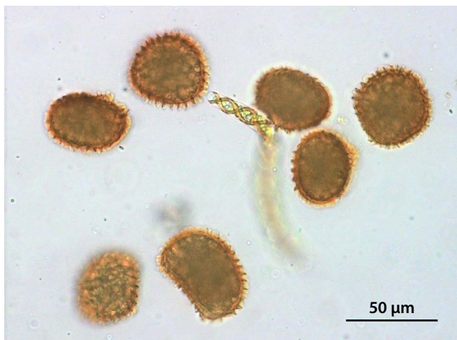
Slika 3: Spore in elatere vrste Fossombronion wondraczekii . Fotografirane pod mikroskopom.

Sklepamo, da je vrsta v Sloveniji pogostejša, kot je trenutno znano, vendar je zaradi njene majhnosti in slabe raziskanosti mahovne flore tovrstnih habitatov ostala spregledana.