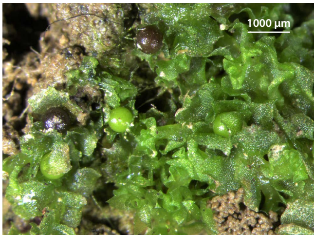
Slika 1: Steljka vrste Fossombronina wondraczekii z zorečimi sporofiti. Fotografirano pod lupo.

Vrsta F. wondraczekii je na Posodobljenem Rdečem seznamu mahov Slovenije (MARTINČIČ 2016) obravnavana kot premalo znana vrsta, za katero obstajajo le stari podatki (DD-va). Vrsta je splošno razširjena v Evropi in uspeva v vseh sosednjih državah Slovenije. V Italiji je uvrščena v kategorijo CR (skrajno ogrožena vrsta), v Avstriji ima status VU (ranljiva vrsta) in na Madžarskem DD (premalo znana vrsta). Na Hrvaškem pa vrsta ni uvrščena v nobeno izmed kategorij Rdečega seznama (HODGETTS & LOCKHART 2020).