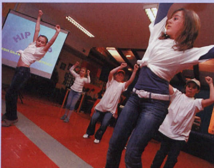
Utrinek z dobrodelnega koncerta na OŠ Pirniče