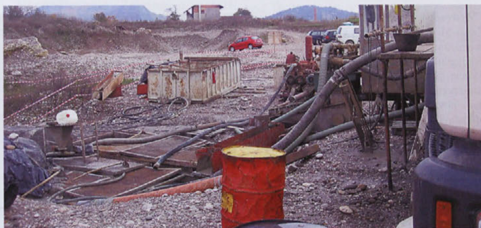
V prvi poskusni vrtini so prišli do globine 353 metrov, nato pa vrtnanje zaradi napake na stroju prekinili.