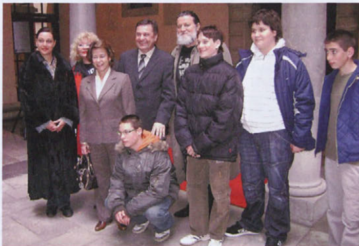
Učenci VIZ Frana Milčinskega Smlednik z mentorjema, ljubljanskim županom in veleposlanico Portugalske.

”Moja dežela, mesto, kjer živim”, je naslov skupne likovne razstave VIZ Frana Milčinskega Smlednik in Centra za umetnost Teoartis iz Evore na Portugalskem. Do konca marca bo na ogled v Mestni hiši v Ljubljani.