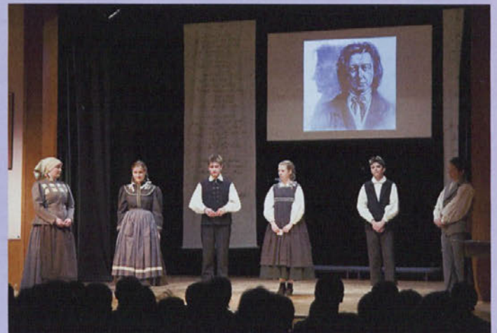
Svojo prireditev so organizirali v Sori. Predstavile so se skupine, ki delujejo v okviru KUD Oton Župančič Sora.