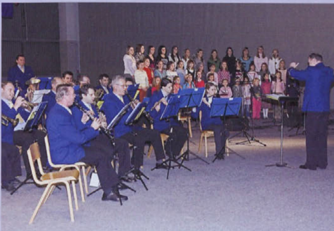
Na osrednji občinski proslavi ob kulturnem prazniku so nastopili Godba Medvode, Lovski pevski zbor Medvode in združen zborček osnovnošolcev.