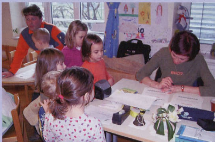
Delavnice za bodoče prvošolce na OŠ Preska