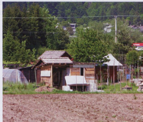
Vrtičke ob železniški progi KS Preska z aprilom vrača občini Medvode.

seje. Problem se nanaša na več vprašanj. Eno je lastništvo zemljišča, na katerem so vrtički. Bilo je občinsko in v postopku denacionalizacije prehaja v lastništvo denacionalizacij-