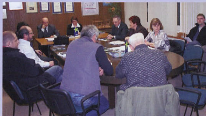
OO LDS Medvode je pripravil okroglo mizo na temo turizma v Medvodah, ki je bila dobro obiskana.