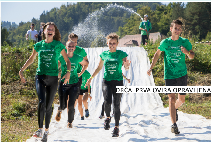
DRČA: PRVA OVIRA OPRAVLJENA