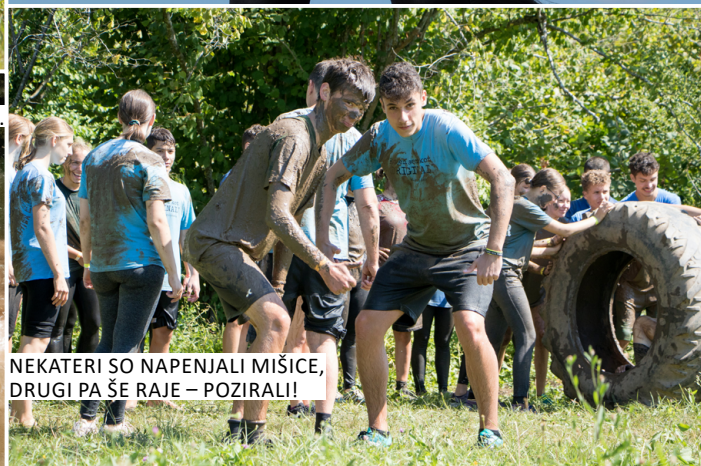
NEKATERI SO NAPENJALI MIŠICE, DRUGI PA ŠE RAJE – POZIRALI!