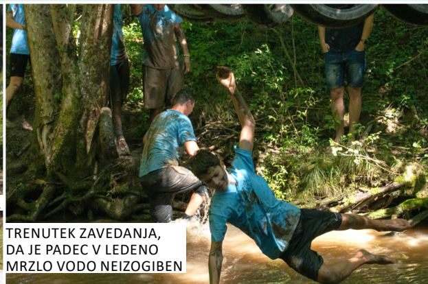
TRENUTEK ZAVEDANJA, DA JE PADEC V LEDENO MRZLO VODO NEIZOGIBEN