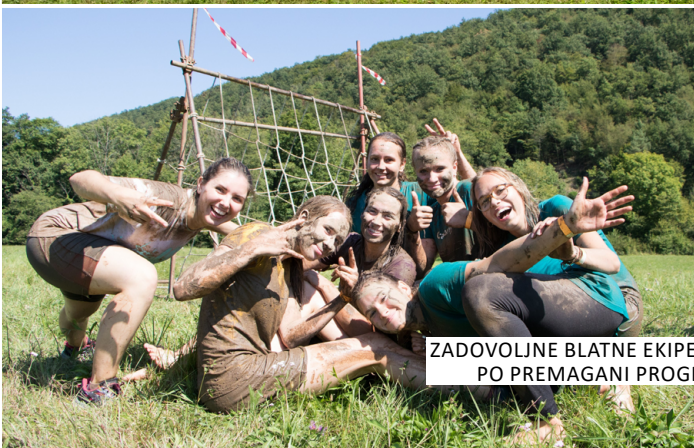
ZADOVOLJNE BLATNE EKIBE PO PREMAGANI PROGI