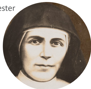
SV. MARIJA DOMINIKA MAZZARELLO