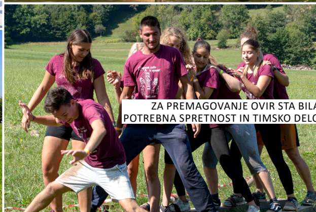
ZA PREMAGOVANJE OVIR STA BILA POTREBNA SPRETNOST IN TIMSKO DELO