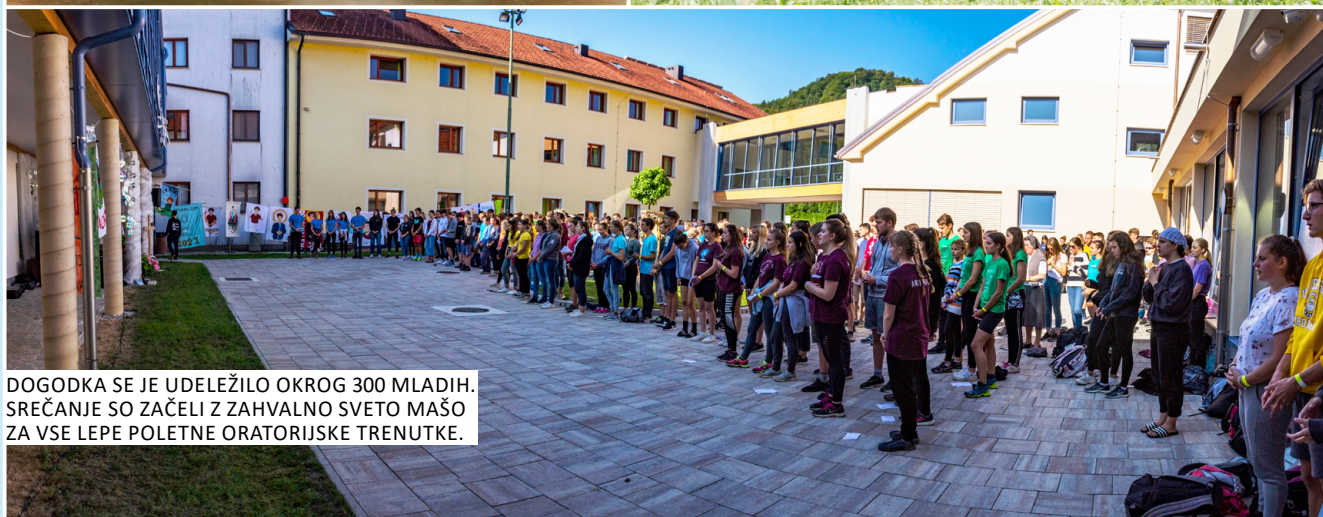
DOGODKA SE JE UDELEŽILO OKROG 300 MLADIH. SREČANJE SO ZAČELI Z ZAHVALNO SVETO MAŠO ZA VSE LEPE POLETNE ORATORIJSKE TRENUTKE.