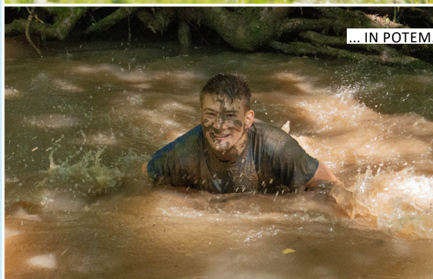
... IN POTEM.