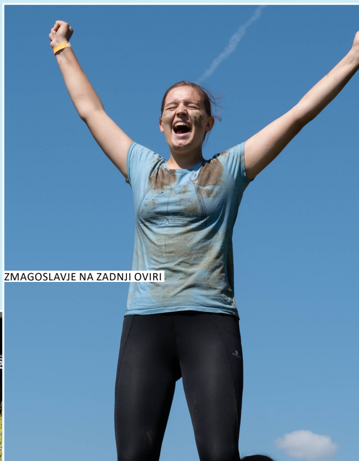
ZMAGOSLAVJE NA ZADNJI OVIRI