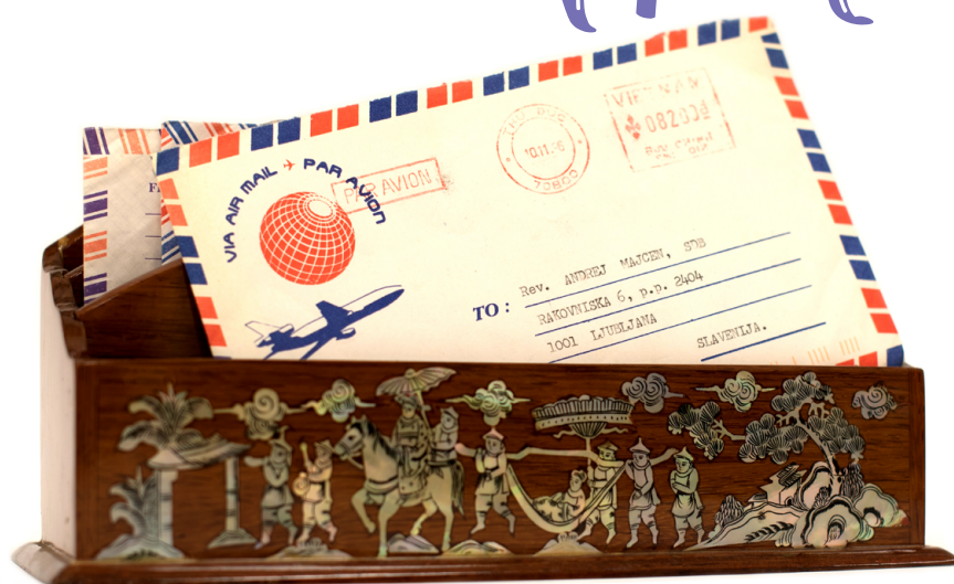
ANDREJEVA PISMA