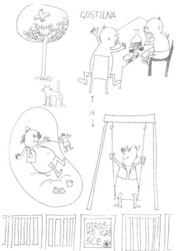
Tako si naš karikaturist zamišlja integracijo gostinskega vrta in otroškega igrišča v Guncljah