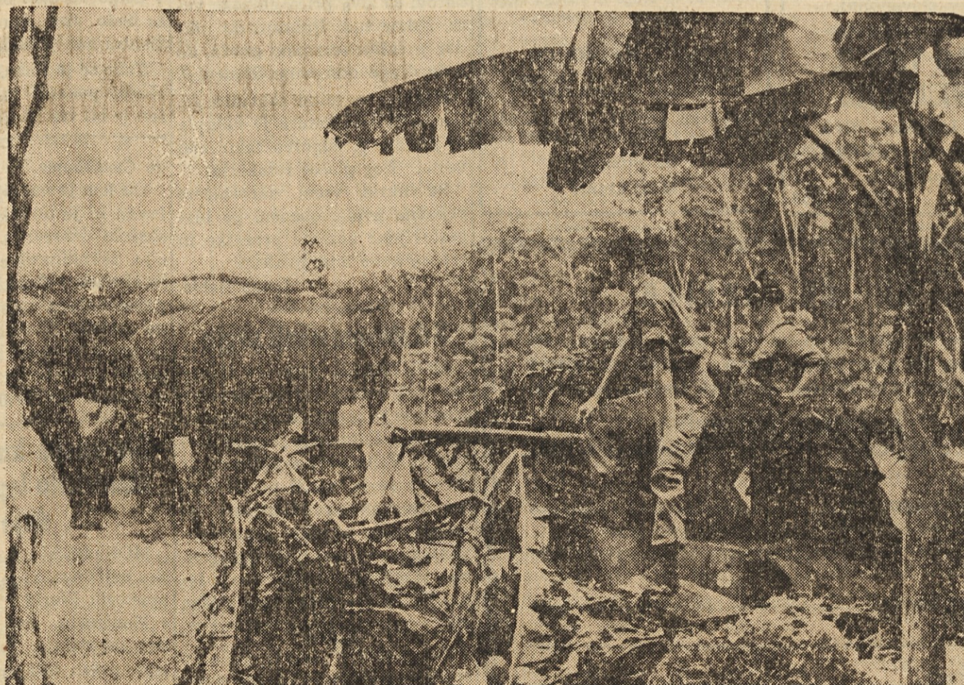
NENAPOVEDANI GOSTJE — Skupina angleških vojakov v tanku na patroli skozi malašjsko džunglo se je nenadno znašla pred skupino slonov, ki se niso dali prav nič motiti. Sloni v Malaši so zaščiteni in se na splošno ljudi ne boje.