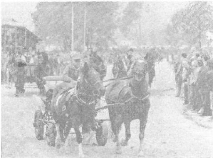
Konjereja je zaživela v pravem pomenu besede, kar potrjuje tudi uspeha konjerejske prireditve, ki so jo 2. oktobra pripravili člani Konjerejskega kluba Tomisej.