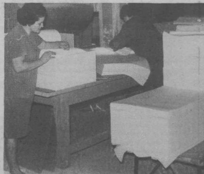
Na prvi pogled preprosto in lahko delo, pa vendar zahteva poleg rutine tudi visoko koncentracijo, tesno povezano s skrbmi, ki jih delavec le navidezno pusti zunaj tovarne

Da bi prišli do realnejše ocene stanja, predvsem pa ocene poslovanja do konca leta, je izvršni svet skupščine občine organiziral razprave v odboru za gospodarstvo ter s predstavniki TOZD in delovnih organizacij analiziral stanje v tistih primerih, kjer so poslovni rezultati relativno slabši. Iz razgovorov ugotavljamo, da so v zvezi z uveljavljanjem zakona o zagotovitvi plačil TOZD premalo izkoristile možnosti širše uporabe instrumentov za zagotovitev plačil, oziroma da je bila možnost 15—dnevnega gotovinskega plačila preveč uporabljena ter je tako zaradi same tehnike obračunavanja prišlo do velikega izpada realizacije. Zato bodo morale delovne organizacije analizirati tehniko plačevanja na osnovi zakona o zagotovitvi plačil ter jo izpolniti tako, da v večji meri eliminirajo navidezno nepriznavanje ustvarjenega dohodka. Ugotavljamo tudi, da se je večina delovnih organizacij že lotila analiziranja vzrokov in sprejemanja ukrepov, ki naj zagotove izboljšanje poslovanja v drugem polletju. Zato pričakujemo, da bo ob doslednem izvajanju sprejetih ukrepov večina delovnih organizacij zaključila letošnje poslovno leto pozitivno, ne moremo pa pričakovati tiste stopnje gospodarske rasti, kot smo jo načrtovali. Računamo pa, da bodo zakonski predpisi, ki smo jih začeli izvajati v letošnjem letu, ter uveljavitev zakona o združenem delu le prinesli v naslednjih letih pozitivne učinke v celotnem gospodarskem in družbenem življenju.