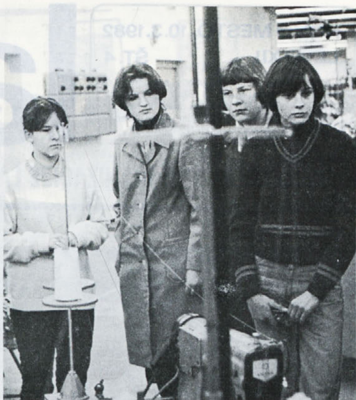
Prve skupine dijakov usmerjenega izobraževanja so že končale proizvodno delo. Na posnetku – skupina deklet ob srečanju s proizvodnjo TOZD Ločna, kjer so opravljale 80 urno delo.

Področje SLO je tako zahtevno in široko, da zahteva redno in dosledno delo, hkrati pa je tudi tako zahtevno, da je pomoč strokovnega sodelavca potrebna in nujna. V TOZD Zala upajo, da bo z letošnjim letom tudi temu kolektivnemu namenjenih toliko ur sodelovanja in pomoči, da bodo uspeli popraviti zamujeno, kar bo gotovo tudi porok za dobre rezultate na tem področju tudi v bodoče.