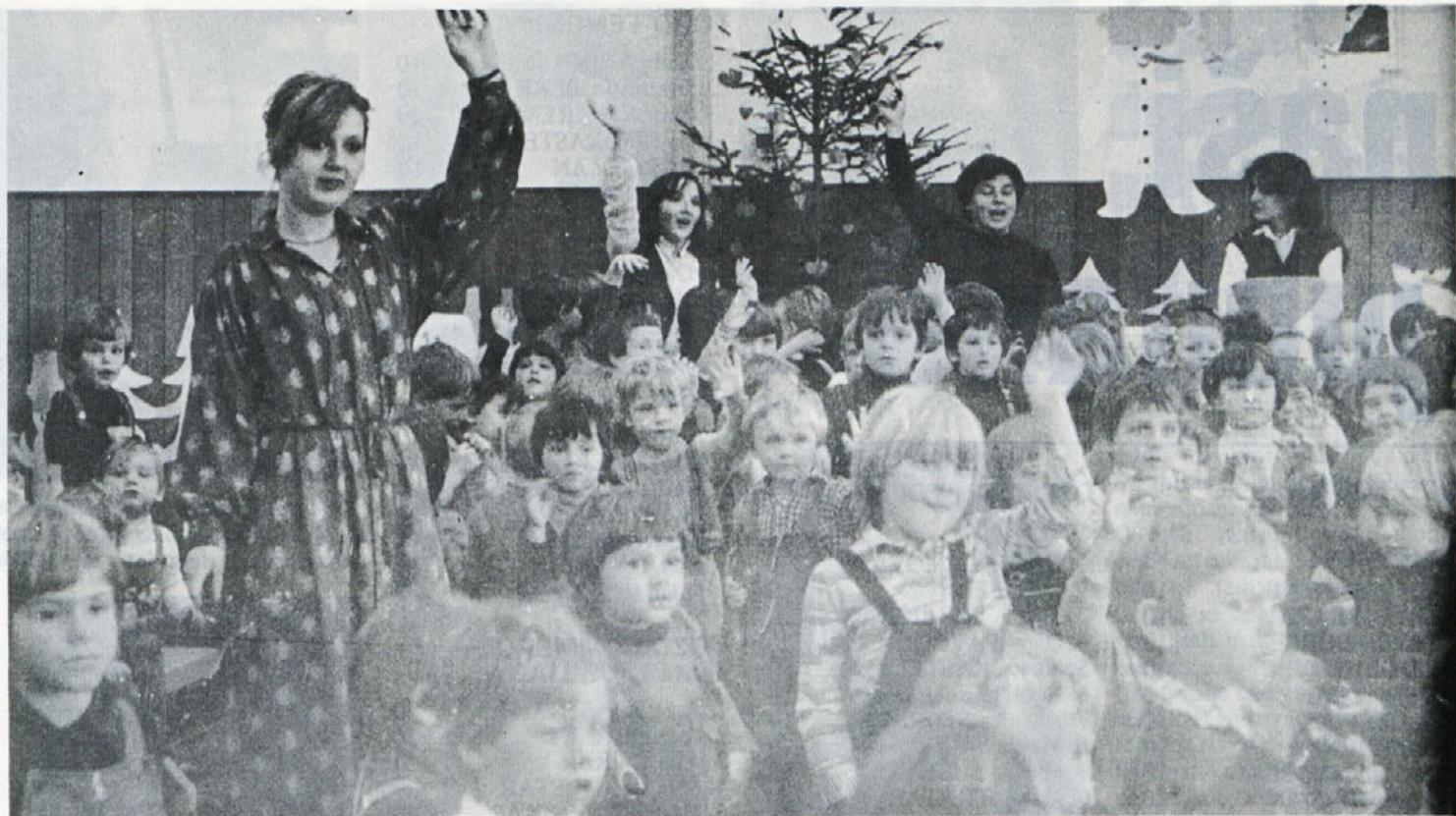
Pozdrav mamicam za praznik