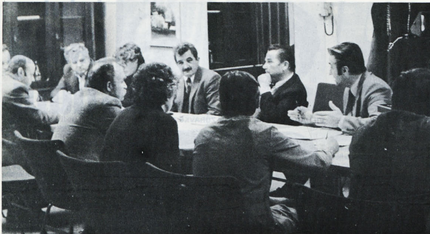
Iz posveta načelnikov narodne zaščite.