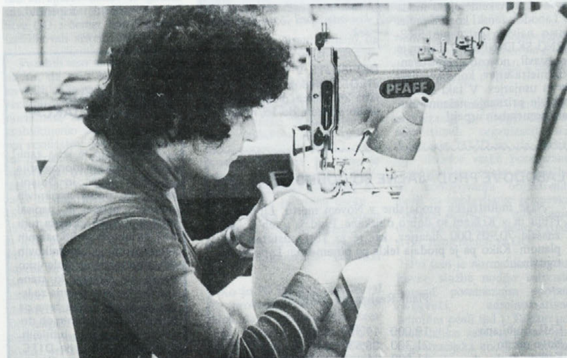
Delovni motiv iz Zale