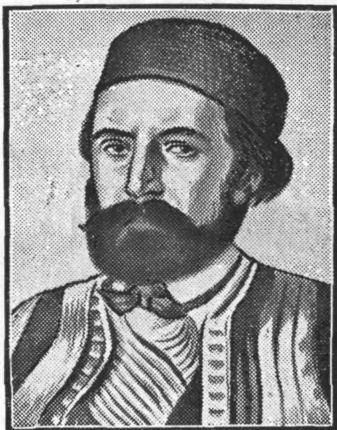
Petar II. Petrović Njegoš

so sedaj vladiko slušali, sedaj ne, in ki je potrebovala, da se izpremeni v pravo državo, njihov cerkveni starešina pa v pravega vladarja. Pred vsem je ukinił »governatorstvo« (upraviteljstvo), ki je ostalo — čeprav samo po imenu — od onega časa, ko so se proti koncu XVII. stoletja združili z Benečani, a »governatorja« (upravitelja) Vuka Radonjića prežene iz Črne gore. Tako se osvobodi tekmeča, ki bi mu bil na poti v njegovi posvetni vlasti. Leta 1831. je mladi Rade postal menih v Peči, kjer ga je posvetil ondotni patrijarh kot arhimandrita cetinjskega samostana, pri čemer se je dosedanji Radivoj — na čast pokojnemu vladiki — prozval za Petra. On je sedaj napravil prvi