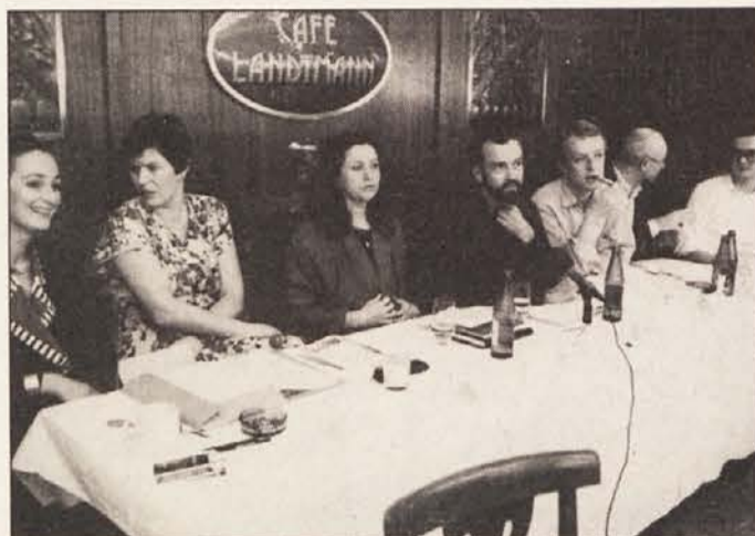
Pobudniki leta manjšin na tiskovni konferenci na Dunaju