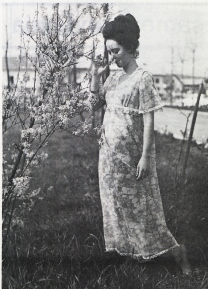
Domača dekleta so se v preteklosti izkazale kot zelo dobre manekenke. Težava je le v tem, ker jih je težko prepričati, da se odločijo za to dodatno delo, ki nikakor ni lahko.

Največ vroče krvi v podjetju je takrat, ko se spreminjajo osebni dohodki in ko se delijo stanovanja in krediti. Vsak hoče biti prvi in če ni, se je „samo njemu“ zgodila krivica. Kolikor posameznikov – toliko različnih želja, problemov in variant.