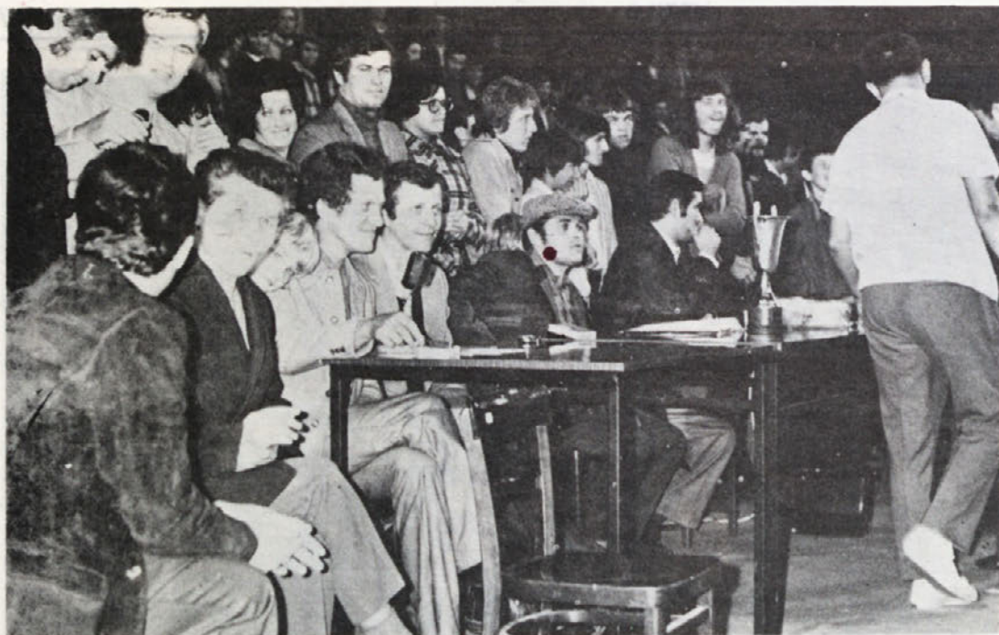
Za košarkarske tekme je v Metliki zmeraj veliko zanimanja. Včasih pa je gledalcu mučno, ko sliši pri navijačih zares neumestne in vulgarne izraze. Upajmo, da bo v jesenskem delu tekmovanja tudi tega manj.