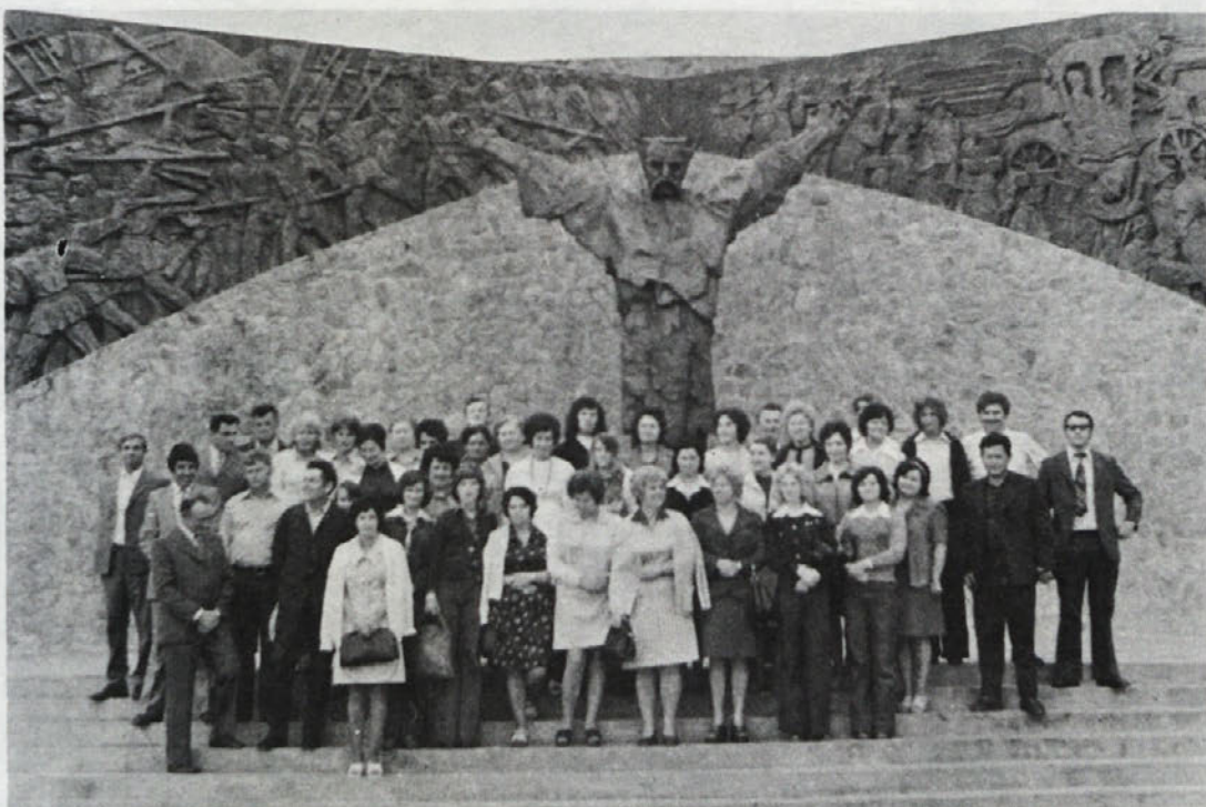
Na poti v Kumrovec, kjer smo si ogledali spominski dom borcev in mladine, smo se člani sindikata skupnih služb ustavili tudi ob spomeniku Matiji Gubcu. Izlet je bil dobro organiziran. Ogledali smo si veliko kulturnih in naravnih lepot domovine.