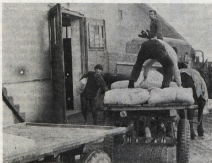
Nemalo članov kolektiva BETI je med letošnjim dopustom gradilo ali obnavljalo hiše in spet so doživeli, kot že mnogi pred njimi: v poletnem času včasih zmanjka cementa. Kadar pride pošiljka (kot na sliki), jo kupci takoj odpeljejo.