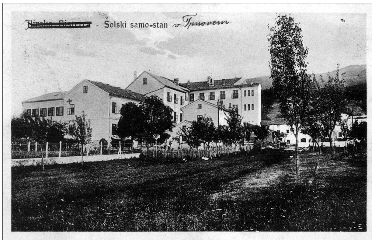
Samostan leta 1915 (razglednica, hrani Knjižnica Makse Samsa, Ilirska Bistrica).

same. Občina Bistrica je za izdajo dovoljenja hotela le potrdilo, da naj ne bi trnovske sestre hodile prosjačit po hišah. Po pridobitvi dovoljenj je 21. novembra 1888 sledilo slavnostno odprtje nove samostanske dekliške šole.