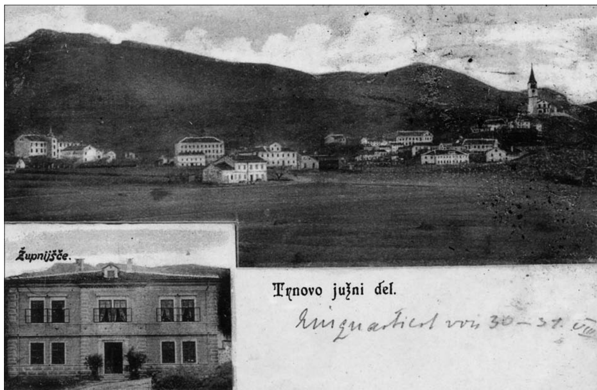
Trnovo (razglednica, hrani Knjižnica Makse Samsa, Ilirska Bistrica).