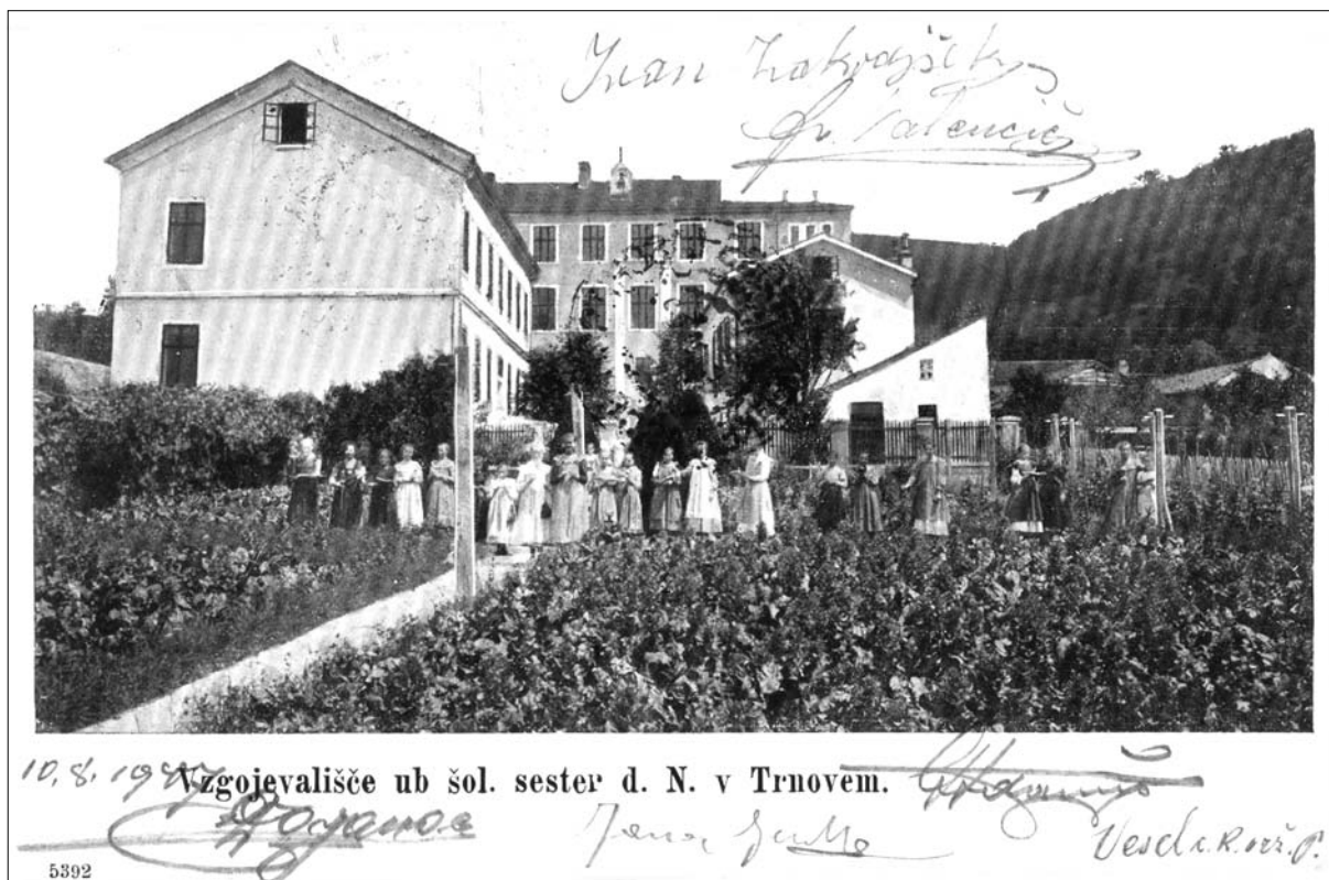
Učence samostanske šole na vrtu (razglednica, hrani Knjižnica Makse Samsa, Ilirska Bistrica).

učenek močno upadlo, predvsem število gojenk. Te so bile namreč prej nameščene v internatu, ki je sedaj služil za potrebe vojaške bolnišnice. Tudi razredov za poučevanje je tega leta primanjkovalo; nadomestne prostore so poiskali v deški ljudski šoli in v župnišču. Upad je bil kratkotrajen, že naslednje šolsko leto se je število zopet povzpelo na tristo učenk. Najmanj sprememb je doživljala ponavljalna šola, kjer se število učenk, tudi v letu začetka vojne, ni dosti spreminjalo, vedno je ostalo okrog 40. 122