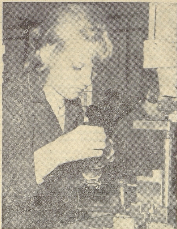
V obratu tovarne elektromotorjev Železniki v Idriji od avgusta sem teče montaža črpalk za pralne stroje, motorjev za gramofone in kavne mlinčke. Po priučevanju v matični tovarni mlade delavke delajo z vedno večjo spretnostjo. Na sliki: navijanje rotorja

Osebnih dohodki so porasli za okoli 11% glede na preteklo leto, kar pomeni, da smo se gibali nekako v mejah, ki jih je družba predpisala za tekoče obdobje. Obenem so ti osebni dohodki ustrezali tudi poslovnim rezultatom in si tudi ob sproščenih osebnih dohodkih ne bi privoščili kaj več. Povprečni mesečni osebni dohodki v preteklem letu so bili 1.431,00 din na zaposlenega, letos pa okoli 1.594,00 din. Zadnje analize kažejo, da se (Nadaljevanje na 6. str.)