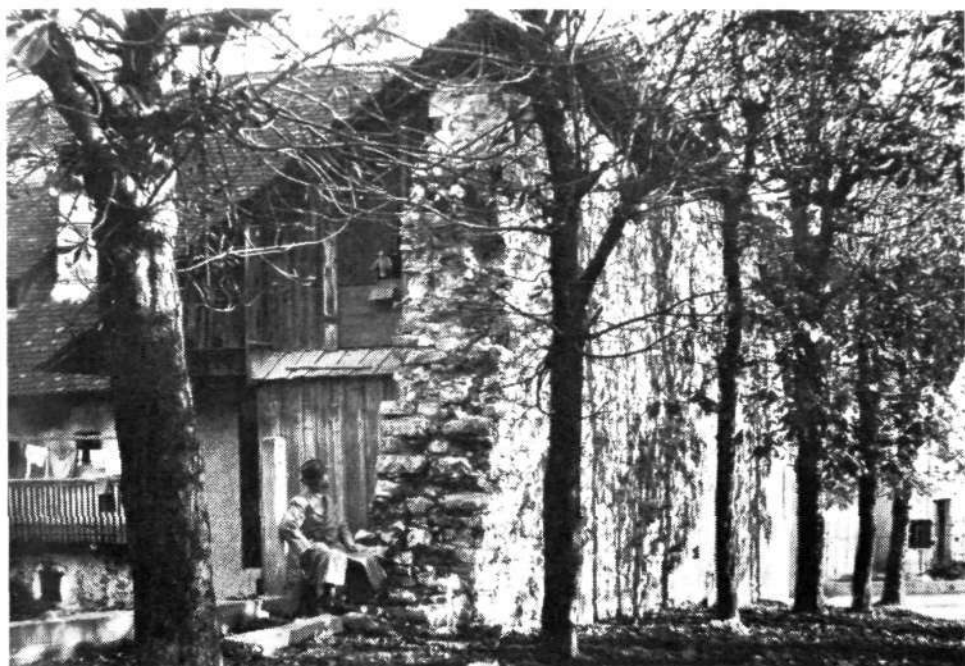
Del mestnega obzidja ob Perkusovi hiši okrog leta 1935. Na levi dvoriščna stran hiše z »gankom« in hlevom.