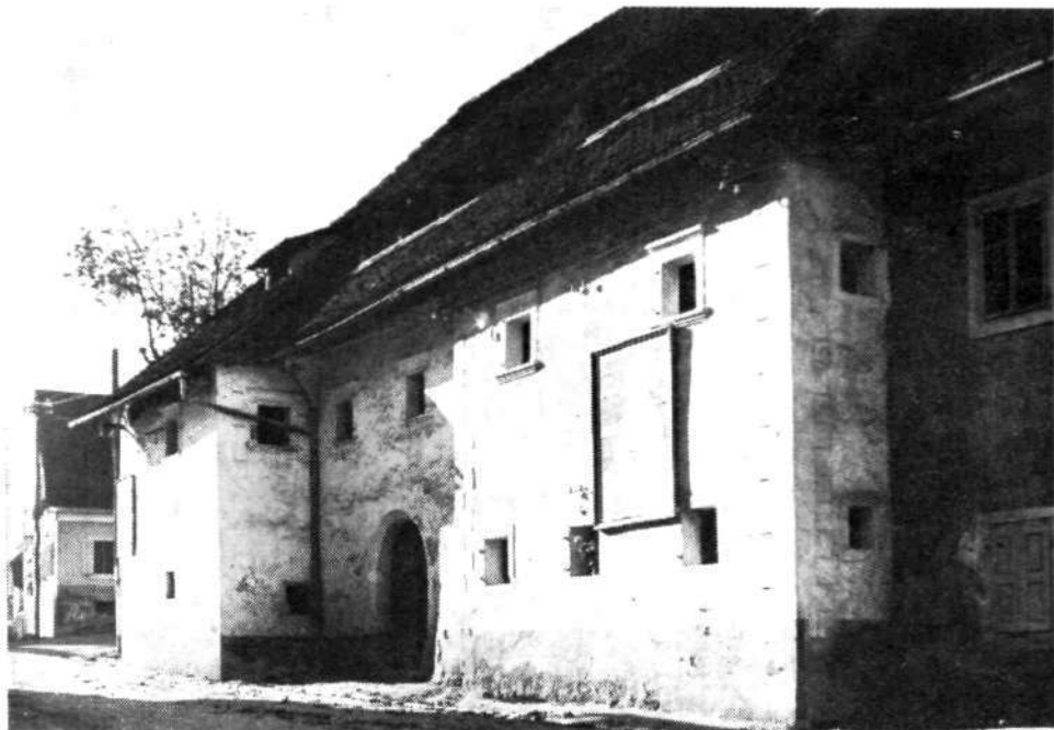
Perkusova hiša okrog leta 1935, pogled z lontrške strani.

proti Okornu. V »hiši« je levo do vrat stala krušna peč. Vštric peči so bila vrata v črno kuhinjo, malo naprej vrata v kamro. Kuhinja in kamra sta imeli po eno okno na dvorišče. V kamričnem okenskem okviru je bil z dvorišča viden kamen z vklesano letnico nekaj nad 1700. Enaka razdelitev prostorov je bila v nadstropju. Prostora nad kletjo niso uporabljali. Sicer pa je v nadstropju stanoval Lovrinčk, ki je predelaval rogove v plošče, da so jih potem glavnikarji dalje izdelovali v glavnike. Na dvoriščni strani je bil v nadstropju »gank«, ven pomaknjeni del hiše pa se je nadaljeval v hlev, zidan in z lesenim enokapnim ostrešjem. Za hlevom je bilo preprosto leseno stranišče v pritličju in v nadstropju. Hlev so mesarji uporabljali za prašiče ali teleta, preden so prišli na vrsto za zakol. 3