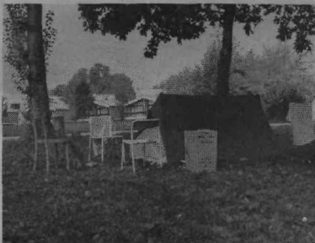
Avtocamp na Šternu je še odprt, čeprav je gostov iz dneva v dan manj. Zadnji turistični nomadi pa še vztrajajo...

Večino stanovanj naj bi v tem srednjeročnem obdobju zraslo v občini Moste-Polje - 4.155, na drugem mestu pa je Bežigrad. V tem obdobju bomo na našem območju postavili 3.310 novih stanovanj. Na Viču načrtujejo 2.803 novih stanovanj, v Šiški 2.739, v Centru pa le 1.339.