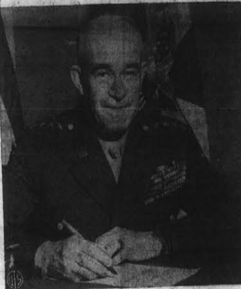
Novi vrhovni poveljnik ameriške armade. — Gen. Omar N. Bradley, ki nam ga kaže gornja slika v njegovem uradu v Pentagonu, je nasledil gen. Dwight D. Eisenhowerja, ki je postal predsednik Columbia univerze.

MILES LABORATORIES, INC., Elkhart, Indiana