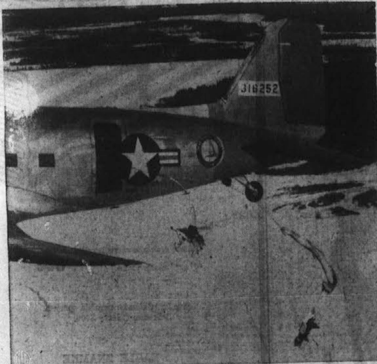
Nov način reševanja. — Slika nam kaže dva psa, ki sta odskočila iz letala s padali, da nudita prvo pomoč ponesrečenim letalcem v kraju, kjer niti helikopter letalo ne more pristati. Ta način reševanja je vpeljala "Atlantic Division of the Air Transport Command" posebno za kraje, kjer radi godov ali drugih naravnih zaprek tudi helikopter letalo, ki se lahko spusti navpično na zemljo, zgubi svjo veljavo.