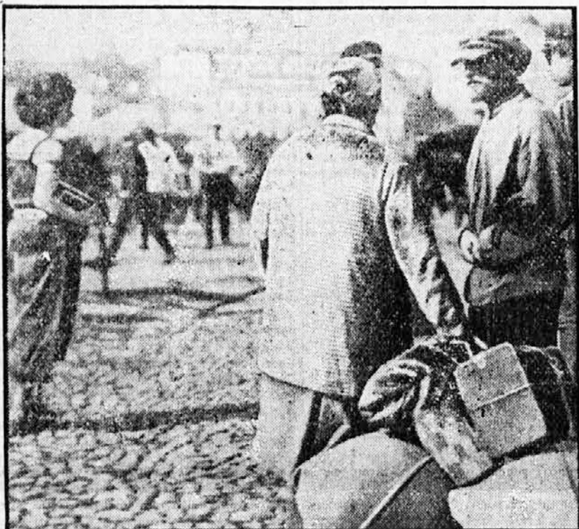
Sodobna ženska moda v komunistični Ruslji

In v znamenju teh spominov se začena četrta rdeča »republika«.