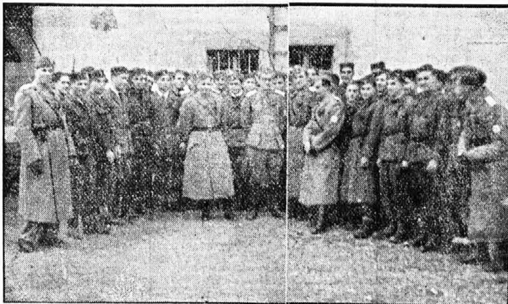
Domobranska družina na Dobrovi ob prvi obletnici oboroženega boja proti komunizmu

Vse te preizkušnje od ustanovitve, kleni boji s komunisti, Badoglijeva izdaja, trpljenje, napori, vse to je njihovega borbenega duha še bolj dvignilo. Postali so za-