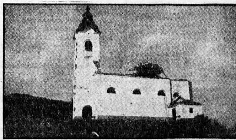
Cerkev v Hruševem, požgana po komunistih 12. marca 1943.