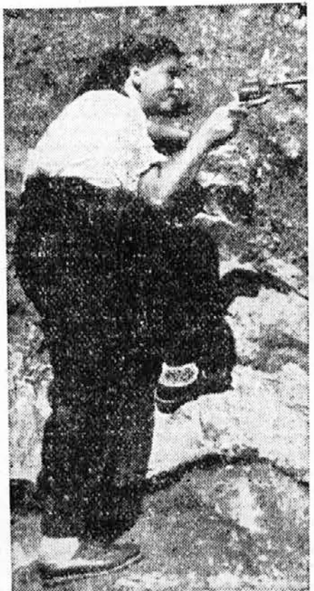
»Moderno« oblečena slovenska komunistka v gozdu

Tako je neka ljubljanska emancipiranka na vprašanje, zakaj je prišla, odgovorila: »Zato, da bom postala komisarka.« To se je