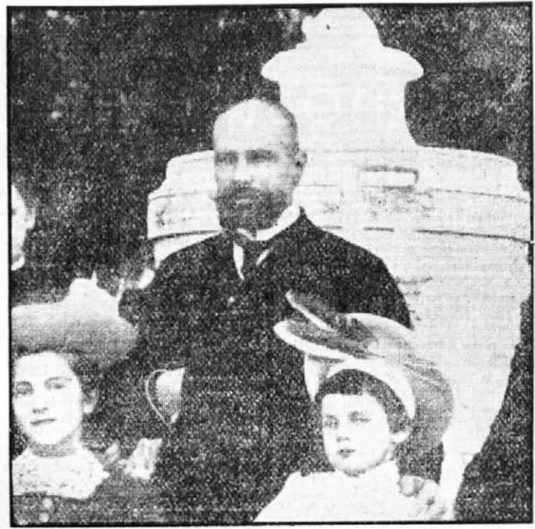
Ministrski predsed. Stolp in tik po atentatu