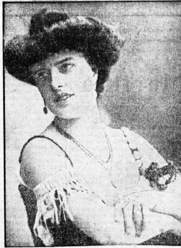
Neddy de Hero