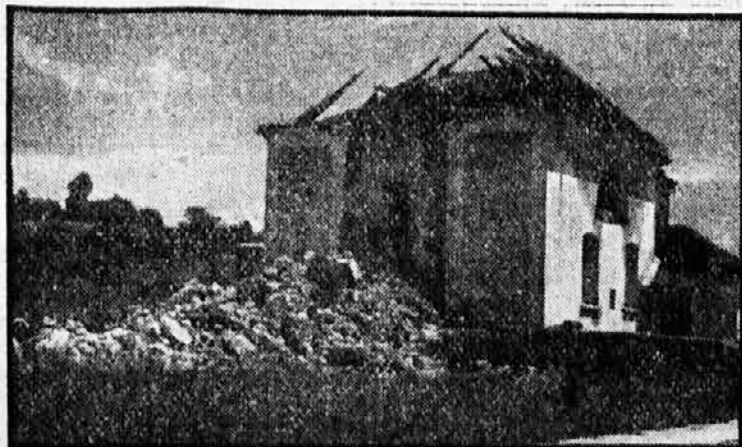
Cerkev v Gaberju, porušena po komunistih 12. marca 1943.

Pa naj kdo reče, da jih ne prekašamo, stare farizeje. Če bi nas hotel kdo ozdraviti, da bi prav gledali in presojali, bi nam moral najprej izdreti bruno iz očesa... Zlepa — ali zgrda.