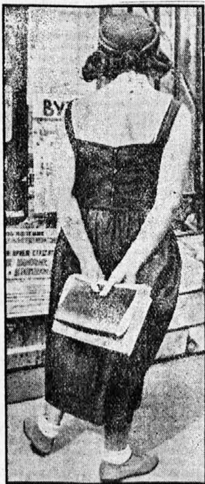
Moderno oblečena komunistična študentka v Ruslji. Salonskega komunizma pri nas bi bilo nemara brž konec, če bi KPS svojim vernicem zapovedala takale oblačila, kakor jih morajo nositi njihove vrstnice v »najnaprednejši državi sveta«.

Največ žensk je prišlo v gozd iz romantičnih in pustolovskih nagibov. Večina ljubljanske mladine je bila okužena po raznih skupnih taborjenjih in smučanjih, ki so jih levičarji prej posebno vneto zagovarjali in prirejali. Zdad so se tem ljudem v romantičnem gozdnem življenju obetala vsakovrstna »doživlja« in to uradno.