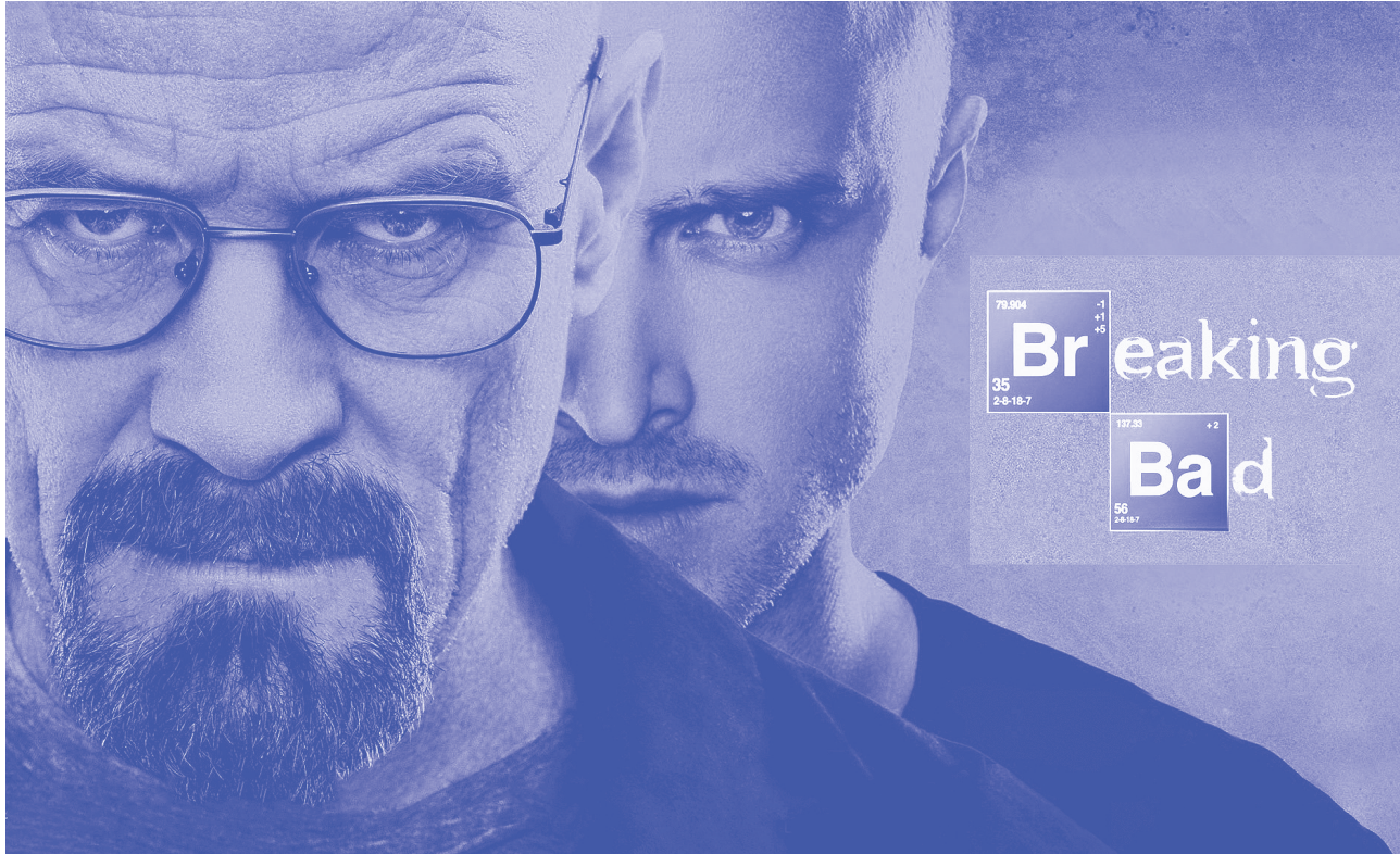
KRIVA POTA (2008 - 2013), AMC/NETFLIX