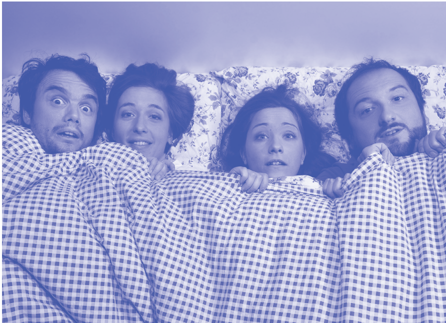
V DVOJJE (2015 - 2019), VOYO