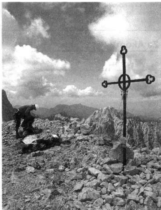
Novo znamenje na gori: križ na Brani

Žal se nekatere napake preteklosti ponavljajo. Križi, pa naj bodo navadni ali kljukasti, srpi in kladiva in podobna ideološka oziroma verska znamenja ne sodijo na