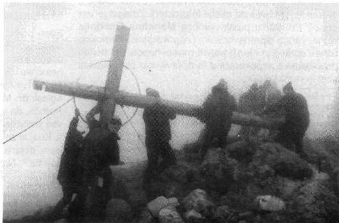
V meglenem vremenu je pešiča gornikov na vrhu Škrlatice postavila in utrdila križ