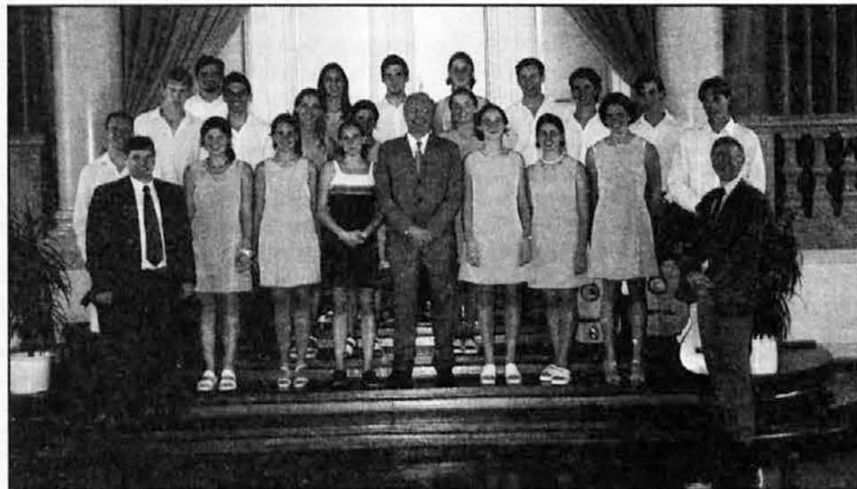
RAST XXIX na obisku pri predsedniku slovenske vlade dr. Andreju Bajuku