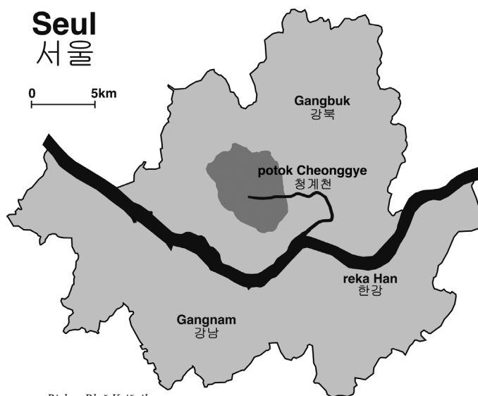
Slika 1: Položaj potoka Cheonggye v Seulu. Temneje je označeno območje starodavnega Seula, imenovanega Hanyang.

potoka nista pomembneje spreminjala. Cheonggyecheon je mesto delil geografsko in družbeno. Severno od potoka so bile kraljeve palače, svetišča ter bivališča visokih uradnikov in kraljevih vojakov, vzdolž ceste Jong-ro so bivali trgovci in obrtniki, medtem ko so južno živeli nižji uradniki, običajna vojska in nižji razred (Lee 2003). Zaradi velikega števila ob potoku živečega prebivalstva, še bolj pa zaradi pogostih poplav je bil potok skozi zgodovino predmet številnih ureditev, ki so močno vplivale na videz mesta. Današnje ime, ki v korejščini pomeni »voda čiste doline«, je Cheonggyecheon dobil šele v začetku prejšnjega stoletja med japonsko okupacijo Koreje, ko je začelo območje vzdolž potoka družbeno in ekonomsko nazadovati. Predvsem ob spodnjem toku so se naseljevali revni prišleki s podeželja. Za prebivalce je potok predstavljal tako vsakodnevni življenjski prostor kot tudi kanal, ki je odvajal odplake. Ne glede na slabo ekološko stanje in dejstvo, da v času japonske okupacije zelo težko govorimo o svobodi združevanja, je Cheonggyecheon kot kraj srečevanja različnih družbenih skupin ohranil značaj skupnostnega prostora.