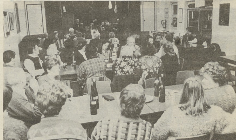
Utrinek s sobotnega martinovanja v Borštu

Praznik je dosegel svoj vrh večeraj, torej na dan sv. Martina, kot je v navadi. V nedeljo je bilo ljudi nekoliko manj (morda tudi za-