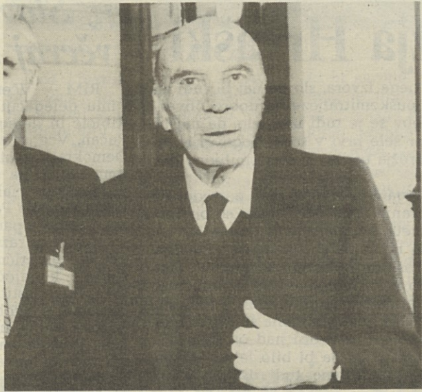
Minister Guido Carli