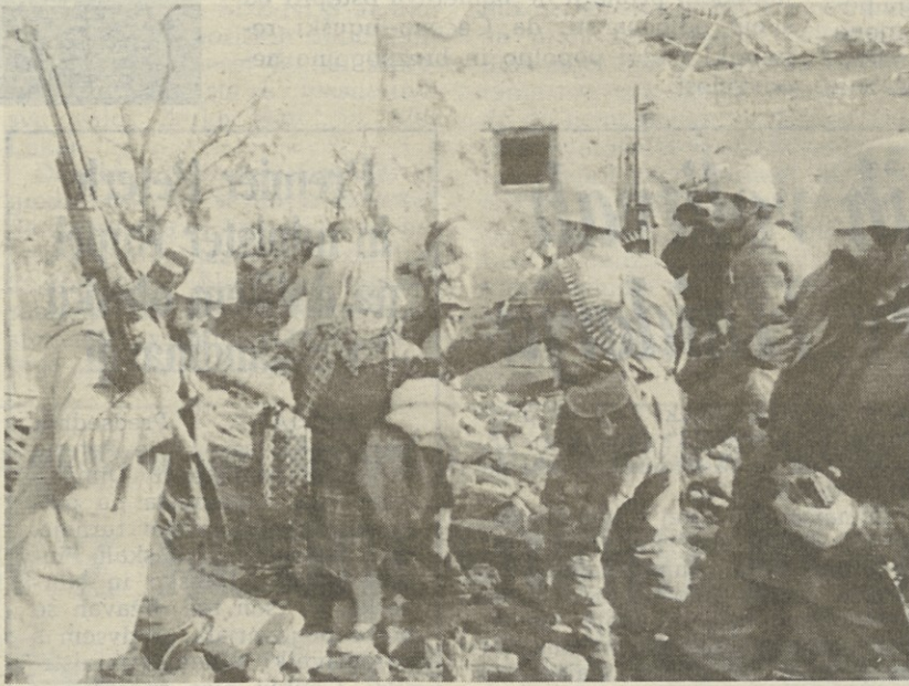
Vojaki jugoslovanske vojske med ruševinami naselja pri Vukovarju, ki so ga porušile njihove granate

Granate so padale tudi na Osijek, kjer sta izgubila življenje dva civilista, 14 pa jih je bilo ranjenih. Letala jugoslovanske vojske so NADALJEVANJE NA 2. STRANI