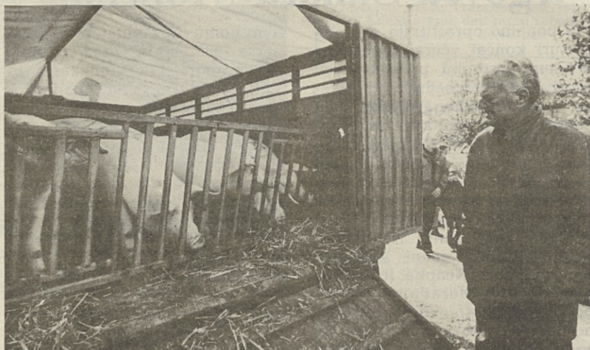
Na Proseku so tudi letos prodajali pujske