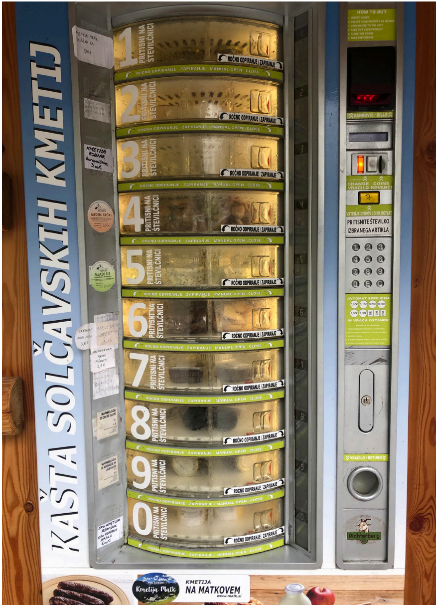
Fotografija 4: Kašta solčavskih kmetij z izdelki – vgrajena v stavbo Zadrúžnega doma. Pika Kristan, Solčava, 2020.