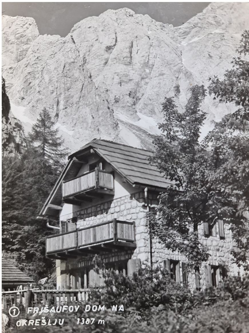
Fotografija 2: Koča na Okrešlju, dozidana v šestdesetih letih 20. stoletja.