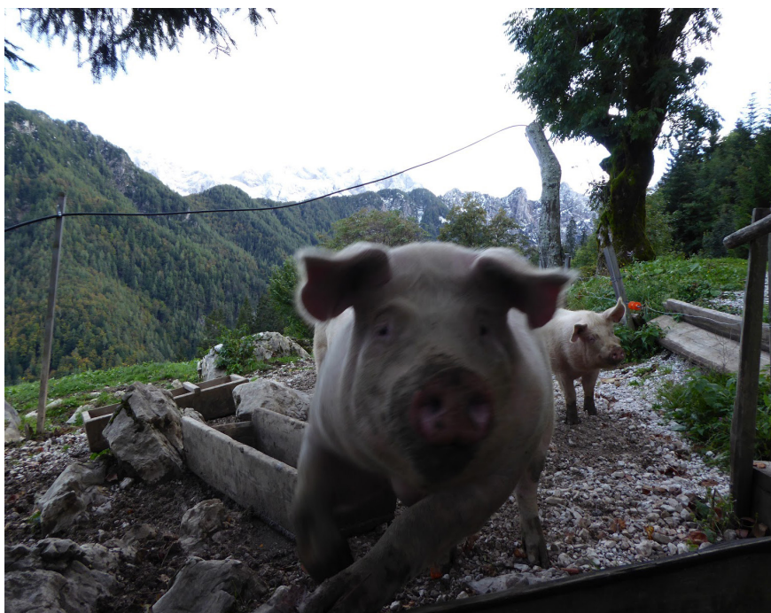
Fotografija 1: Skok čez plot. Simona Zupanc, Matkov kot, 2020.

»Vsak solčavski kmet ima svoje njive ograjene s plotom. Prav tako so plotovi tudi za meje med sosedi, da nadomeščajo pastirje. Če so v redu, ne more nikomur uhajati živina na njive, ne njegova, ne tuja. Vsako pomlad plotove popravijo in je mir za vse poletje.« 1