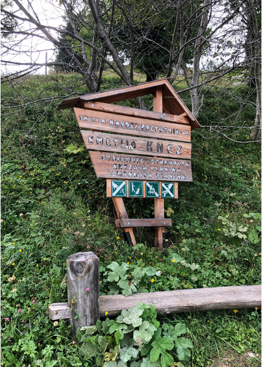
Fotografija 2: Lesena oznaka. Pika Kristan, Robanov kot, 2020.