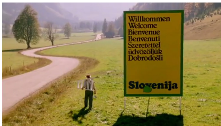
Fotografija 5: Znameniti pogled na Logarsko dolino v kampanji Slovenija, moja dežela (1985). YouTube.

ospredju in Ojstrico v ozadju. Toda ta podoba ne deluje (zgolj) znotraj nacionalnega, temveč tudi v internacionalnem, kozmopolitskem imaginariju in večutni naravnosti rekreacije na prostem (»outdoor«). 15 Percepcije Solčavskega so tako podvržene specifičnim estetskim kategorijam, ki jih hkrati tudi proizvajajo in ki se zrcalijo v številnih vidikih, orisanih v zgornjih odstavkih: od dediščine in zapuščine, do turizma in tržnih kampanj, gorništvu in festivalizacije.