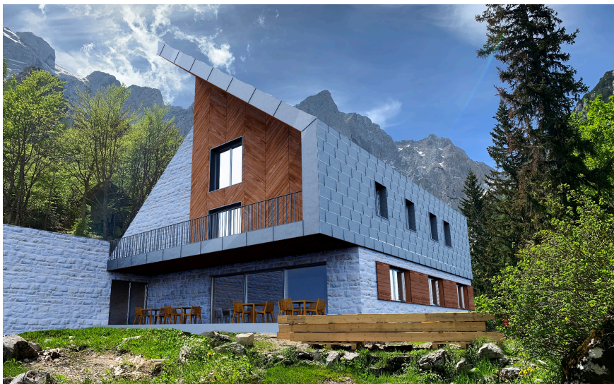
Fotografija 4: Vizualizacija zasnove novega doma. Rok Bordon, 2020.