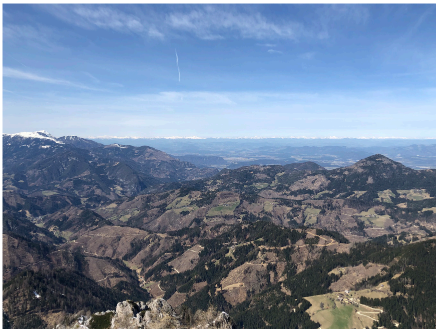
Fotografija 2: Pogled iz Olševe čez mejo na avstrijske »frate«. Elizabeta Vršnik, Solčava, 2021.

času je bilo prepovedano prehajanje državne meje in sem s sprehodom po Olševi kršila zakon, čeprav sem le prehajala neko nevidno mejo v gozdu.