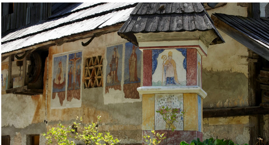
Fotografija 3: Kužno znamenje in bevski hlev s freskami v ozadju. Robanov kot, 2011.