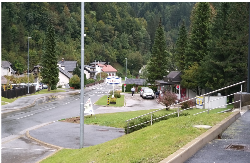
Fotografija 5: Pogled na znak za bencinsko črpalko pred trgovino v Solčavi. Tina Krašovic, Solčava, 2020.

Če za nekatere domačija predstavlja temeljno središče, pa se kot drugačen tip središč, ki prav tako usmerja vsakdan na Solčavskem (in se vzpostavlja tudi v odnosu do domovanja), kažejo kraji, ki bi jih lahko zavoljo upravnih, odločevalskih, storitvenih in drugih funkcij za prebivalce Solčavskega označili kot upravna in storitvena središča. Za prvo takšno središče lahko imamo vas Solčavo. Že leta 2007 je Boštjan Anko zapisal: »Način poselitve Solčavskega s celki (samotnimi gorskimi kmetijami) dobesedno zahteva neko jedro: duhovno, družabno, gospodarsko, socialno. To je Solčava od nekdaj bila: cerkev, šola, gostilna, trgovina, pošta, zbirno mesto ...«. 59