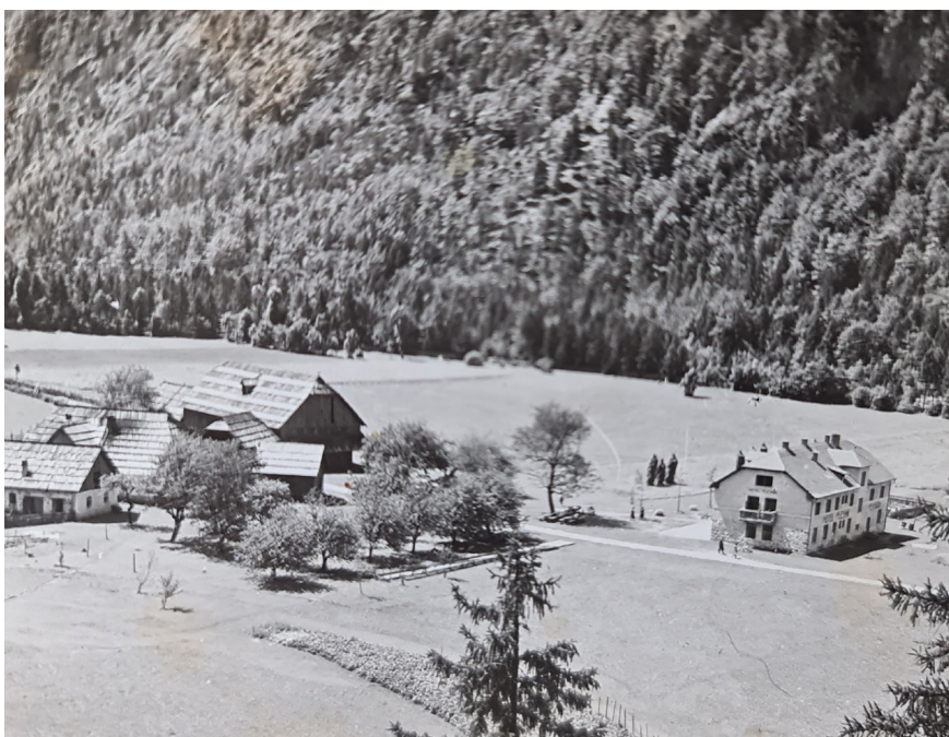
Fotografija 5: Poslopja na kmetiji Plesnik v tridesetih letih 20. stoletja.

Podobno so denimo prepovedali šope, 61 čeprav je na eni izmed starih fotografij razvidno, da jih je некоč imela vsaka hiša. Domačini opozarjajo, da so ob strogih pravilih in ukrepih zmedeni in ne vedo, kaj vzeti za zgled podobe krajine.