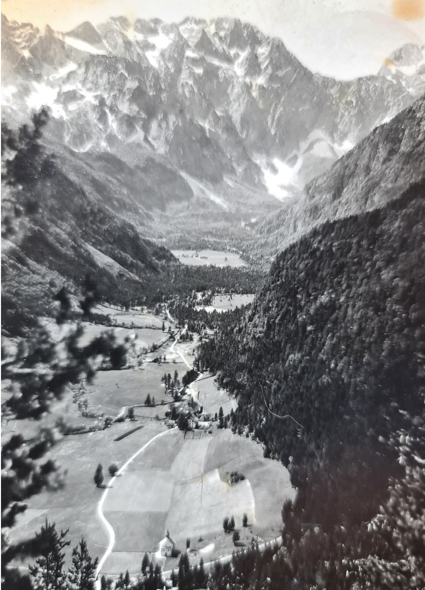
Fotografija 1: Logarska dolina v tridesetih letih 20. stoletja.