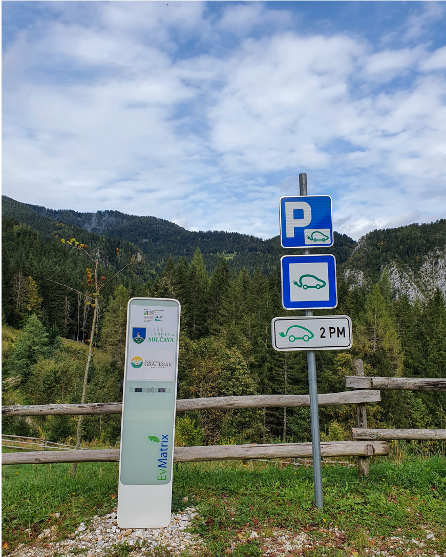
Fotografija 3: Polnilna postaja za električna vozila – danes znamenje prihodnosti, jutri predmet kulturne dediščine?