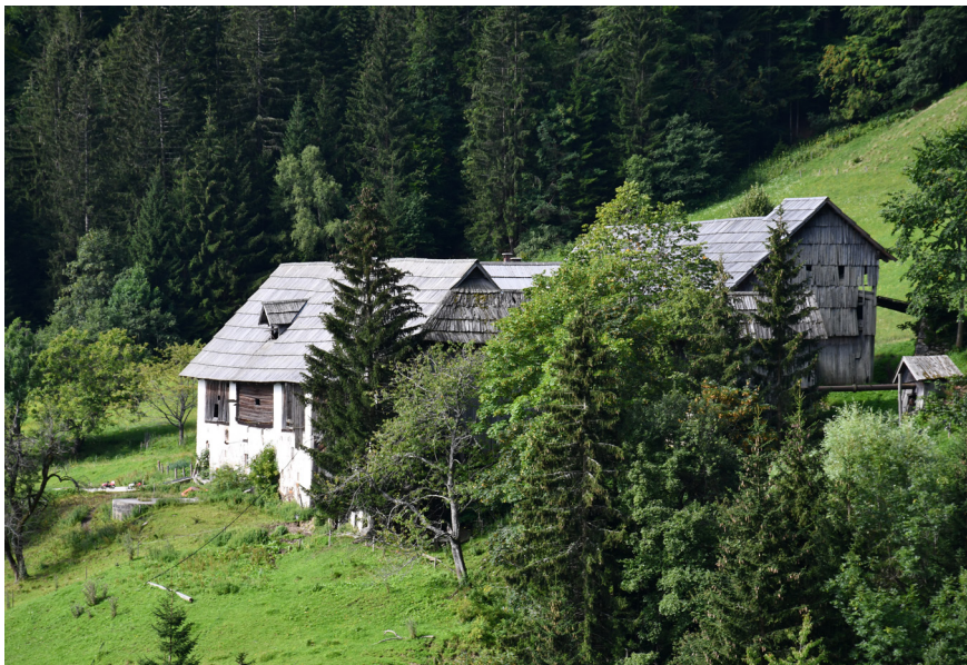
Fotografija 1: Macesnikovo gospodarsko poslopje. Božena Hostnik, Podolševa, 2020.

ena pa je razglašena za kulturni spomenik državnega pomena. 7 Od teh petinpetdesetih enot je štirideset stavb, sedem spominskih objektov, štiri kulturne krajine, tri arheološka najdišča in eno naselje. 8