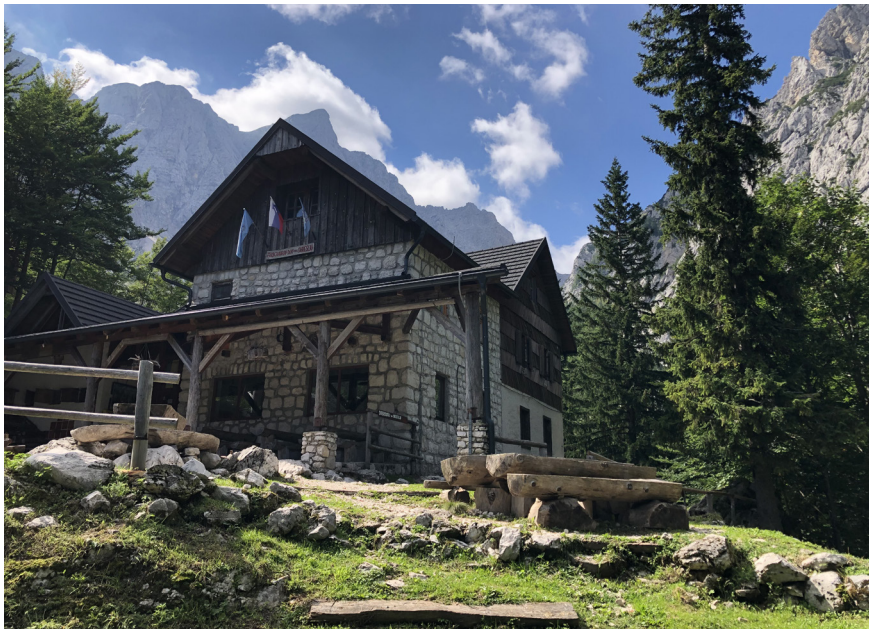
Fotografija 3: Frischaufov dom na Okrešlju leta 2018.