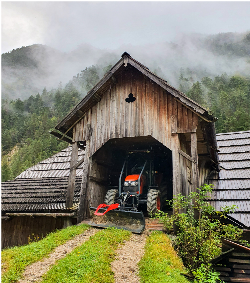
Fotografija 3: Kmečko poslopje s traktorjem na kmetiji Bevšek-Ošep. Taja Ivanc, Robanov kot, 2020.

Poleg mehanizacije je v strategijo družbene pomoči posegla tudi država. Leta 2011 je tedanja vlada pripravila predlog zakona za t. i. medsosedska razmerja, v katerem je z denarnimi sankcijami omejila oz. prepovedala medsosedsko pomoč. 46 V tem primeru je kodificirano pravo države postalo središče, ki je začelo vplivati na zasebno sfero družbe ter ljudsko pravo.