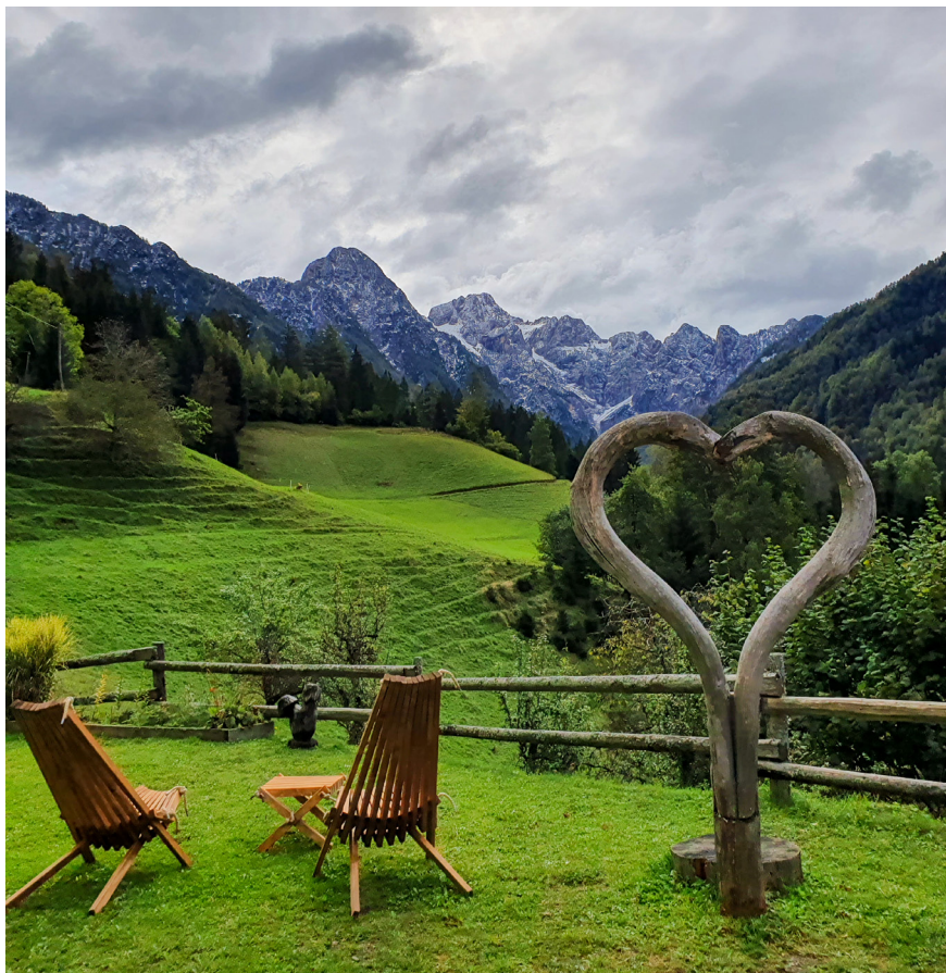
Fotografija 1: Razgledna točka, urejena v turistični namen. Taja Ivanc, Matkov kot, 2020.

Postavljanje meja in preprečevanje vstopanja na določena območja se torej zgodi predvsem takrat, kadar turisti na njih počnejo nekaj nezaželenega, celo uničujočega: