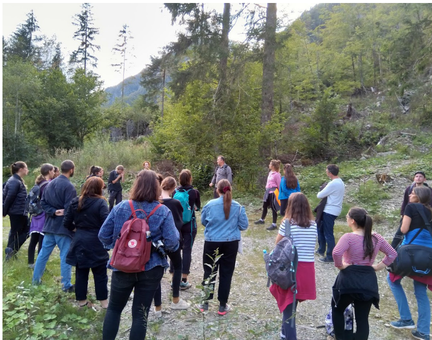
Fotografija 2: Udeleženke in udeleženci tabora med pohodom po naravoslovno-etnografski poti po Logarski dolini. Blaž Bajič, Logarska dolina, 2020.

Dognanja, ki smo jih predstavili v tistem popoldnevu, lahko v nadgrajeni obliki prebirate tudi v pričujoči publikaciji. Urejanje in poglobljena analiza zbranega gradiva, tedenske diskusije in prebiranje literature so nam namreč začeli razkrivati nekoliko jasnejši pogled na Solčavsko in Solčavane. V naslednjih odstavkih zato osvetljujemo nekatere družbene in kulturne razsežnosti Solčavskega, ki uokvirjajo etnografske izsledke, podrobneje predstavljene v osrednjih tematskih sklopih. V njih opozarjamo tudi na prepletenost vsebinskih poudarkov publikacije, ki jih moramo zavoljo celovitejšega antropološkega razumevanja osmišljati hkrati in skupaj, začenši z zgodovinskimi povezavami z bližnjo in daljno okolico.