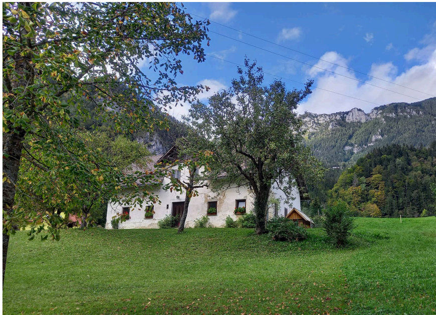
Fotografija 2: Pogled na staro hišo domačije Ramsak, v ospredju star sadovnjak, v ozadju pa potresno aktivno pobočje Olševe. Žiga Korbar, 2020.

vzeto, ker ni bila tako velika kmetija, ja. 17 Male in velike kmetije so torej vpliv nacionalizacije in denacionalizacije občutile precej drugače. Na primer, pred drugo svetovno vojno je bilo pri Matku odmerjenih 700 ha, pri Gradišniku 62 ha, po vojni pa je Gradišnikova kmetija izgubila le en hektar, medtem ko se je obseg Matkove zmanjšal za skoraj 90 %, na 73 ha. 18 Podržavljene so bile praviloma le gozdne in neproduktivne površine, tako da je večina kmetov izgubila malo obdelovalne zemlje, toda »kljub temu je dohodek večjih kmetij znatno upadel«. 19 Več domačinov poudari, da so pred uvedbo agrarne reforme nekateri kmetijsko zemljišče razdelili na več delov, da jim ne bi večine vzeli. Na primer: »Ja, petsto hektarjev so vzeli, osemdeset hektarjev so pustili mojemu očetu. Pol je tam teta nekaj imela, petindvajset, pa