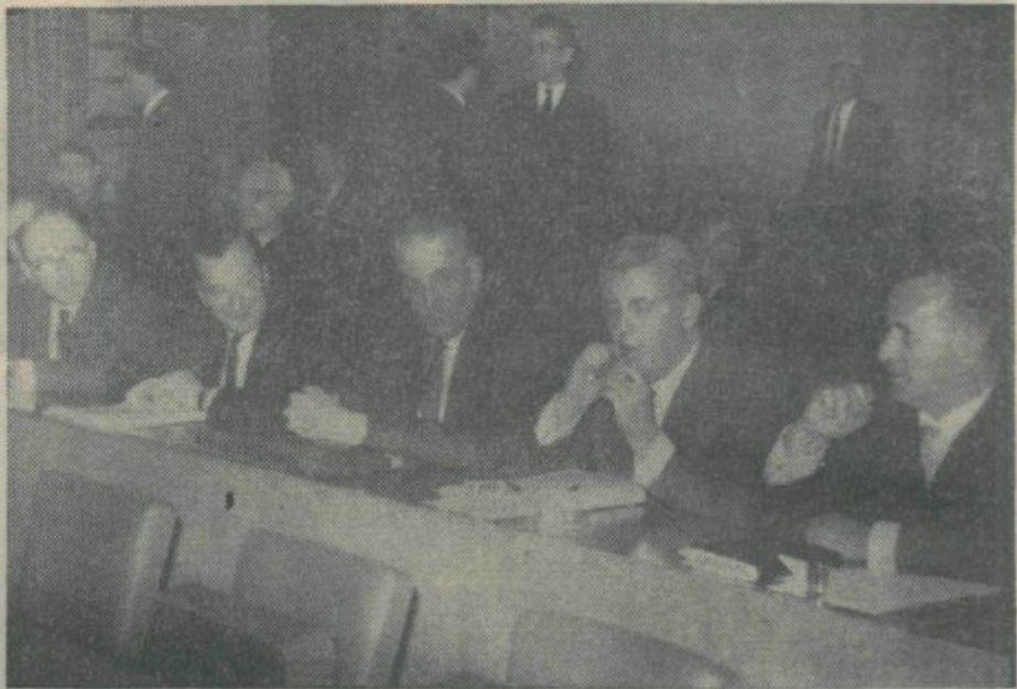
V Novem Sadu je bil 16. in 17. marca V. plenum Skupnosti jugoslovanskih univerz. Glavni predmet razprav na tem zasedanju je bil nov sistem nagrajevanja v visokem šolstvu. O teh vprašanjih je podrobno razpravljala tudi Univerzitetni svet (in nimamo namena še enkrat pisati o teh problemih.) Na sliki: predstavniki ljubljanske univerze na zasedanju v Novem Sadu med odmorom.

Kljub tako perečim vprašanjem pa menimo, da je nadvse potrebno, da se poskrbi za zadostno število lektorjev, kajti tu ne gre samo za sredstva in stanovanje, ampak tudi za študentovo znanje. Tega pa nikoli ne smemo pozabiti.