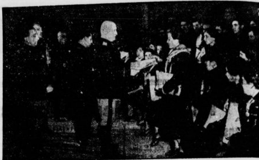
Duce obdaruje matere številnih otrok

Ko se je še zadržal v pogovoru o nekaterih problemih, ki zanimajo prebivalstvo, je zastopnik stranke zapustil bansko upravo,