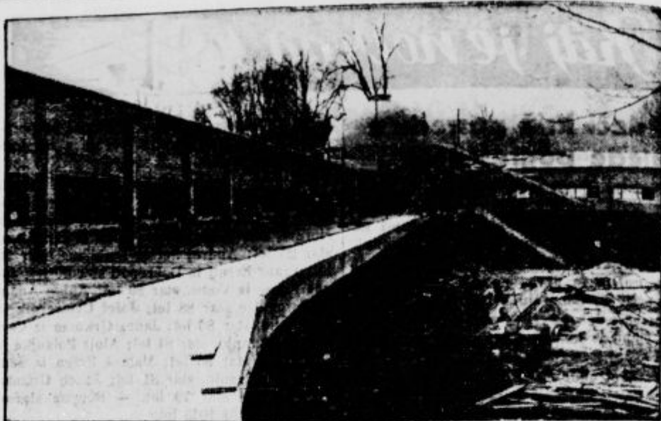
Novi velesejmski paviljon ob cesti v Tivoli. V ospredju železobetonska streha. V ozadju kupa nad stranskim vhodom ob Latermanovem drevoredu

V želji, da ugotovimo slovenske krvne žrtve v sedanjih vojski, prosimo svoje čitatelje, da nam sporoče imena, kraj in datum padlih slovenskih ljudi, bodisi, da so padli kot vojniki na bojišču, bodisi da so postali žrtve letalskih napadov ali drugih vojnih dejanj.