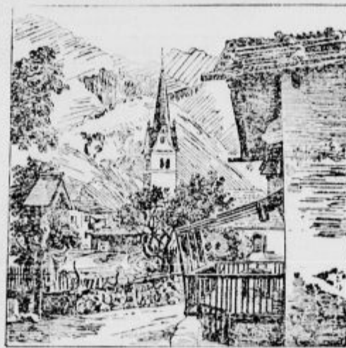
Kje je gostilničarka?