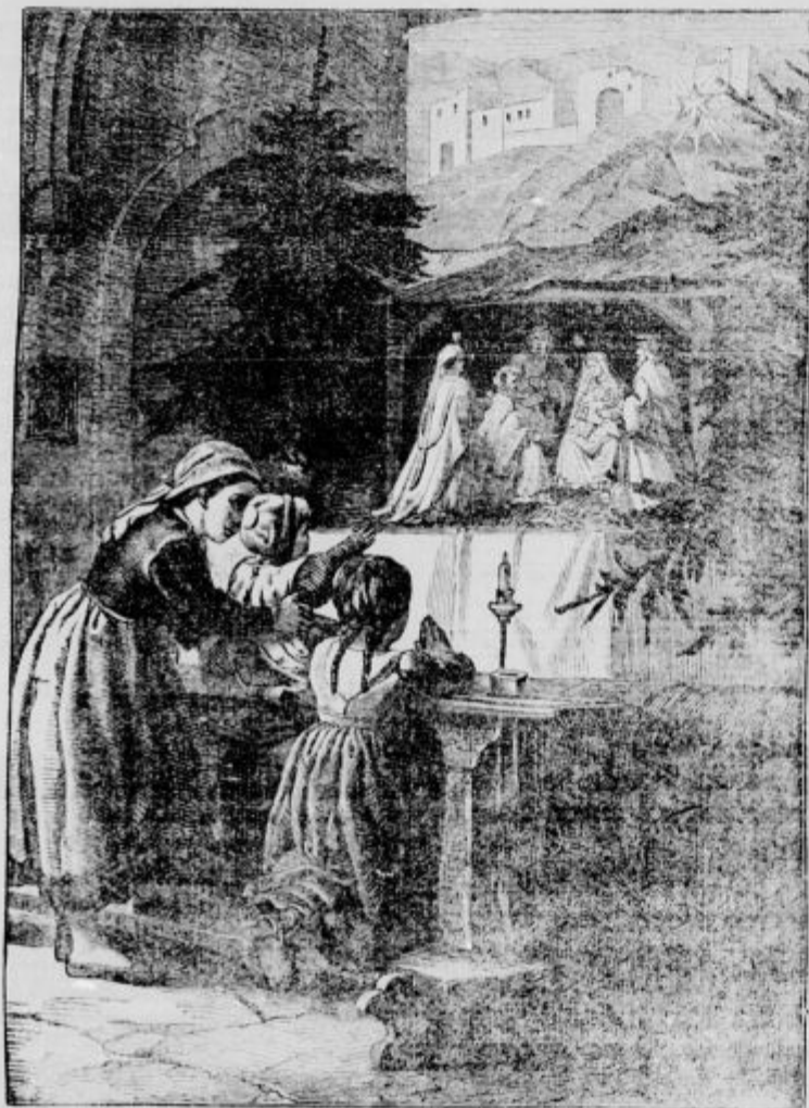
Naš atel: se tudi vojskuje. Ljubi Jezusček, varuj gal

Zdaj tukaj, zdaj tam. Ko omagajo pri Gorici, se vržejo Italijani na tolimsko območje; ko jim tu ne veda, pritisnejo v južnih Tirolah. Tako n. pr. so topničarji kaj pridno streljali 11. decembra na naše postojanke pri Rivi, Roveretu in na Col di Lano. V Judikariji je poskušala tudi pehota, ki so jo pa naši zavrnilo na višinah zahodno od doline. Tudi na goriškem območju so bili ta dan topovski boji. — V