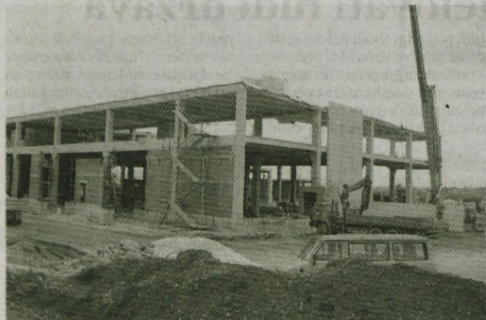
V dobrih štirih mesecih del bodo novi obrati podjetja Meso ob Korenovi cesti do konca leta že pod streho.