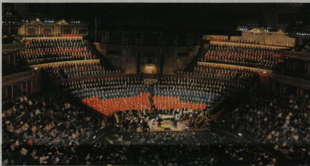
Med nastopom v sloviti Royal Albert Hall.