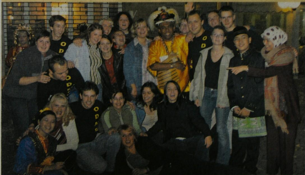
PESEM ZDRUŽUJE - po podelitvi priznanj smo se povesečili s tekmovalci iz Indonezije.

Praznovanje v Gradežu je trajalo vse do ranega jutra, domov pa smo se vrnili izredno zadovoljni z doseženim rezultatom. V hotelu, kjer smo bili nastanjeni, smo se veselili s prijatelji iz Estonije, na ulicah pa želi aplavze turistov in drugih pevcev, ki smo jih srečevali, kajti pesem