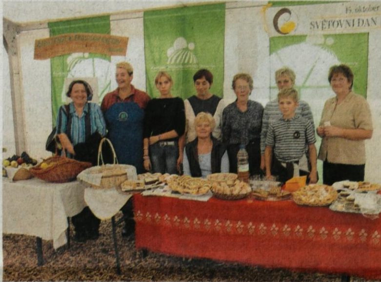
Angelca sedi, v ozadju kmetice iz Kamnika in Komende na nedavnem jesensko obrtniškem sejmu v Komendi.

čujejo na podeželju in v družbi. Vloga žene na kmetiji je pomembna tako pri delu kot vzgoji otrok in še posebej pri skrbi za ostarele starše in ostale družinske člane.