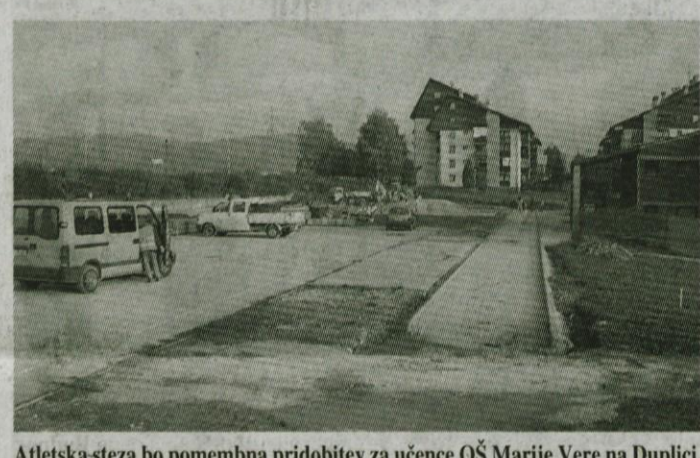
Atletska steza bo pomembna pridobitev za učence OŠ Marije Vere na Duplici.