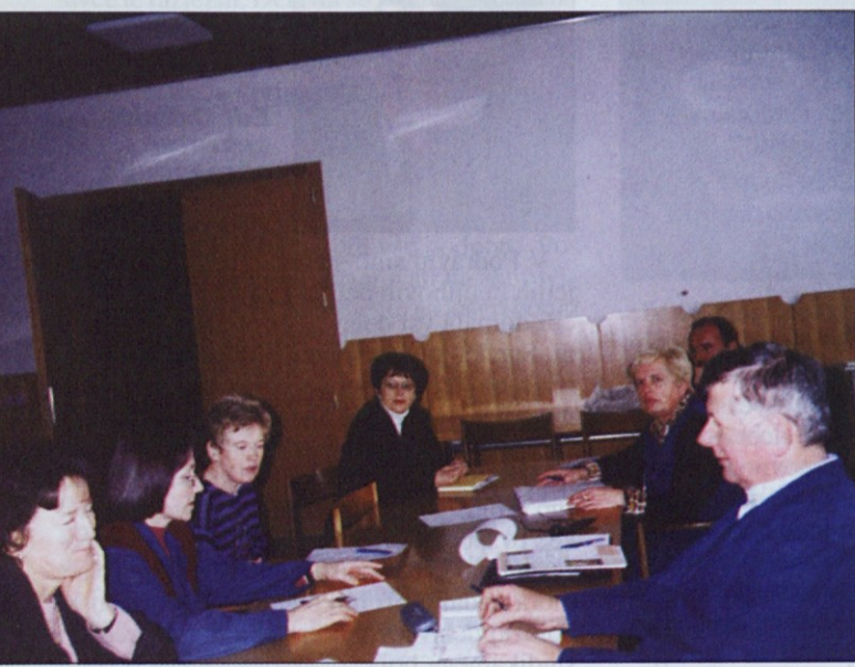
Izvršni odbor sindikata med obravnavo prisilne poravnave.

Okrožno sodišče v Ljubljani je začetku januarja sprejelo sklep o začetku prisilne poravnave za družbo Induplati Tekstil iz Jarš. Za prisilnega upravitelja je imenoval Andreja Toša.