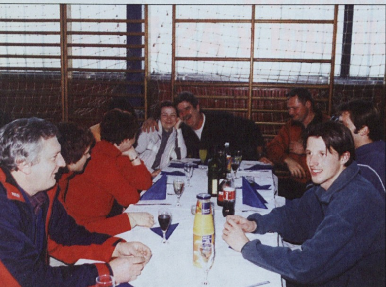
Ekipa SGP Zasavje je bila zelo vesela.