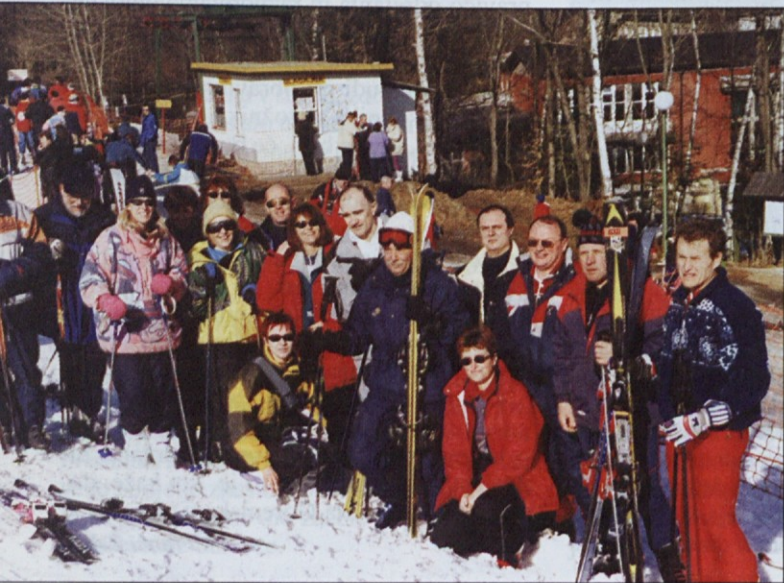
Na umetnem snegu so se pred fotoaparatom postavili Grosupeljčani, čeprav še niso vedeli, da bodo prejeli pokal za tretje mesto.