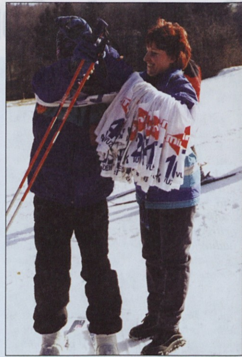
Na smučišču je imelo veliko dela dekleta, ki je zbiralo štartne številke. Slišali smo jo reči: Moške je težko sleči.