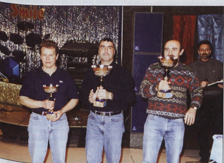
Predstavniki najboljših ekip so prejeli velike pokale.