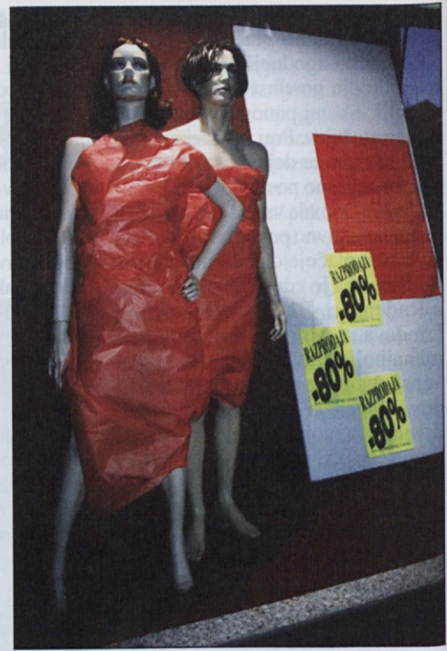
Jeklotehna trgovina v stečaju je svoje zaloge razprodala z velikim popustom.

Ko smo po stečaju obiskali trgovke v Merkurju, mnoge niso mogle skriti svojega razočaranja. »V Merkurju sem delala več kot dvajset let. Sploh še nisem dojela, da bo Merkur poslej zaprt in da sem po tolikih letih ostala brez dela,« je dejala ena od delavk, ki ni želela biti imenovana. »Zdaj, ko sem izgubila službo, ne bom dajala nobenih intervjujev. Potem bom še težje našla novo zaposlitev,« je dejala. »Lahko pa zapišete, da je zares žalostno, da so v minulem desetletju propadla skoraj vsa velika mariborska podjetja, od industrije do trgovine. V mestu in okolici je že zdaj