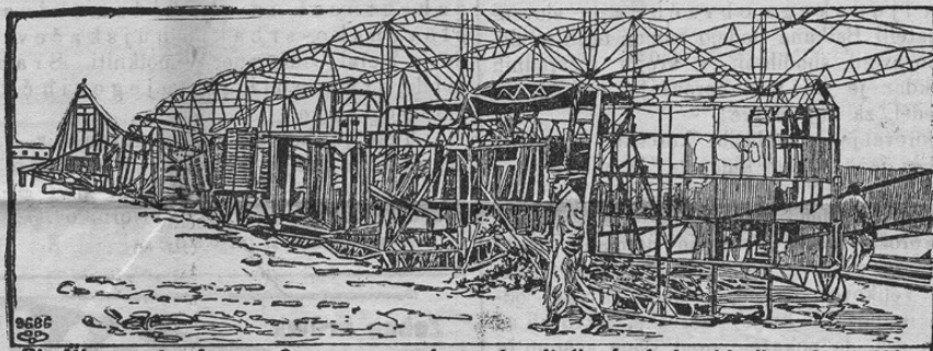
Die Überreste des am Comersee verbrannten italienisch. Lenkballons CittàdiMilano.

Dne 9. maja zadela je italijansko vojaško zrakoplovstvo velika nesreča. Letalni stroj „Città di Milano“ bil je vsled razstrelbe popolnoma uničen. Vihar je namreč blizu Cente odtrgal letalni stroj; okoli 150 m od lice mesta vstavil se je stroj v vejevju drevja, ki je balonu mnogo škodovalo. Plini so se vneli in zgodila se je eksplozija, vsled katere je bil takoj ves stroj v plamenih. 50 oseb, ki so prihiteli na pomoč,