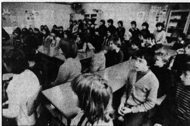
Redna jutranja vaja zbora osnovne šole v Gornji Radgoni.