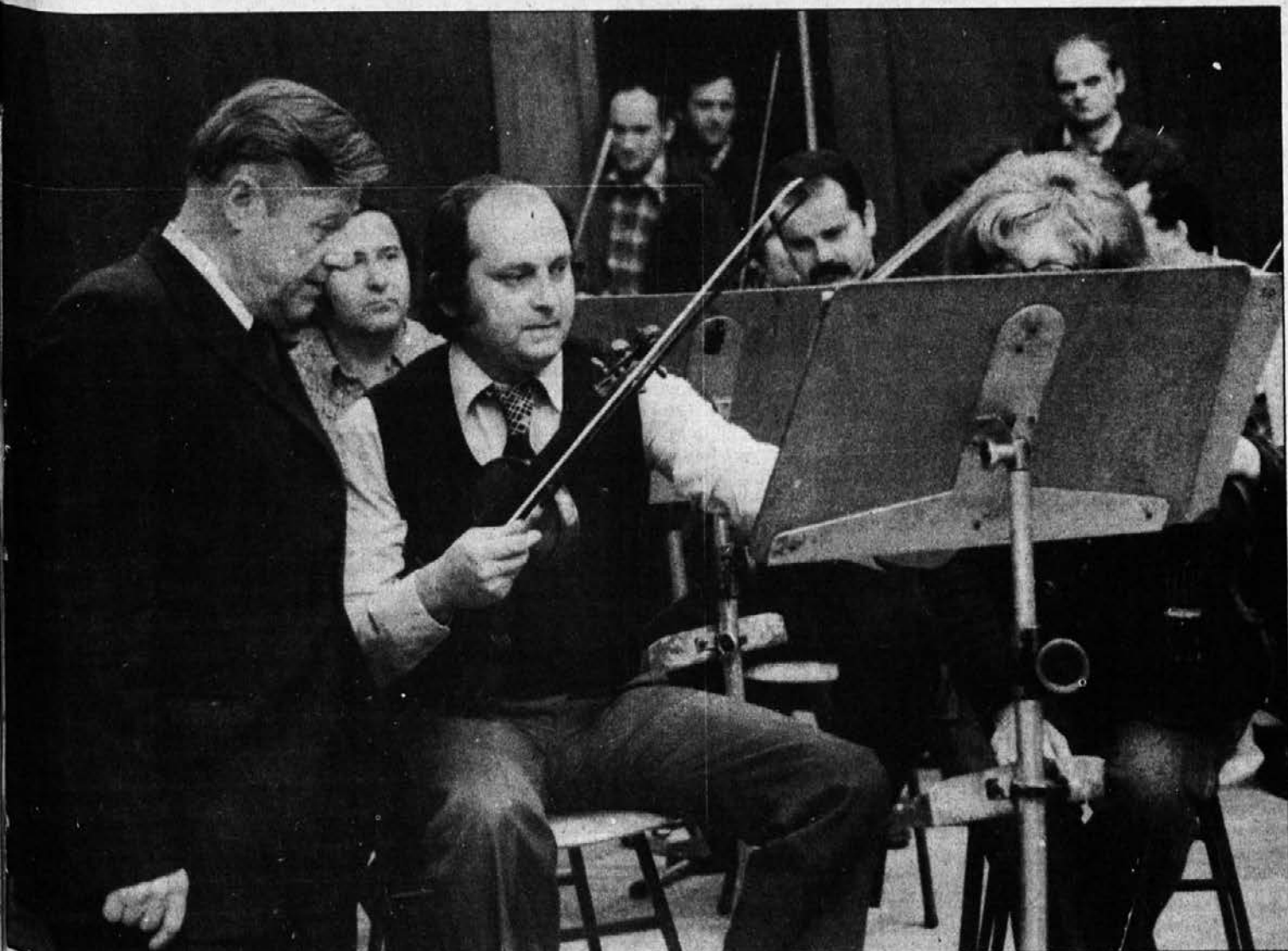
Skladatelj na vaji simfoničnega orkestra Slovenske filharmonije.