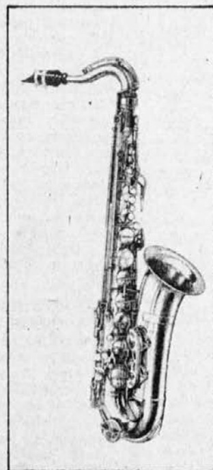
Tenorski, melodični saksofon.