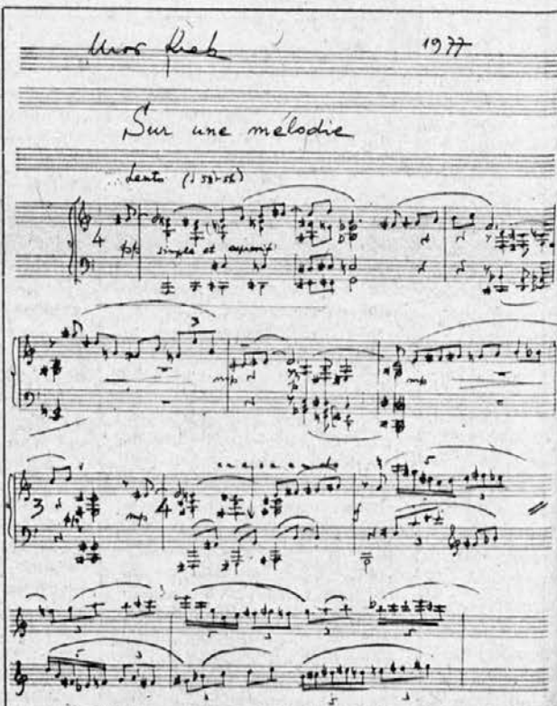
Rokopis Krekove najnoveše skladbe.