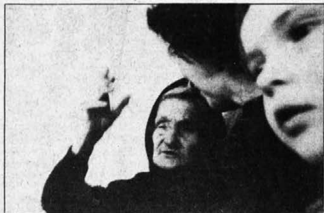
1. Kraljeva mati, ki kljub visoki starosti še vedno iskriivo pripoveduje in poje.