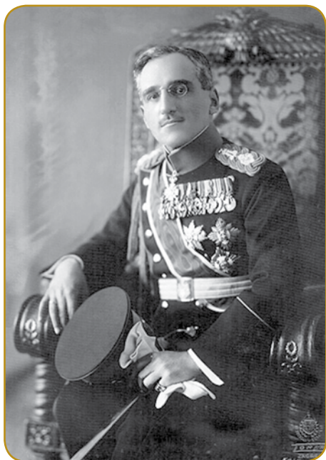
Aleksander Karađorđević je biu po prvoj svetovnoj bojni oprvin regent, sledik pa krau vküpnoga rosaga južni Slavov

Po konci prve svetovne bojne je avstro-ogrska monarhija vrazmo spadnila. Južni Slavi iz Monarhije so 29. oktobra 1918 vözglasili Državo Slovencev, Hrvatov in Srbov, štero je pelo Narodni svet (Nemzeti Tanács) v Zagrebi s slovenskim predsednikom Antonom Korošcom . V Ljubljani je delala Narodna vlada, grajnca med nekdešnjimi deželami pa so zgübile znamenje. Vlada se je dosta spravljala s tem, ka aj bi sodake nazaj s fronte pripelala. Če rejsan je Država SHS živejla samo malo več kak eden mejsac, so na Slovenskom gratali vsi kancelaji pa šaule slovenski. Toga rosaga pa so na tihinskom nej pripoznali, nej je emo djenu zamerkanu