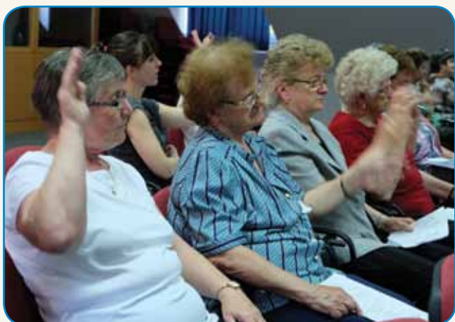
V Sakalauvaj prisekali nauvi gasilci stran 7

«SLOVENCI SO LAHKO VZOR ZA DRUGE NARODNOSTI»