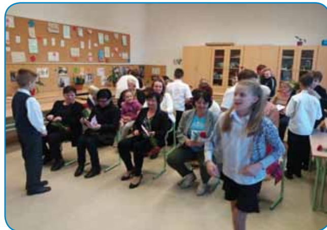
Učenci 4. razreda so mamicam in babicam izročili rože.

Učenci DOŠ Jožefa Košiča na Gornjem Seniku so ob mentorstvu svojih učiteljev pripravili prekrasne programe svojim mamicam in babicam ob minulem materinskem dnevu. V njihovih otroških srcih se je čutila ogromna zahvala, ki so jo učenci izrazili z besedami, s plesom, petjem in seveda z ogromnim objemom in darovanim cvetjem. Marsikateri mamicam ali babicam je ob tem na lice pritekla solza sreče. Tudi takrat, ko so govorili ali peli slovensko.