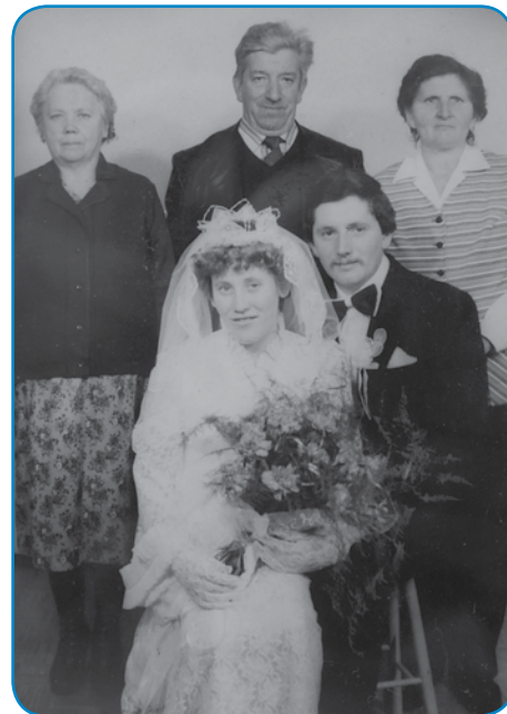
Zdavanjski kejp iz osemdeseti lejt

- Samo ram mate tū ali grünt ste tū vcuj küpli?