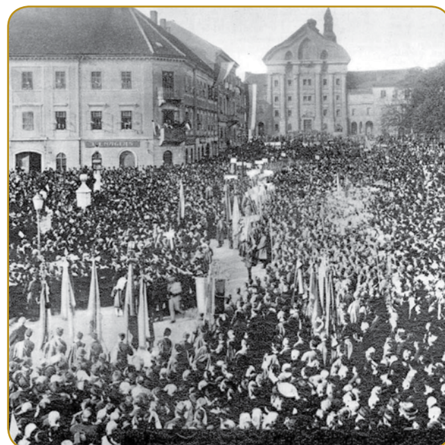
Na ljubljanskom Kongresnom trgi so svetili nauvo Državo SHS (29. oktober 1918)

stranka v rosagi, Narodna radikalna stranka, je bila krepka med srbskov većinov. Hrvška kmečka stranka je želejla federalizem ino vekšo avtonomijo, njenoga predsednika Stjepana Radića pa je vleti 1928 v parlamentu dojstrliu srbski poslanec Puniša Račić . Zavolo toga so Hrvati eške bole prauti centraliziranomi rosagi bili. Muslimanski Bošnjaki so podpérali Jugoslovansko muslimansko organizacijo, ko-