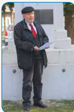
Včiu ga je porabski školnik stran 5