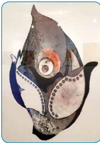
Tako je likovnik in pedagog iz Mozirja upodobil rojstvo

občini. Do tedaj tovrstnih prireditev ni bilo. »Ex tempore« pa je začel s privabljanjem različnih umetnikov tako iz Slovenije kakor iz zamejstva, z avstrijske Koroške, iz Bene-