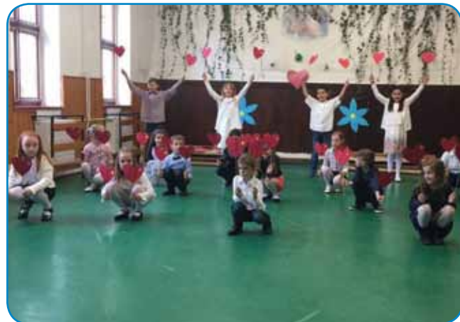
Učenci 1. in 3. razreda so mamicam in babicam tudi zaplesali.