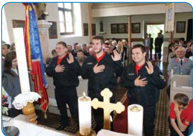
Prisega nauvi gasilcov

sta gučala o tom, ka sta leko na ednom tali ogenj pa voda trno koristniva, dapa če se obrneta prauti lidam, leko