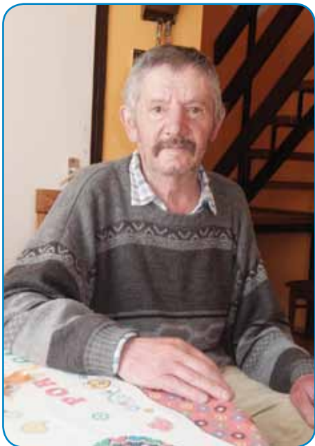
Karči se piše Žöks (Zsöksz), njegov brat Pišti pa Žöks (Zsöks)

»Dobro je bilau tam gorarasti, pa gde indrik bi goraraso, če sem se že ta naraudo. Če bi nej dobro bilau, pa bi dobro moglo biti. Na Verico sem odo v šaulo, v Števanovce sem odo v šaulo, gda sem go vōzopodo, te se pa v Sombotel ušo se za zidara včit.«