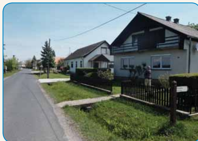
Še stene vije majo stran 8