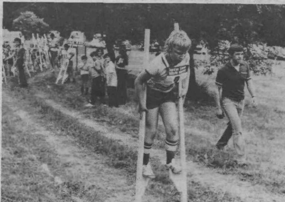
Krajevna skupnost Videm-Dol je pred nedavnim pridelila republiško prvenstvo v hoji na hoduljah. V lepem vremenu in dobrem razpoloženju je pridelitev imenitno uspela.

Za vse ostale organizacije in individualne kupce, ki niso podpisniki