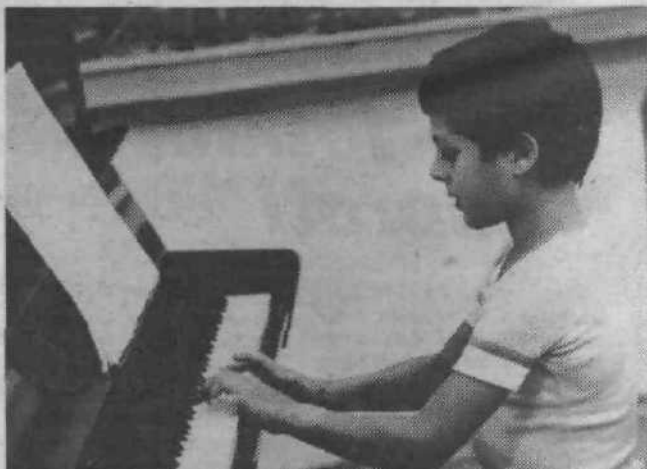
Zaključek šolskega leta so pričakali tudi učenci glasbene šole Franca Šturma. Naše slika prikazuje mladega pianista, ki je na končnem nastopu staršem in součencem pokazal, kaj se je naučil v minulem šolskem letu.

tivnost udeležencev NOB. S tem bo organizacija dostojno proslavila 4. julij - dan borca. JOŽE VIDMAR