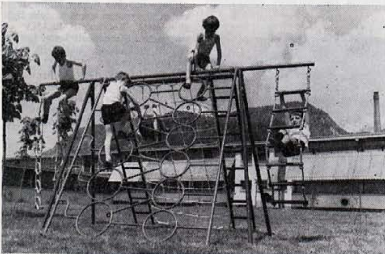
Za vsakogar nekaj