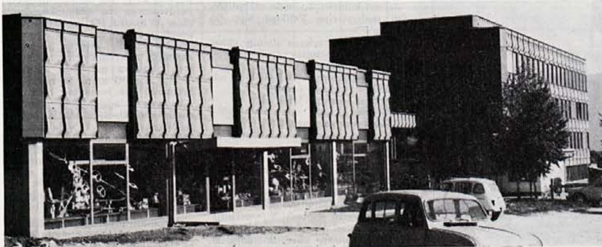
Nova trgovina z upravnim poslopljem