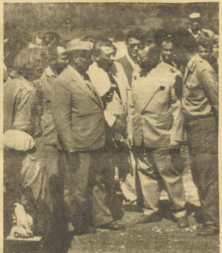
Tovariš Tito se je zanimal kako napredujejo dela.