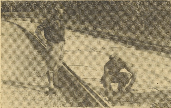
Priprava cestišča za betoniranje.