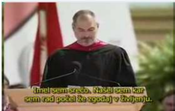
Govor Steve Jobs leta 2005 na univerzi Stanford.