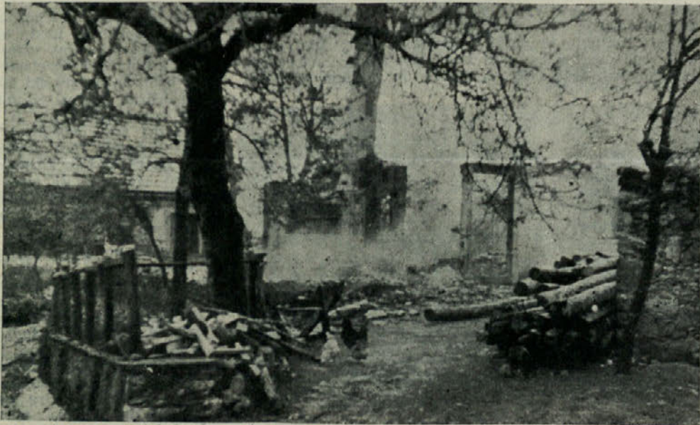
Kako hudo mi je pri sreju, ko vidim druge otroke, ki imajo še svoj dom, nam so ga pa uničili Italijani. Naša hiša je žalostno pogorišče...