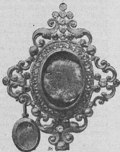
Svetinja p. Papetarda z zmečkano kroglo.

Duhovnik in častnik poklekmeta in slavita usmiljeno pomoč Marije. Po mogočni Marijini milosti globoko ginjeni Papetard spozna ničevost dosedanjega življenja. Ponižno in ske-