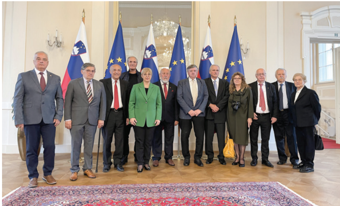
Sprejem pri predsednici Republike Slovenije