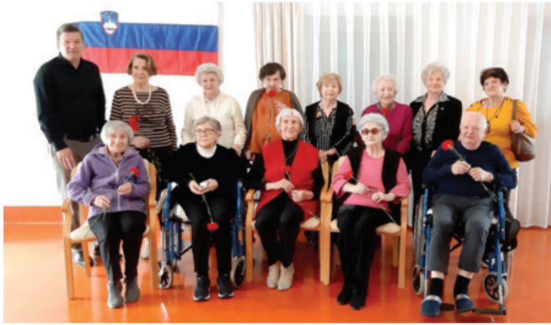
Stanovalci DSO Fužine, ki so sodelovali pri razstavi.

prvomajskih praznikov in obletnice konca druge svetovne vojne so pripravili zanimivo razstavo z nas-