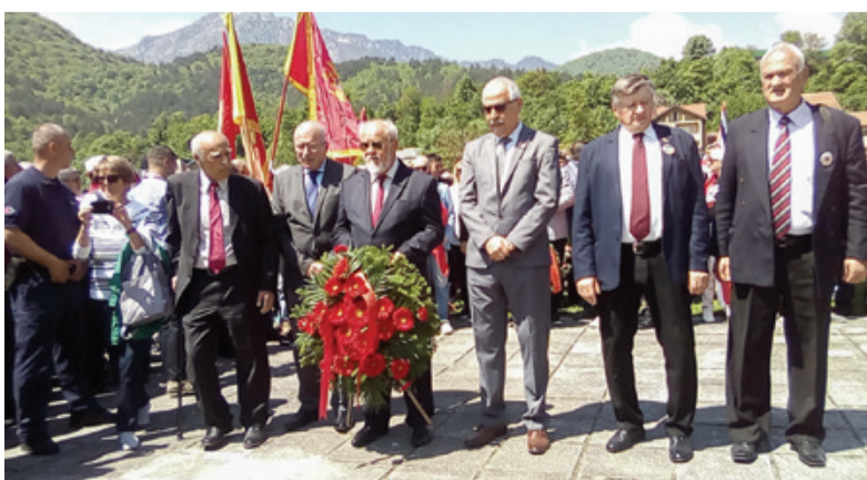
Polaganje skupnega venca