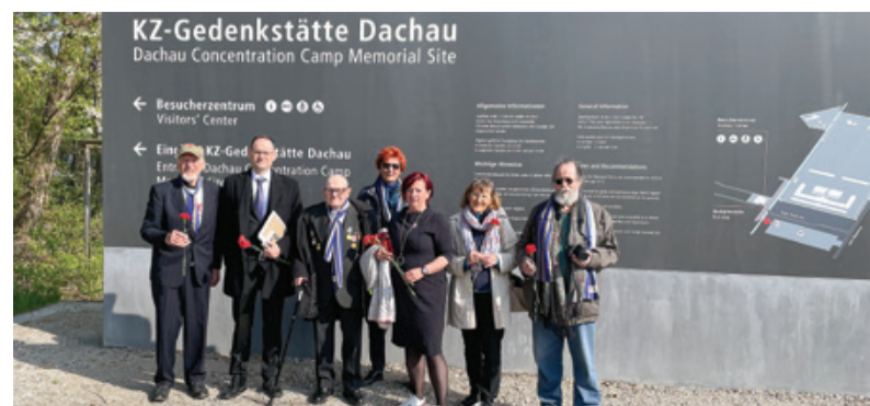
Slovenska delegacija v Dachauu