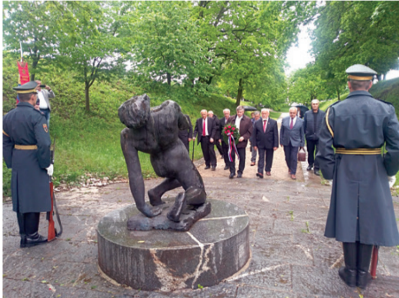
Polaganje venca v Gramozni jami

drugi svetovni vojni v Evropi. Tudi ta zaključna dogajanja in boji na naših tleh so nas neposredno povezovali; v njih so že po formalni nemški kapitulaciji sodelovali in krvaveli sinovi in hčere vseh naših narodov. In tudi zato danes potrjujemo našo povezanost in pomen našega skupnega narodnoosvobodilnega boja ter skupaj pošiljamo še močnejše antifašistično sporočilo širši, tudi mednarodni javnosti za mir, medsebojno spoštovanje in razumevanje