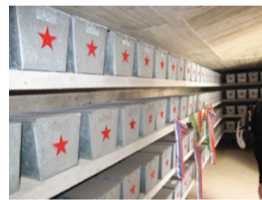
Kostnica v Sansepolcro v Toskani, kjer so posmrtni ostanki jugoslovanskih taboriščnikov iz Reniccija in padlih v bojih proti Nemcem v tem delu Italije.