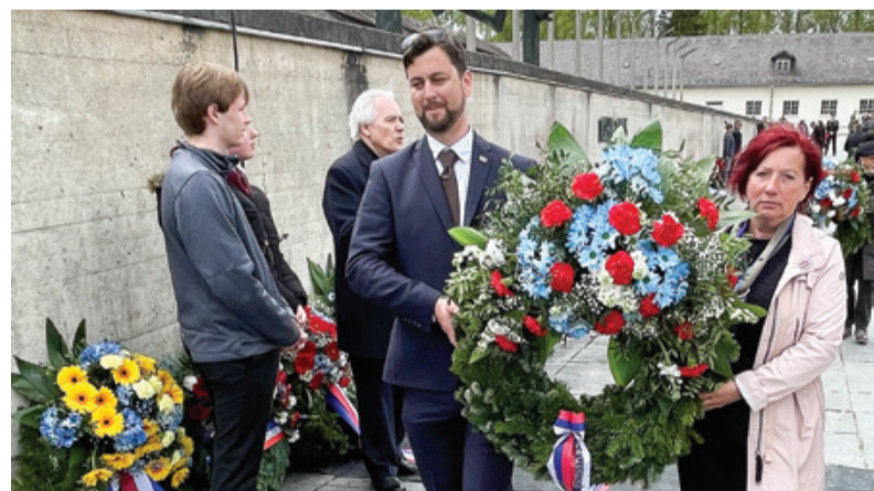
Polaganje venca k spominskemu obeležju