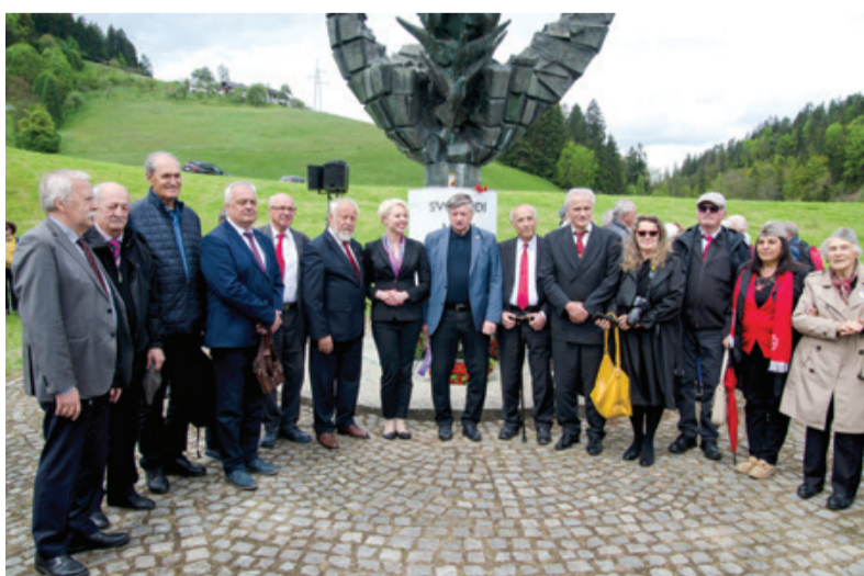
Osrednja spomska slovesnost na Poljani