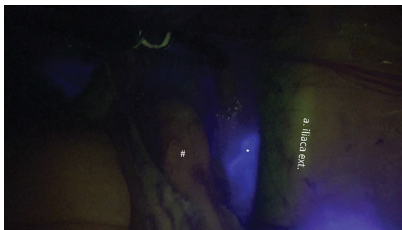
Slika 1: Prikaz varovalne bezgavke med operacijo: pri bližnji infrardeči svetlobi ICG barvilo, vbrizgano v maternični vrat in kasneje prisotno v tkivu varovalne bezgavke, fluorescira, kar med laparoskopijo zaznamo z uporabo ustreznega filtra.

tveganja, kar spremeni obseg kirurškega določanja razširjenosti bolezni – stadija ( angl. staging) in potrebo po limfadenektomiji (11). Kompromis med radikalno limfadenektomijo in opustitvijo limfadenektomije predstavlja odstranitev varovalne bezgavke (1). Če je varovalna bezgavka negativna, se predvideva, da v ostalih bezgavkah ni zasevkov (12). Biopsijo varovalne bezgavke so že sprejeli v doktrino zdravljenja malignega melanoma, raka dojke in raka zunanjega spolovila (13). Z oceno bolezni v varovalni bezgavki, predvsem pri bolnicah z nizko tveganim rakom endometrija, lahko zadostimo zahtevam po kirurški oceni napredovanja bolezni v bezgavke, hkrati pa znižamo pojavnost zapletov limfadenektomije (1). Algoritem biopsije varovalne bezgavke je že uvrščen v smernice ameriške nacionalne mreže ( angl. National Comprehensive Cancer Network, NCCN) (14) za bolnice z nizko in srednje tveganim rakom endometrija tipa I in v priporočila ESGO-ESMO-ESTRO (8), ki tako varno nadomesti limfadenektomijo (15).