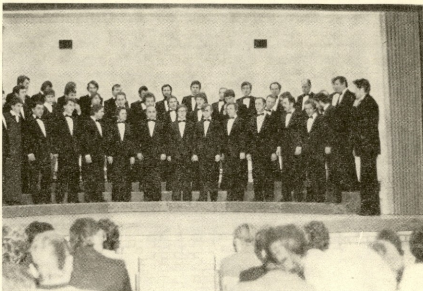
Koncert PZ Liko — Verd v šoli I. Cankarja