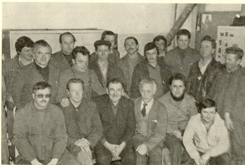
Ob slovesu še zadnji skupni posnetek s sodelavci

prvih sejah izmed sebe izvolili predsednika, podpredsednika, sekretarja in blagajnika.