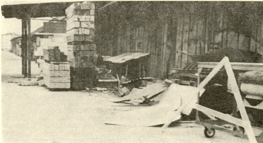
Z boljšim izkoriščanjem in skladiščenjem materiala bomo dosegli tudi večji dohodek

Za doseganje teh ciljev bomo morali ustvariti proizvodnjo v vrednosti 607.252.000 din oz. 988.906 N/h. Tudi v letu 1980 bo proizvodnja TOZD Tovarna stolov usmerjena pretežno v izvoz, TOZD Primarna predelava bo izvozila toliko, da bo pokrila lastne potrebe po uvozu, za cilj pa smo si postavili plasirati na tuje tržišče del proizvodnje TOZD Tovarna vrat. Skupaj planiramo izvoza v vrednosti 193.622.000 din oz. 9.660 $. Pri tem načrtujemo povečanje deleža evropskega trga