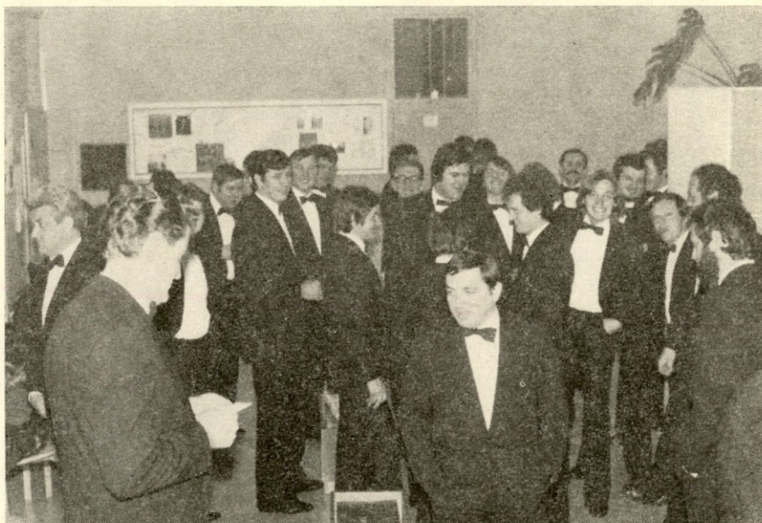
Takole pa se pevci sprostijo v odmoru med koncertom