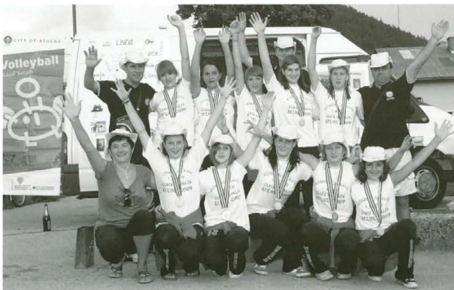
Še posnetek za spomin