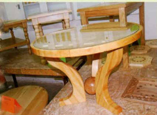
Različni dizajni mize