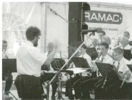
Prireditev so v veselem slogu zaključili glasbeniki iz Slovenj Gradca

godb, to je nekaj več kakor petsto muzikantov. Vsak je zaigral po tri komade, resne, manj resne, z venčki narodnih pa vse do čudovitih plesnih vložkov in vse do čisto pravega kankana. Je hitreje plala mlada kri, obujali so spomine starejši. Pomislite, trinajsto srečanje, že polnih 26 let se dobivamo v Trbnjnjah, pa je še vedno veselo kakor na začetku. Veličastno zveni na kraju skupni nastop vseh godb in zadoni med tem hribovjem. Ampak za tem se zberejo posamezne poznane ali čisto slučajne skupine in zopet se prebudi ljudska, moderna, kdo ve kakšna zvrst glasbe še - to vam je festival! Si upa kdo poreči, da ni čudovito? Padajo zaobljube, seveda pridemo na štirinajsto, pridemo v Trbnje. Pa še to: Trbnjčani oziroma njihovi muzikanti so dobili nove lepe obleke, so »pobje«, da je kaj, pa tudi dekleta so »prmojduš«, smo že davno ugotovili, da imajo najlepše »škornje«, pa naj kdo reče, da nimamo podmladka. So to »skup spravili« tudi zahvaljujoč se mnogim domačinom in drugim; če se hoče, gre! Je pa v tem ogromno truda.