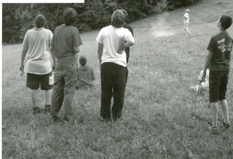
Za Smučarsko kočo je 30. junija 2009 poletela raketa