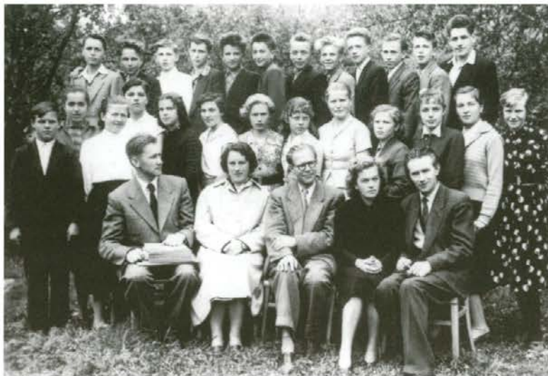
4. razred nižje gimnazije Slovenj Gradec 1957