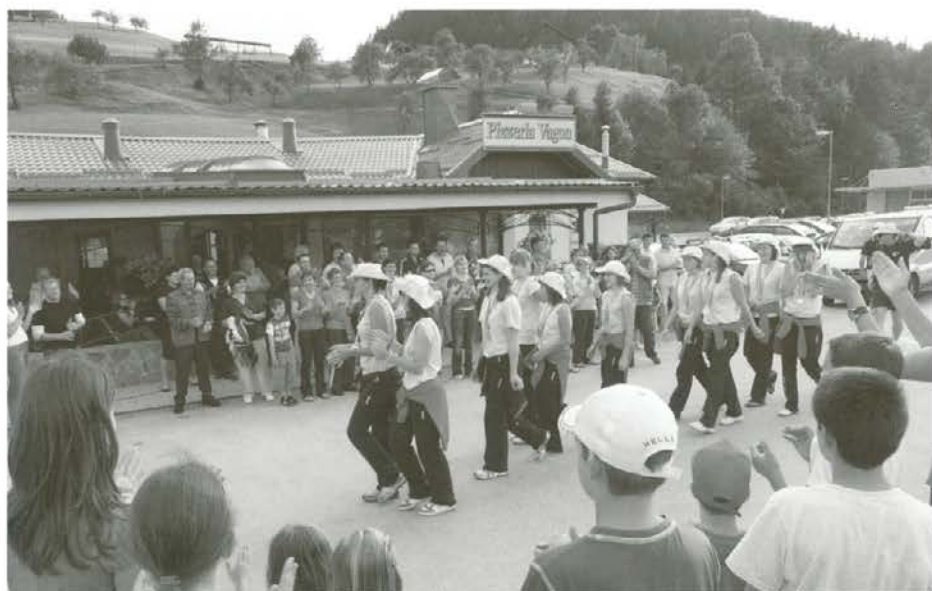
Starši in ljubitelji odbojke so navdušeno zaploskali šampionkam

V večernih urah prvega julijskega dne je mlade mislinjske odbojkarice čakalo prijetno presenečenje. Pripravili so jim ga domači ljubitelji te popularne igre na mreži. Na priložnost, da jim gromovito zaploskajo in jih nagradijo, so čakali od tistih sobotnih trenutkov, ko je iz športne Grčije pricurjela senzacionalna novica. Po zmagi nad ekipo Bratislave, ki so jo »naservirale« že v predtekmovanju, so na olimpijskih igrah mladih namreč že drugič zmagale odbojkarice iz Mislinje. Dekletom, ki so v Atenah z odličnimi igrami uresničile sanjsko željo, da po lanski zlati medalji v San Franciscu okrasijo svoje vitrine z novo medaljo najsijajnejšega kova, je zazvenel še športni »hip hura«. Vsem, ki so »naservirale« svetovno smetano mladim mojstric odbojke, je vsak želel stisniti roko. Še prej pa so jim prisotni še enkrat zaploskali za priznanje »športnik leta 2008«, ki ga je ŽOK Mislinja dobil ob letošnjem občinskem prazniku. Seveda smo praznovanje okronali s kozarčkom penine, šampionke pa so hvaležne za pozornost veselo zaplesale.