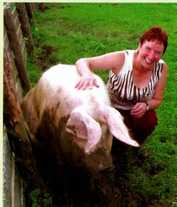
Prašiči imajo urejen izpust