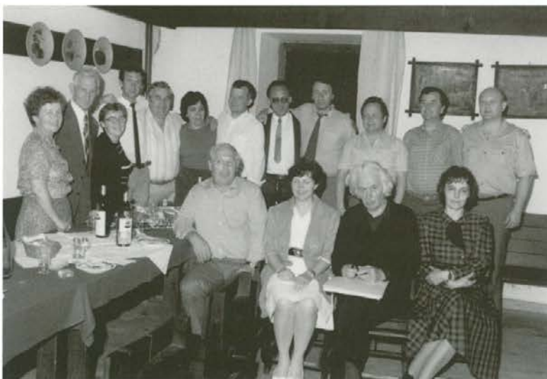
2. razred nižje gimnazije Slovenj Gradec 1987