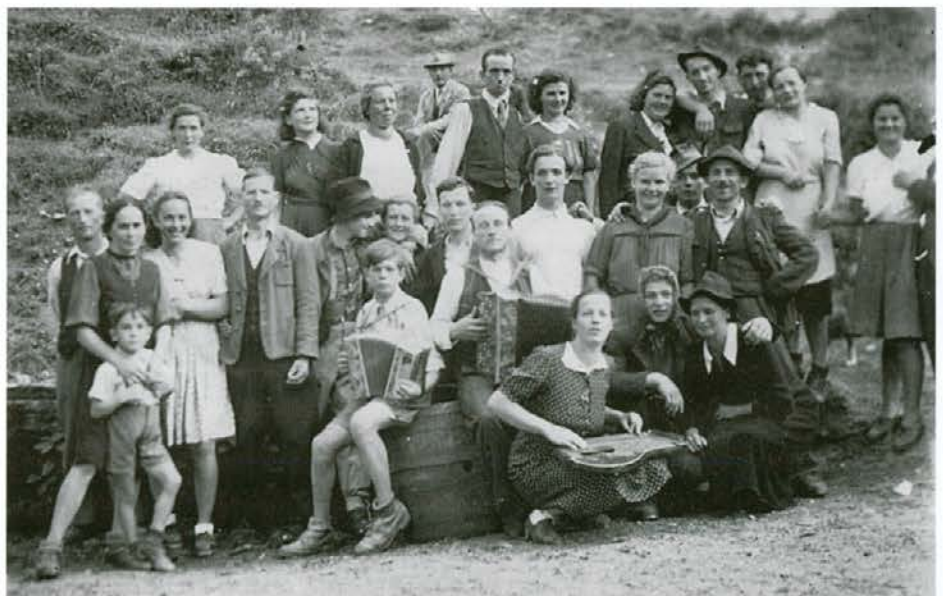
Zbor mladih zadružnikov ZK Dolič leta 1958

Leta 1958 smo pri KZ Dolič ustanovili aktiv mladih zadružnikov. Večina od teh je kasneje prevzela kmetije v Doliču, na Kozjaku, Završah, Paki ter na Tolstem vrhu. Danes na teh posestvih gospodarijo njihovi otroci, pa tudi že vnuki.