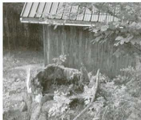
Panj votle smreke na Naravskih ledinah

Uršlja gora je zelo zanimiva gora. Kot osamelec je vidna z vseh strani Slovenije. Planinci se na poti na goro ali z nje radi odpočijejo v planinski koči na Naravskih ledinah. Kočo lahko obišejo tudi tisti, ki težko hodijo. Iz Kotelj se lahko pripeljejo