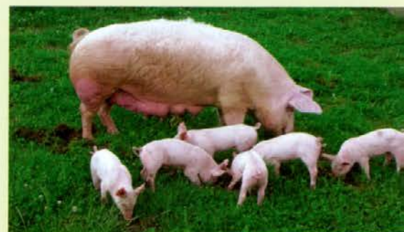
Na Marjetino prošnjo tudi sede

Če se vam bo zahotelo domače hrane, se oglasite pri Jamniku, lepo vas bodo postregli.