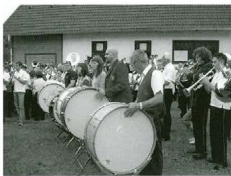
Skupni nastop več kakor 500 muzikantov