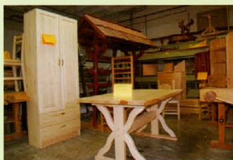
Izdelki dijakov za zaključni izpit in poklicno matura