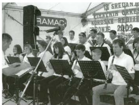
Nastop Kmečke godbe Pernice