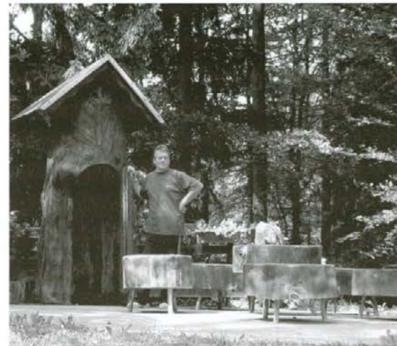
Oskrbnik planinske koč na Naravskih ledinah pred votlo smreko