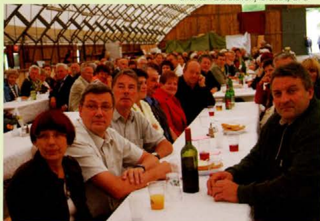
Med gosti so bili župani in predstavniki občin