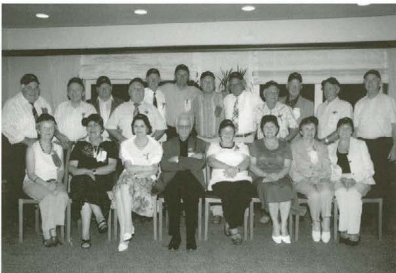
3. razred nižje gimnazije Slovenj Gradec 2007