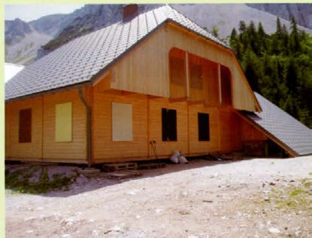
Primer lesene gradnje: planinski dom na Zelenici - gradnjo je izvedla Smreka Gornji Grad, l. t. d.

Gozdno Gospodarstvo Slovenj Gradec, d. d., ima v okviru povezanega podjetja Smreke Gornji grad, l. t. d., že sedaj v svojem proizvodnem programu izdelavo lesenih hiš, za bodočnost pa pripravlja projekte izdelave eko etno bivalnih hiš, za kar bo kader iz lesarske stroke še kako dobrodošel.