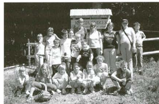
Otvoriti so prisostvovali učenci in učiteljice podružnične OŠ Leše