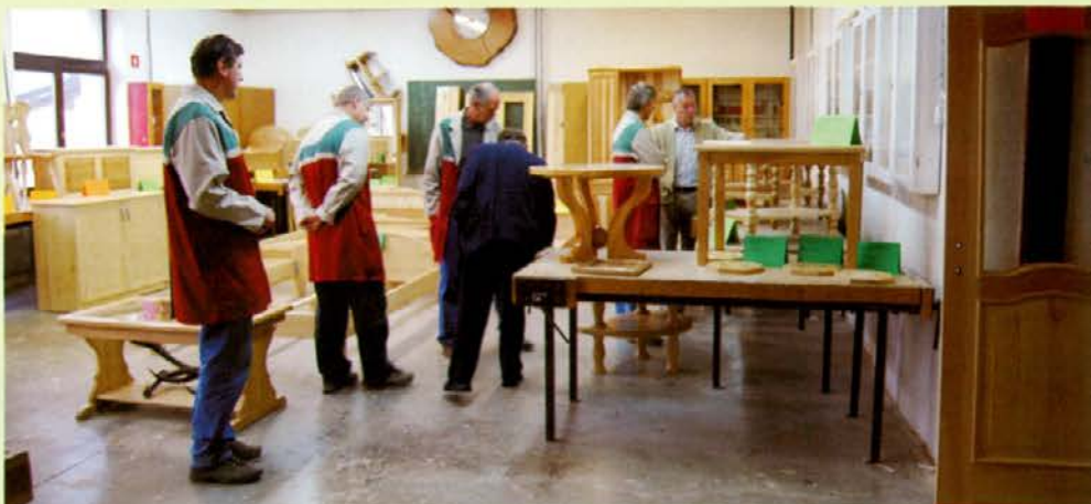
Strokovni pregled izdelkov

Gozdno Gospodarstvo Slovenj Gradec, d. d., ima v okviru povezanega podjetja Smreke Gornji grad, l. t. d., že sedaj v svojem proizvodnem programu izdelavo lesenih hiš, za bodočnost pa pripravlja projekte izdelave eko etno bivalnih hiš, za kar bo kader iz lesarske stroke še kako dobrodošel.