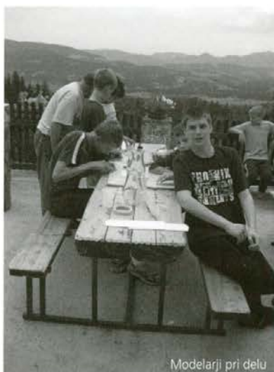
Modelarji pri delu

Pričele so se počitnice, šolarji so pozabili na šolske obveznosti. Nekateri so se podali na morje, nekateri preživljajo proste dni doma. Štirinajst učencev iz Ljubljane, Ptuja, Novega mesta in eden iz Raven na Koroškem, starih 10 do 17 let, pa so se odločili, da preživijo del počitnic na Koroškem. V začetku počitnic so se udeležili poletne modelarske delavnice. Modelarski tabor je tradicionalen. Poteka že sedmo leto. Letošnjo delavnico so organizirali na Smučarski koči pod Uršljo goro Zveza organizacij za tehnično kulturo (ZTOK) in osnovna šola Prežihovega Voranca iz Raven na Koroškem. Na prvih taborih so mladi spretneži izdelovali čolne in jadnice, zdaj pa modelirajo tudi letala. Poleg rednega dela so imeli modelarji tudi dopolnilne aktivnosti. Spoznavali so Koroško, povzpeli so se na Uršljo in podali v podzemlje Pece. Tudi ogled rudnika svinca v Mežici jim je bil zelo zanimiv!