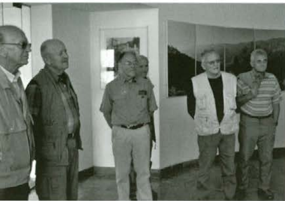
Na gozdni upravi v Idriji

Vsako leto se v različnih predelih Slovenije srečujemo kolegi enajste generacije študentov gozdarstva. Letos smo obiskali