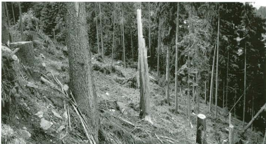
Ureditev vetrolomne površine pri Enciju na Pernicah

Gozdarji Zavoda za gozdove Slovenije po območnih enotah organizirajo poleg drugih izobraževanj tudi izobraževanje lastnikov gozdov iz gozdne tehnologije in gojenja in varstva gozdov. 4. junija smo imeli vodje odsekov za gojenje in varstvo gozdov delavnico, kako izvesti, še prej pa pritegniti lastnike gozdov na izobraževalno aktivnost. Tone Lesnik, vodja oddelka za stike z javnostjo v ZGS, je povedal, da je ZGS za lastnike gozdov izvedel na leto 104 delavnic iz gozdne tehnike in 72 delavnic iz gojenja gozdov. Gojitvenih delavnic in tečajev se udeleži manj udeležencev kot delavnic iz gozdne tehnike. Delavnico smo nadaljevali s sestankom in na Zaplani prisluhnili predavanju predstavnika firme BASF iz Nemčije, gospoda Thomasa Zühlke, ki nas je seznanil z novostmi na področju varstva gozdov. V firmi BASF izdelujejo feromonske pripravke in druga kontrolna lovna sredstva. Izdelali so Chalcoprax top in Pheroprax top, katera sta aktivna vse leto. Na trgu ju še ni, ker ju še testirajo.