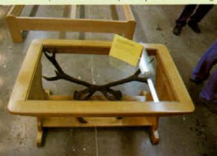
Klubska mizica z vkomponiranim rogovjem