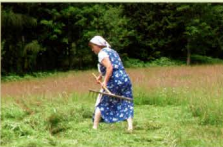
Grabljica pri lipi