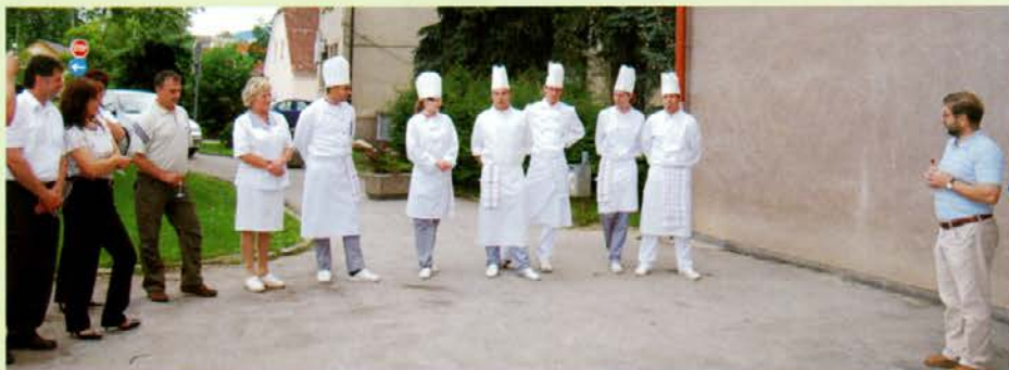
Ekipe kuharjev se predstavi