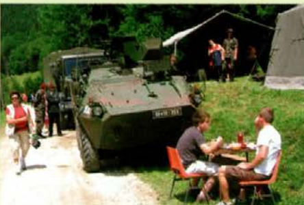
Vojaški pasulj je bil izvrsten