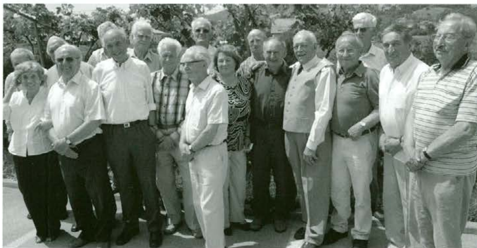
Naša generacija je v gozdarstvu pustila močan pečat

Pričakujem, da se bomo kleni in zdravi še leta srečevali.