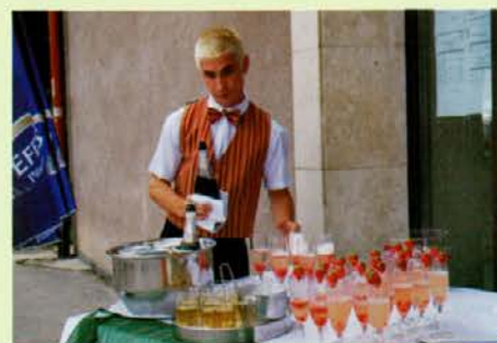
Dobrodošlica s koktajlom Jagodni poljub

Zaključni del izobraževanja pa vključuje tudi izdelke tako v gostinskem kot lesarskem programu. Letošnja generacija se je izredno potrudila. Kako je to bilo videti, pa kažejo fotografije.