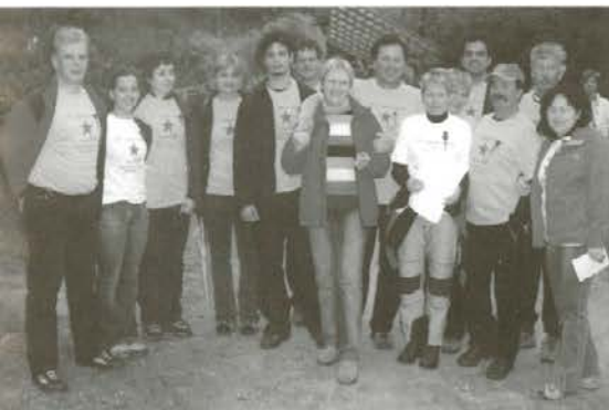
Tako smo se zbrali na zvezdi pod Rahtelom

Z leti ima človek vse več časa za razmišljanje. Rad se umakne v samoto in misli mu preletavajo pretekle dogodke. Ob njih se sladko nasmeje ali pa mu grenki priokus zareže gubo v obraz. Nemalokrat sedem na svoj balkon in pogled me ponese proti Rahtelu. Vsako drevo zaznam, opazujem razlike, ki črtajo pobočje, ki se strmo dviga proti vrhu. Vmes me očara zvezda, ki je včasih vsako leto gorela ob 27. aprilu, dnevu OF. Nemalokrat sem bil sam poleg in s harmoniko obeležil spomin na OF. Naše počutje je bilo radostno, vzničeno in udarno, kot je bila udarna pesem, ki se je slišala daleč naokoli. Tako je bilo včasih in prav je, da se veseli in radostni dogodki, ki so krojili dušo Slovencev, ne zabrišejo, pač pa rastejo z nami, z našimi otroki, z našimi vnuki naprej.