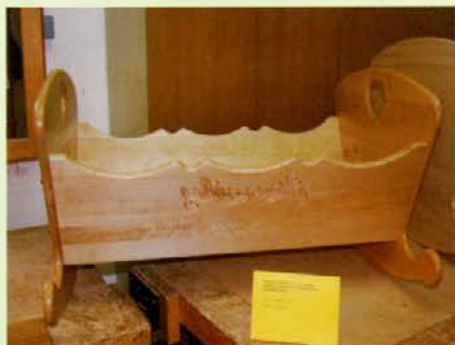
Zibelka z rezbarjenim motivom (srca sta izdelani s pomočjo CNC rezkalnega stroja)