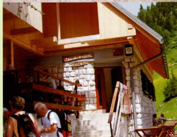
Lepo vgrajen leseni del na že obstoječem starem objektu planinskega doma na Zelenici