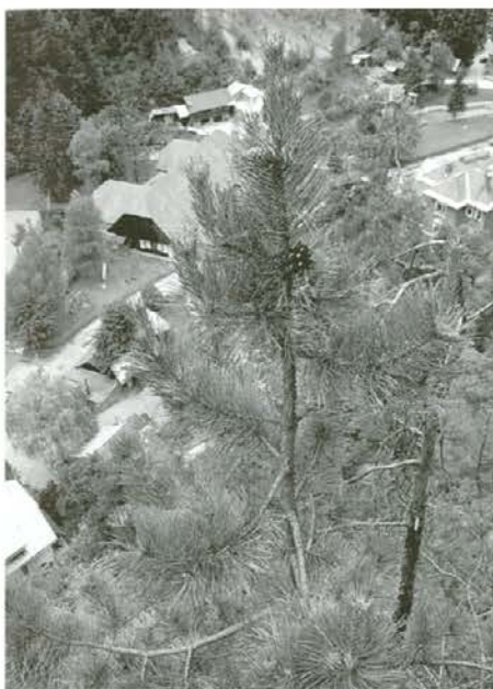
Pogled na Žerjav skozi krošnjo črnega bora