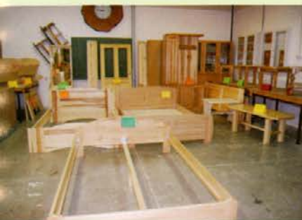
Razstavljeni izdelki dijakov lesarskih programov