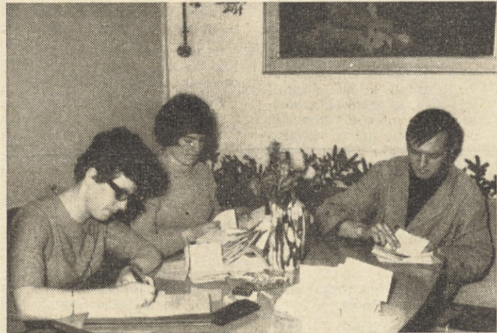
Na sliki zgoraj je volilna komisija RTS pri preštovanju glasov, spodaj pa volilna komisija na drugonagrajenem volišču — velopnevmatikarna