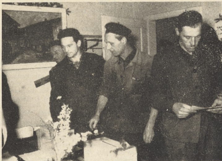
Na volišču mehanične delavnice v obratu II.

Pripominjamo, da smo vse podatke, navedene v tabeli, vzeli iz zapisnika centralne volilne komisije, omenjeni rezultati pa veljajo samo za letos izvoljene člane DSP